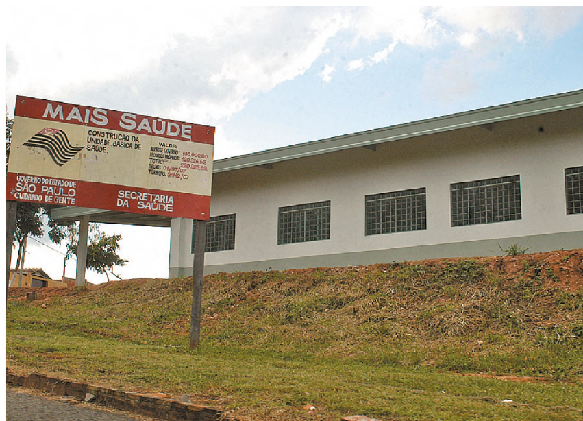
À esquerda, obras do posto de saúde que deve ser entregue até o final do ano; à direita, o Centro de Educação Infantil que deve ser concluído nas próximas semanas