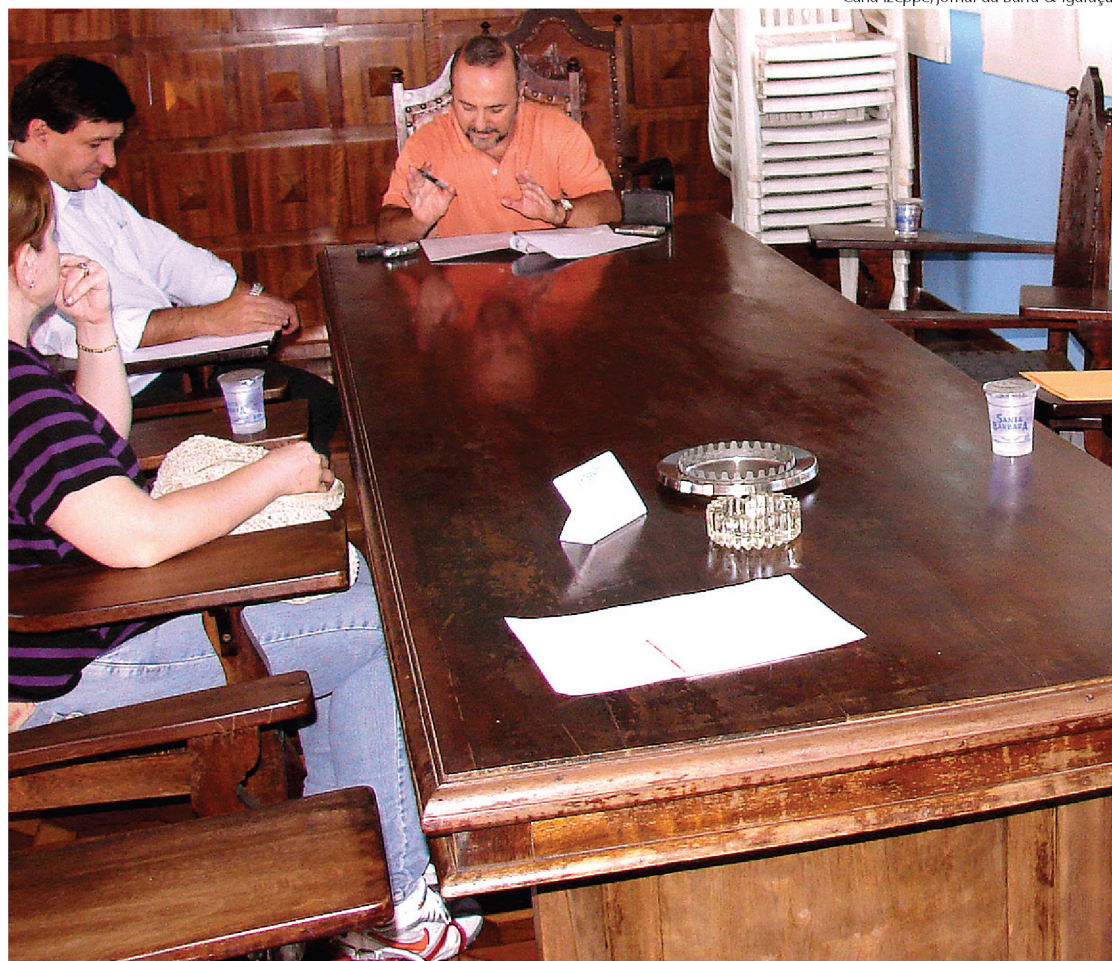
Prefeito e vereador convocaram a imprensa para anunciar o subsídio aos fabricantes de calçados

O Prodicar foi criado por Gava no ano passado depois de várias reuniões com empresários do setor. "O objetivo dos encontros foi definir como o poder público poderia ajudar o setor", disse o vereador. "E chegou-se a conclusão de que isso pode ser feito de duas formas: uma é a qualificação de mão-de-obra, que vai ser viabilizada através da instalação do CVT (Centro Vocacional Tecnológico), que