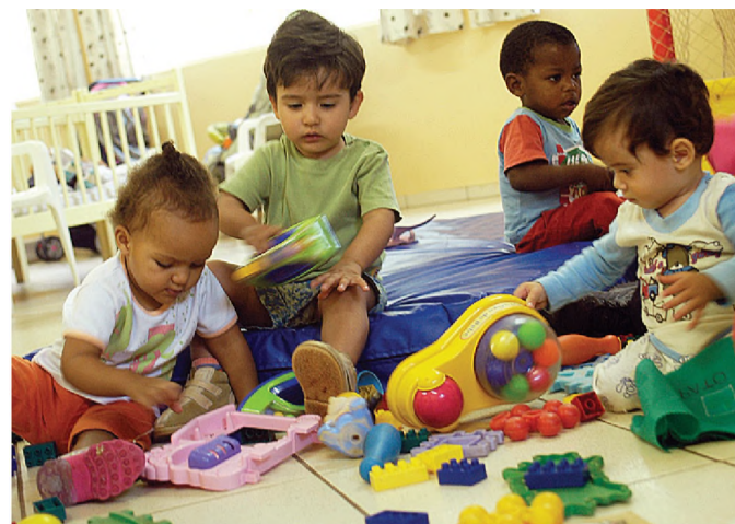
Com exceção das creches, serviços públicos da prefeitura de Lençóis não funcionam amanhã