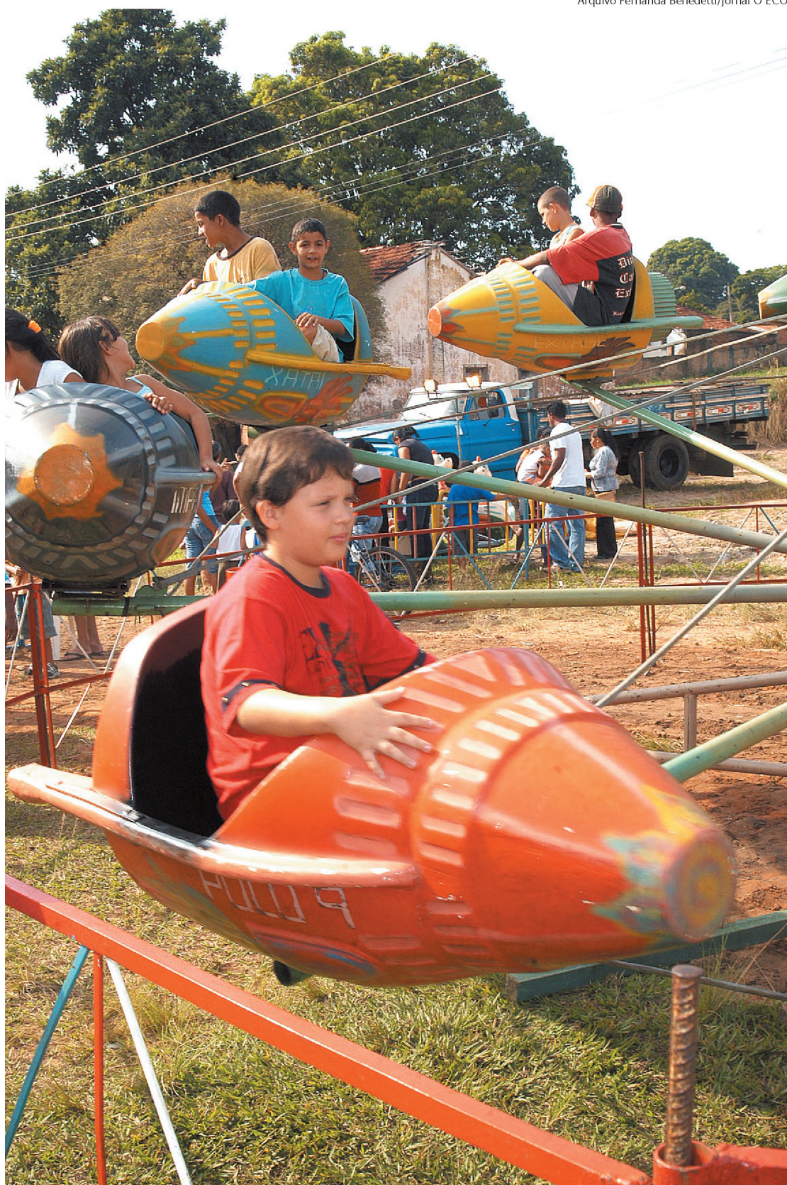
No sábado e domingo tem parque de diversões montado para as crianças de até oito anos