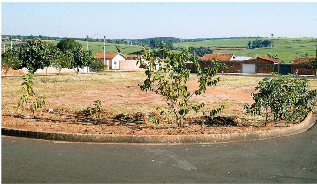
Área onde será investido o recurso estadual para a construção de mais uma praça esportiva

Segundo a assessoria da CDHU, 80% do valor das obras são repassados pela Secretaria da Habitação sem ônus à população. A prefeitura investe os 20% restantes. Na região, 11 municípios assinaram o convênio - Arealva, Avaí, Bariri, Bocaina, Boracéia, Cabralia Paulista, Cafelândia, Lençóis Paulista, Lins, Piratininga e Pongai.