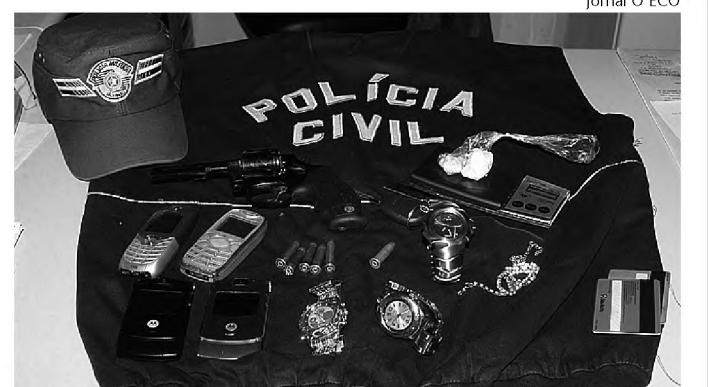
Polícia Civil prende dois por tráfico no Jardim Primavera