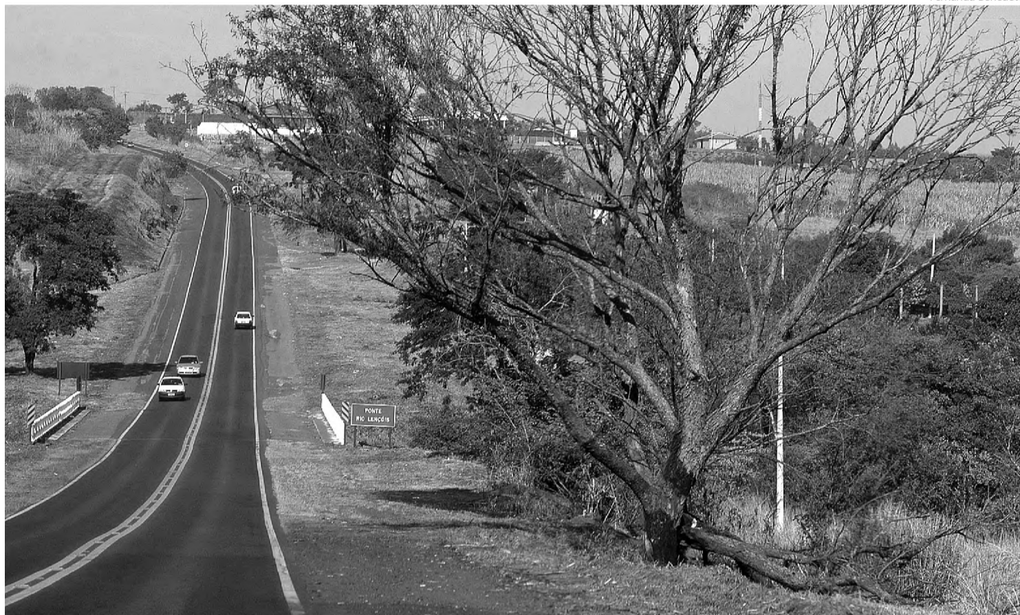
Vegetação às margens da rodovia Osny Matheus pegou fogo e formou cortina de fumaça; visibilidade do trecho foi afetada