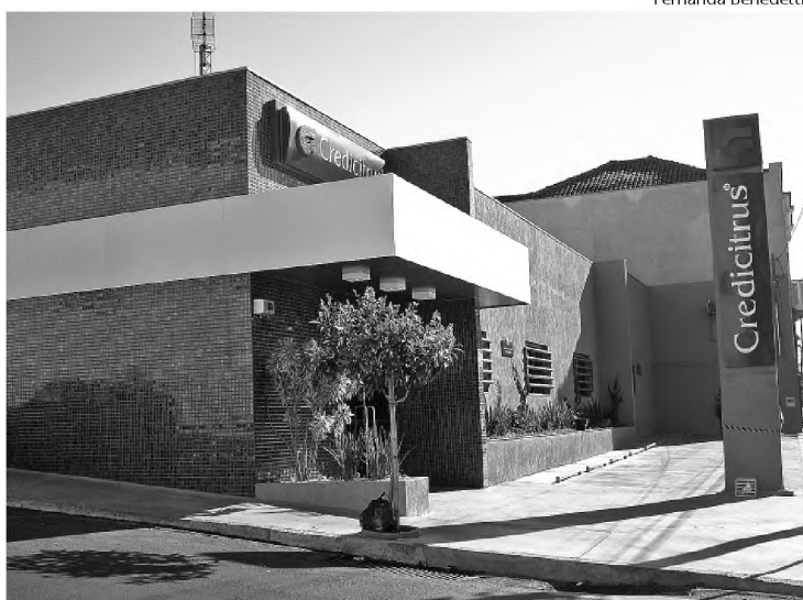
Nova sede da Credicitrus será inaugurada hoje em Lençóis Paulista