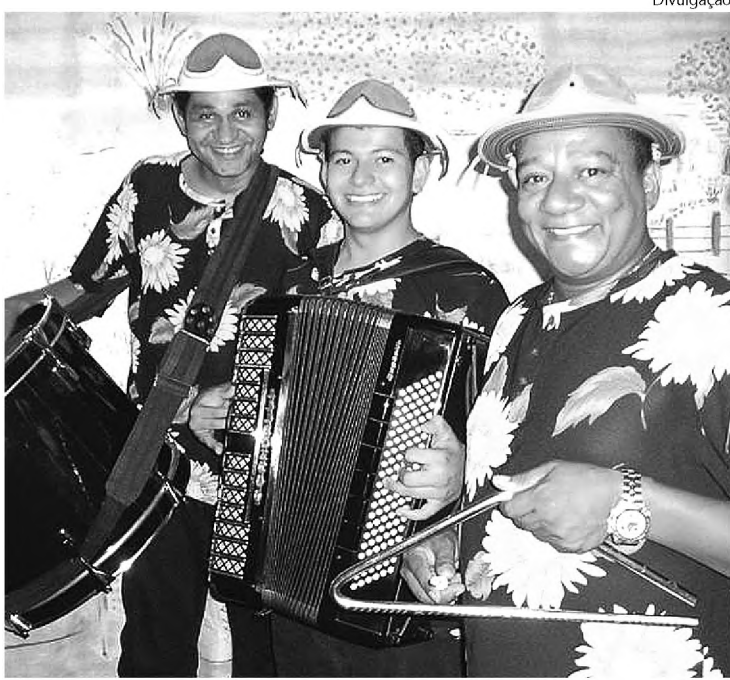
Trio Ararape se apresenta no sábado 2, no Toniquinho

No sábado 2, a programação começa mais cedo. Entre 10h e 12h, tem workshop de forró universitário na praça Comendador José Zillo, a Concha Acústica, com o professor Leon Mastrangeli, da Casa de Forró de Bauru. As aulas são voltadas para todas