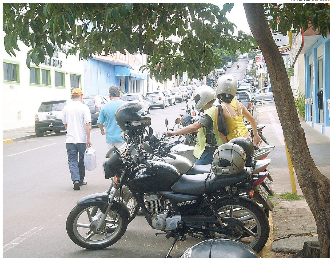
Nova lei que regulamenta o serviço de moto-taxistas não deve alterar a rotina em Lençóis