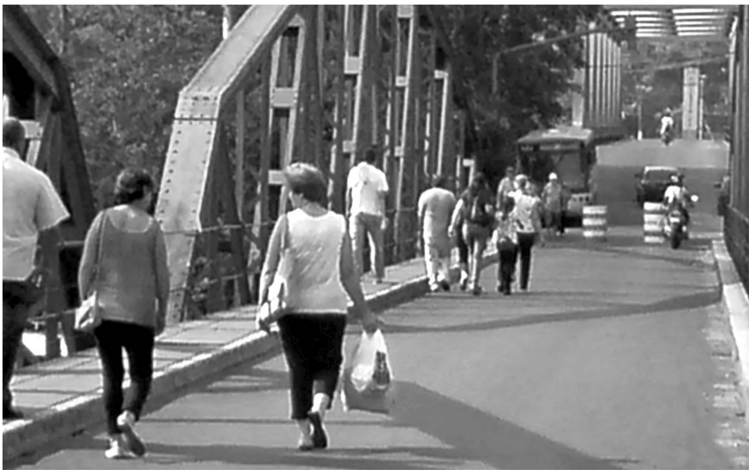
Ponte Campos Salles está liberada apenas para pedestres, ciclistas e motociclistas; determinação foi do Ministério Público

"O laudo completo com todas as providências que devem ser tomadas por nós deve ficar pronto só em dezembro, mas nos recomendaram proibir imediatamente o trânsito de caminhões e ônibus", explicou o policial militar. "Por isso vamos colocar pórtico (barra de ferro) de até 2,10 metros que irá limitar a altura dos veículos. Enquanto não é instalado, deixaremos o tráfego