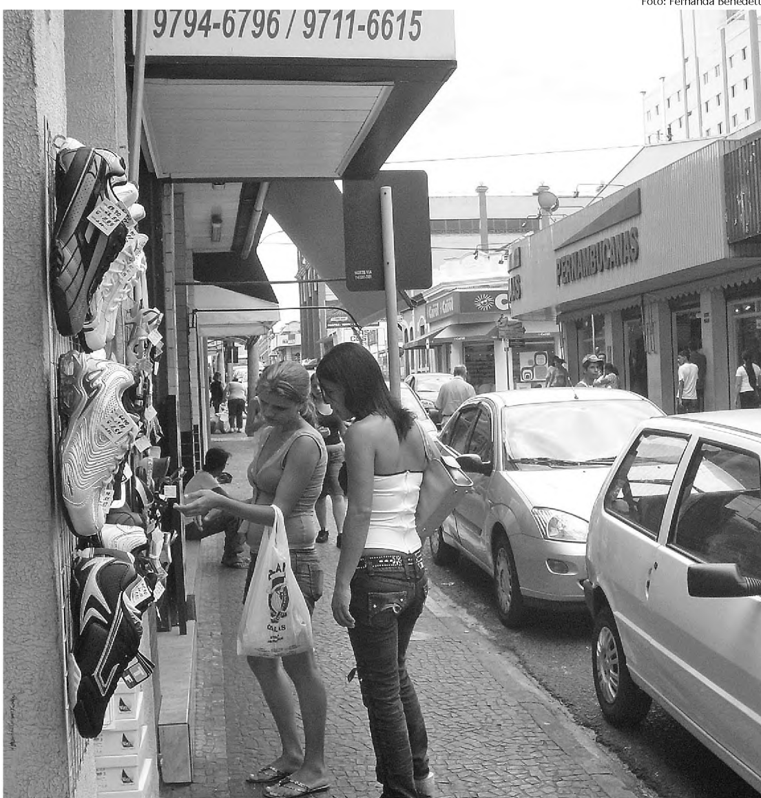
Lojistas de Lençóis já se preparam para as vendas de Natal; 13º deve injetar R$ 22 milhões na economia