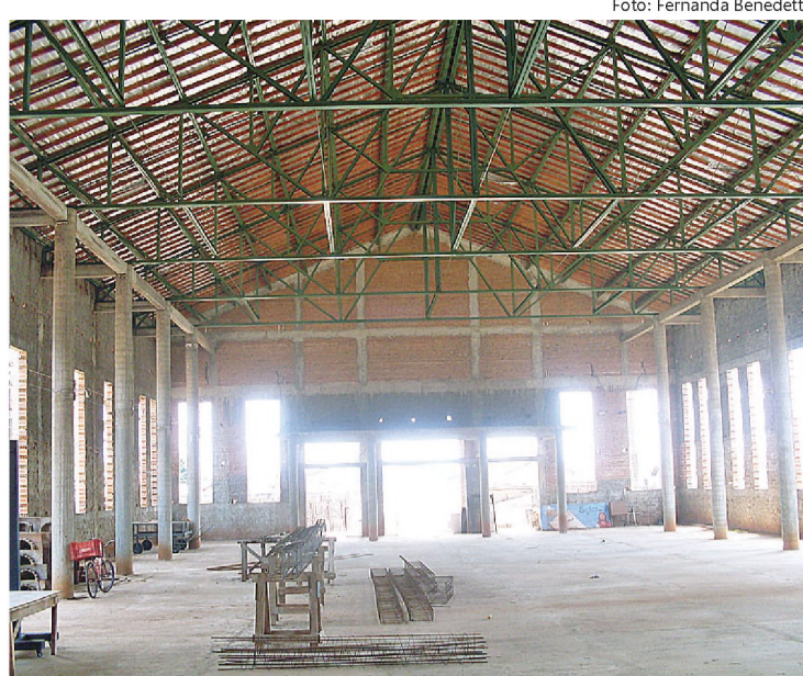
Matriz de São Pedro e São Paulo está orçada em R$ 1,3 milhão

A comissão organizadora de festas da paróquia vem trabalhando há cerca de dois