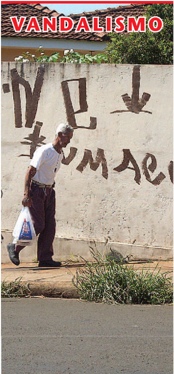
Muros são alvos de pichadores