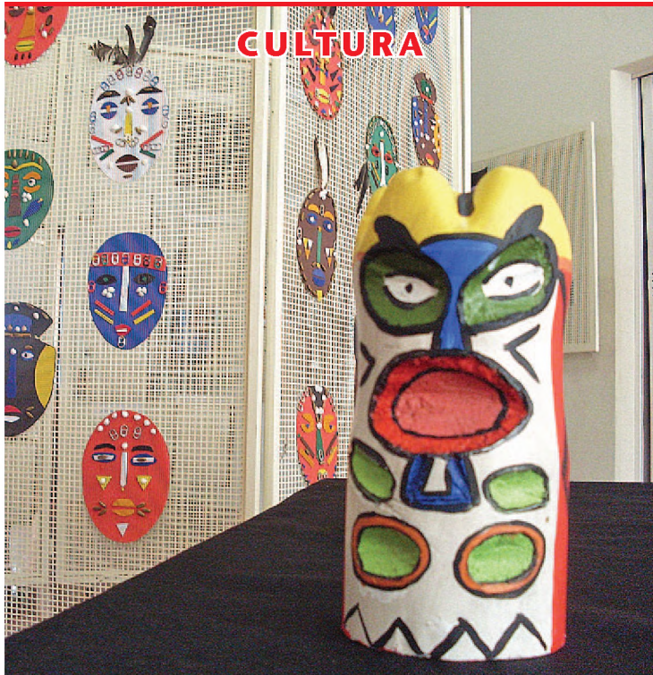
Na Casa da Cultura de Lençóis Paulista estão expostas máscaras