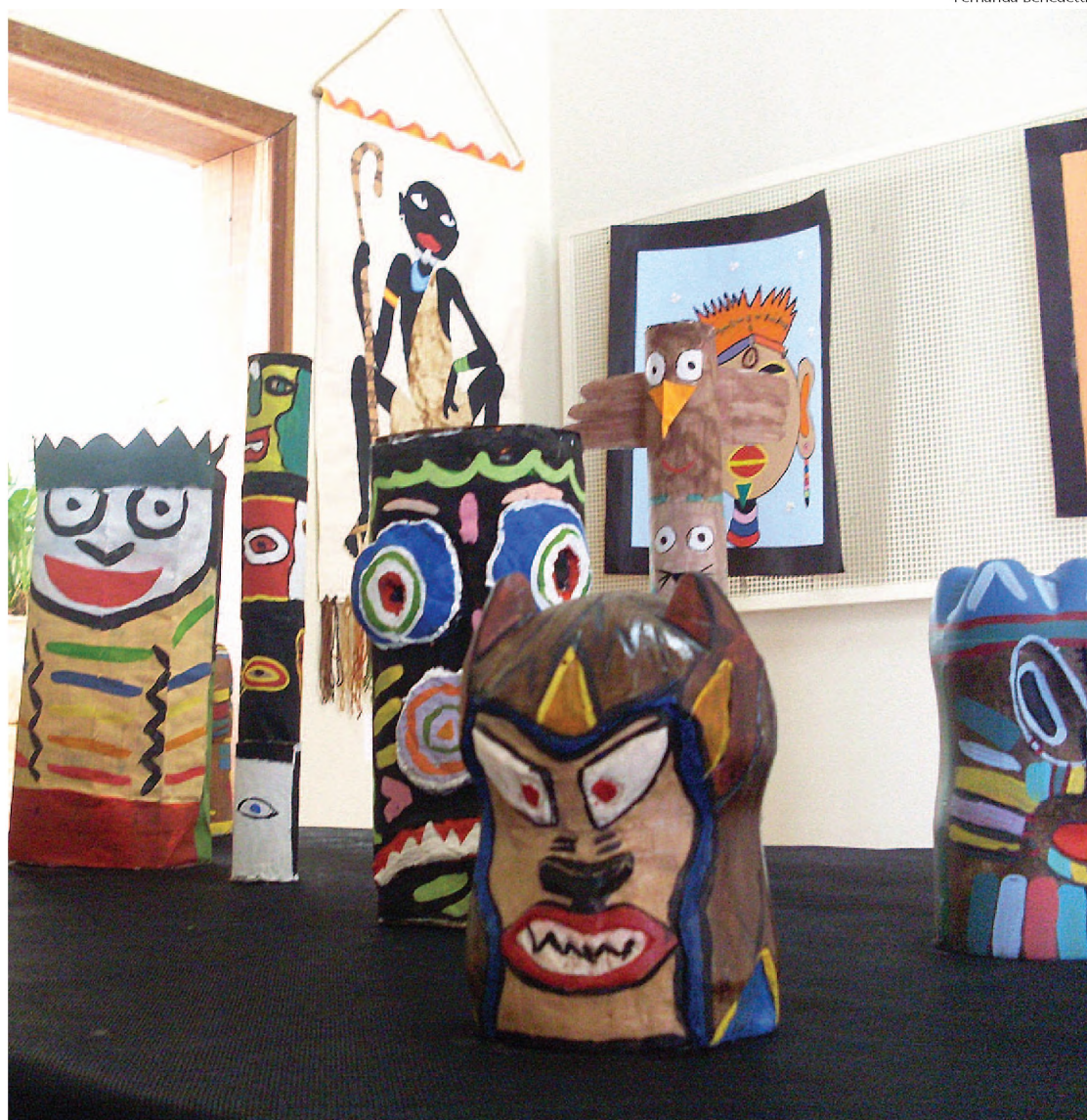
Carrancas feitas por alunos da escola Paulo Zillo fazem parte da exposição na Casa da Cultura de Lençóis