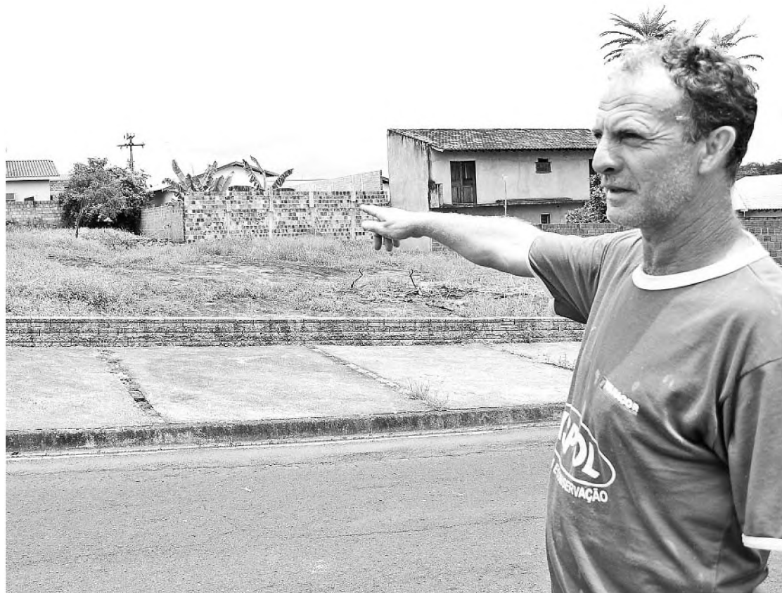
Morador mostra terreno que está sendo utilizado como banheiro por frequentadores do Parque

Algumas pessoas também procuraram o jornal O ECO para reclamar do lixo que é deixado no Parque do Povo depois que os visitantes vão embora. Entretanto, o local possui diversas lixeiras. Um morador disse que não se sente mais a vontade de passar com o filho porque pelo caminho encontra até cacos de vidro.