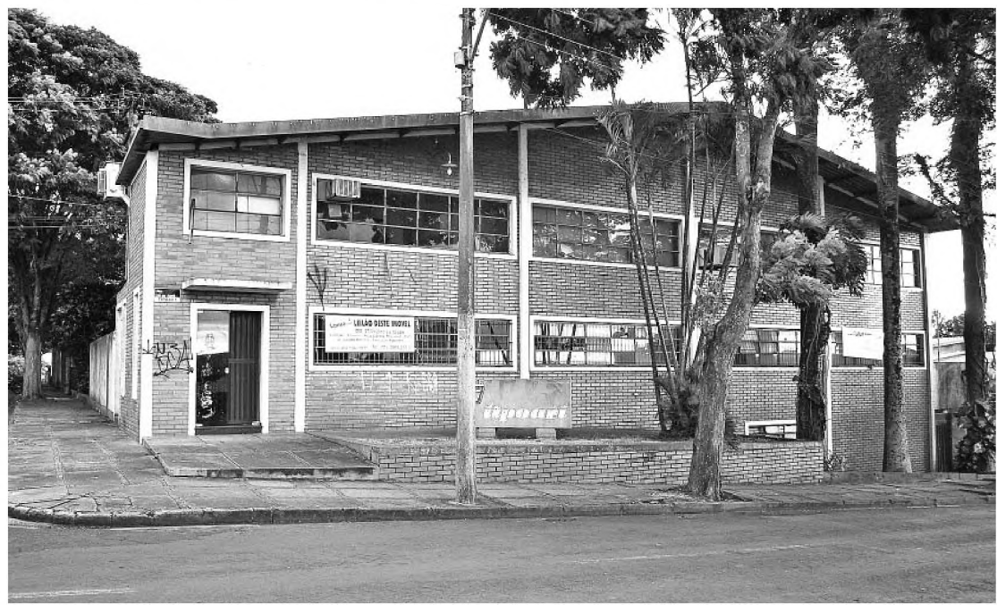
Empresa tem dívidas trabalhistas e está fechada desde 2002; prédio já foi a leilão em 2005

A empresa responde a ação na Justiça do Trabalho por salários atrasados, dívidas com INSS (Instituto Nacional de Seguridade Social) e FGTS (Fundo de Garantia do Tempo de Serviço). Alguns antigos funcionários também movem ações por danos.