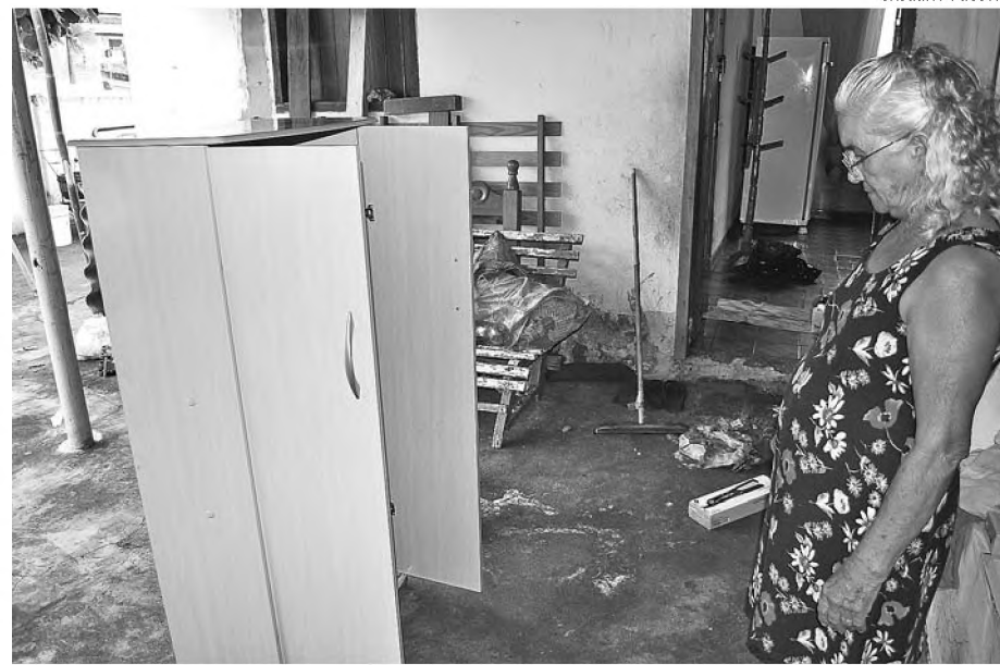
Na avenida Luciano Bernardes, água invadiu casas e trouxe prejuízos para moradores

FORÇA DA ÁGUA A chuva que caiu em Lençóis Paulista no sábado 23 fez estragos na Rua Walter Moretto, Jardim Itapuã. Segundo moradores, a água chegou a cerca de dez centímetros de altura. Não houve registro de inundações nos imóveis, mas uma motocicleta que estava estacionada na rua teria sido arrastada pela correnteza até a Avenida Henrique Losinkas Alves. A força da enxurrada arrancou pedaços do asfalto e parte das obras de construção da rede de galerias, que vem sendo realizada pela Prefeitura, foi danificada. No domingo 24, moradores ainda retiravam as pedras que desprenderam das valas abertas no asfalto.