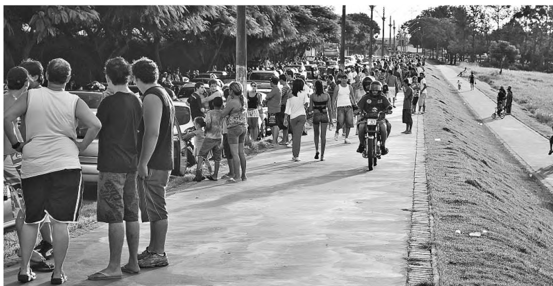
Movimento do domingo; estimativa é de que mil pessoas tenham passado pelo Parque do Povo

Rua 7 de Setembro, 963 - Lençóis Paulista - Fone: (14) 3264-6249