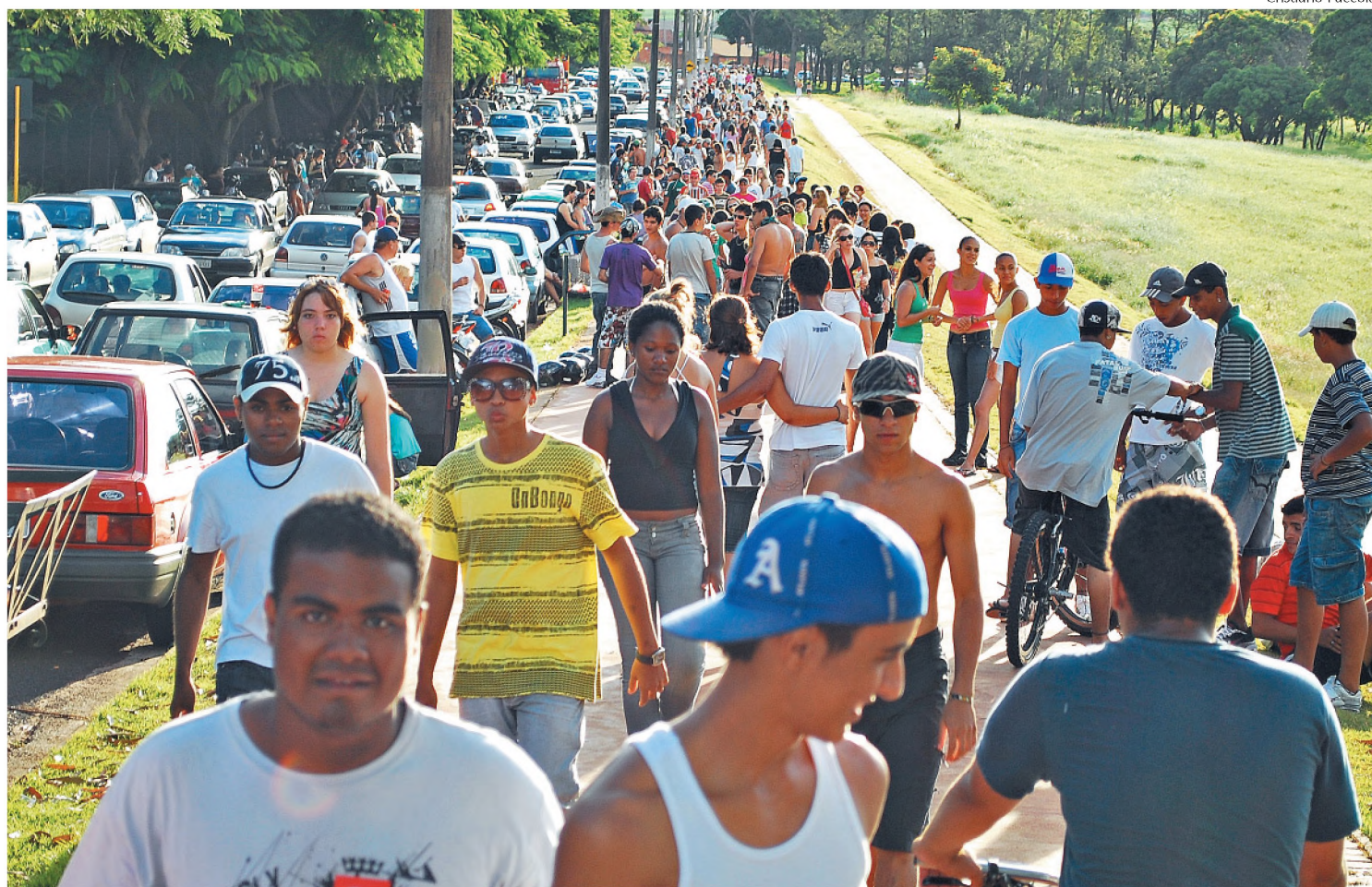
Vista do Parque do Paradão, alvo das reclamações, na tarde do último domingo; estima-se que mil pessoas passaram pelo local

Moradores dizem que visitantes usam terrenos como banheiro; Prefeitura vai construir sanitários e lanchonete