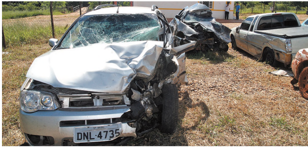
Carros envolvidos no acidente na rodovia Comandante João Ribeiro de Barros, no sábado

funcionários viram uma moto sair em alta velocidade com o autor do roubo na garupa. A Polícia Militar foi acionada e realizou o patrulhamento pelas imediações. Numa rua próxima, a PM encontrou R$ 480 caídos no chão, que podem ter caído do bolso do bandido durante a fuga. No local não existe câmera. O funcionário afirmou ter acionado o alarme que fica sob o balcão, mas ele não funcionou.