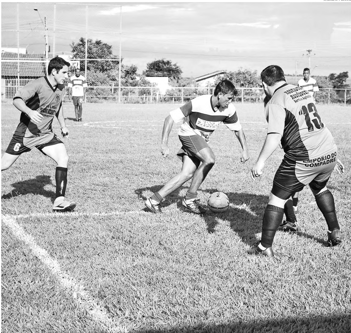
Lance do jogo que abriu a Copa; União Agrícola e Academia Athenas empataram em 3 a 3; competição recomeça no sábado 30

Doze equipes participam da competição, divididas em três grupos. O grupo A tem Jardim América, Foto Studio, Real e Monte Azul. Já o grupo B é formado por União Agrícola, Nações Unidas, Academia Athenas e Amigos da Fisio de Macatuba. O grupo C é composto pelas equipes Millenium, Palestra/Escritório Ventura/Padoka, Ubirama