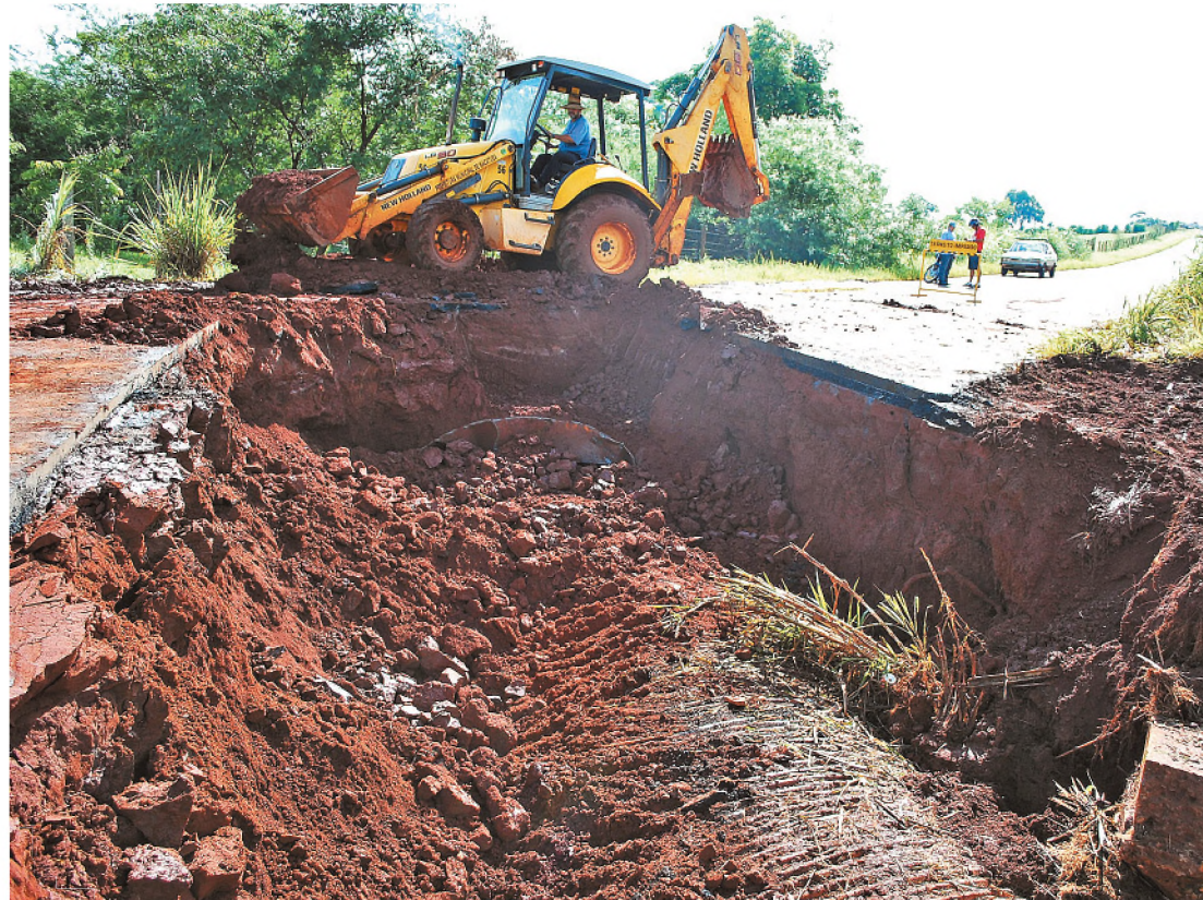
Chuva carregou asfalto na estrada vicinal Lauro Perazzoli e formou uma grande cratera

A chuva do último domingo deixou um rastro de destruição em Macatuba. O córrego Bocaiúva transbordou e destruiu parte estrada vicinal Lauro Perazzoli – que liga o município a Igarapu do Tietê. A estrada foi interditada e o