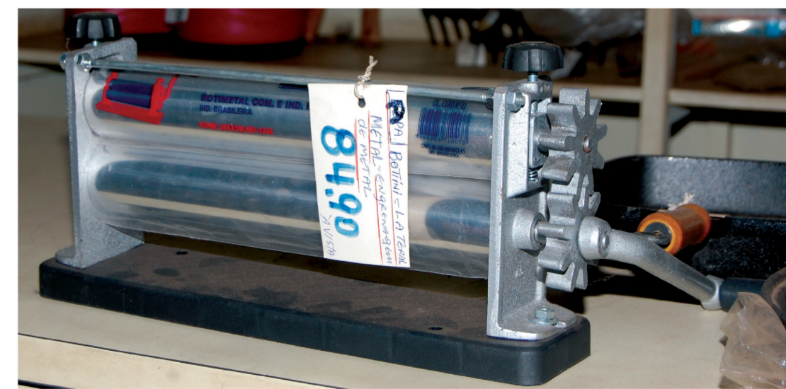
Entre as prateleiras podem ser encontrados, por exemplo, o já aposentado cilindro de massa de pão

Botinas, guarda-chuvas, cintos e uma variedade de outras mercadorias são algumas das especialidades da Casa Paccola