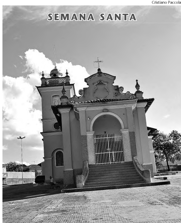
Matriz de Santo Antonio, em Agudos, onde começa o teatro