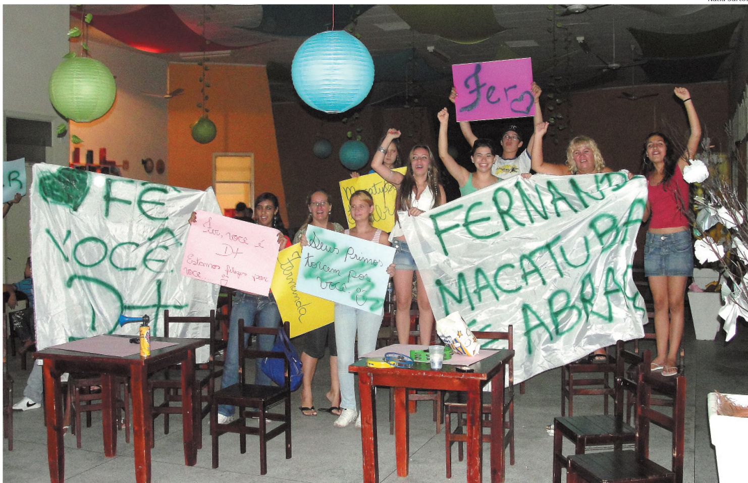
Macatubenses demonstraram a torcida por Fernanda com faixas e cartazes; reunião aconteceu no Clube Esportivo e Cultural

Para os macatubenses que acompanharam a final pela televisão um dos momentos de maior frisson foi quando o apresentador Pedro Bial disse o nome da cidade em cadeia nacional.