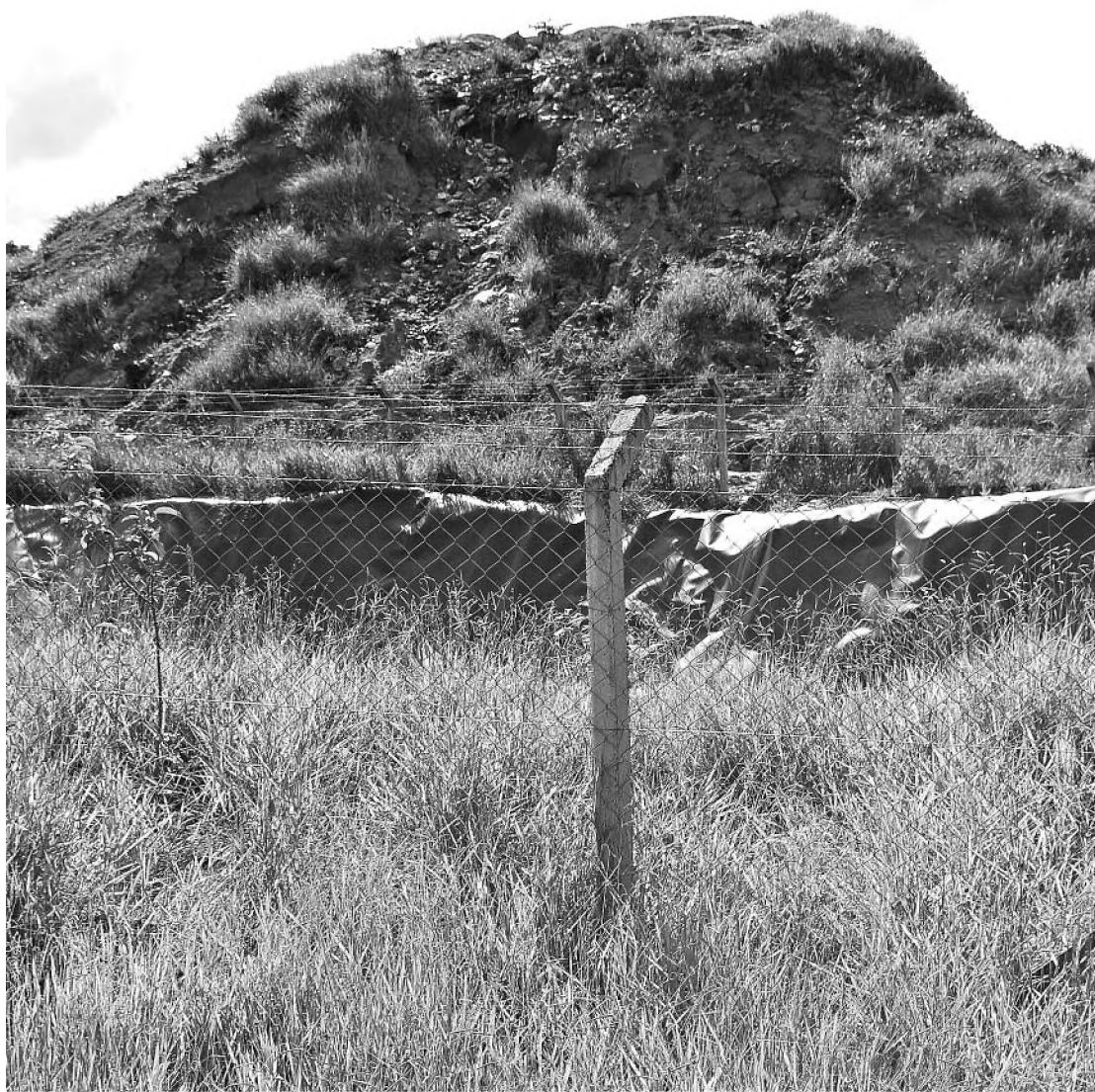
Aterro sanitário de Agudos apresenta várias irregularidades e pode ser interditado, segundo Cetesb

As multas aplicadas pela Cetesb são definidas pelo valor da Ufesp (unidade fiscal do Estado de São Paulo). A penalização inicial é prevista em 600 Ufesp, cerca de R$ 10 mil, mas a reincidência pode elevar o valor para mais de R$ 40 mil.