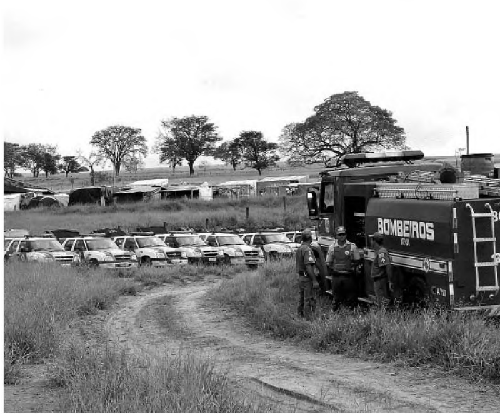
Saída dos sem-terra de fazenda de Agudos foi pacífica

De acordo com o major, o único incidente foi uma discussão do líder do MST, que chegou bem depois do