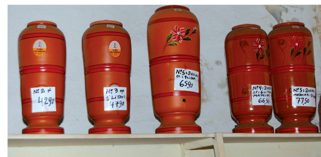
Filtros de barro são mais um dos produtos raros que podem ser comprados na loja

Ao contrário do hábito atual de atendimento no comércio, o cliente da Casa Paccola recebe toda a atenção do dono do estabelecimento, que é o primeiro e o último a deixar a loja todos os dias. O visitante tem à disposição uma infinidade de produtos, cuja escolha conta com toda a disponibilidade de ajuda e sugestões de Roberval. Uma aproximação fundamental para captivar o cliente e muito pouco praticada, principalmente nos tempos atuais.