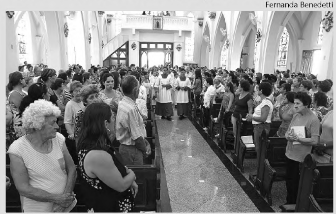
Abertura da semana de orações lotou o Santuário

Uma missa celebrada na tarde de ontem no Santuário Nossa Senhora da Piedade marcou a abertura do 10º Cerco de Jericó em Lençóis Paulista. A cerimônia também abriu oficialmente a Campanha da Fraternidade 2009, que traz como tema 'Fraternidade e Segurança Pública'.