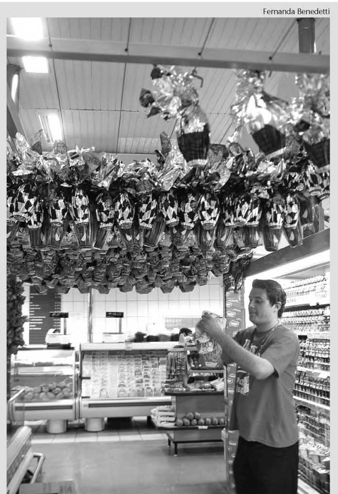
PÁSCOA Ontem pela manhã, os funcionários de grandes marcas de ovos de páscoa já enfeitavam os supermercados em Lençóis Paulista e toda região. O prazer de comer um bom chocolate vai custar entre 85 e 9% mais caro este ano em relação ao ano passado.