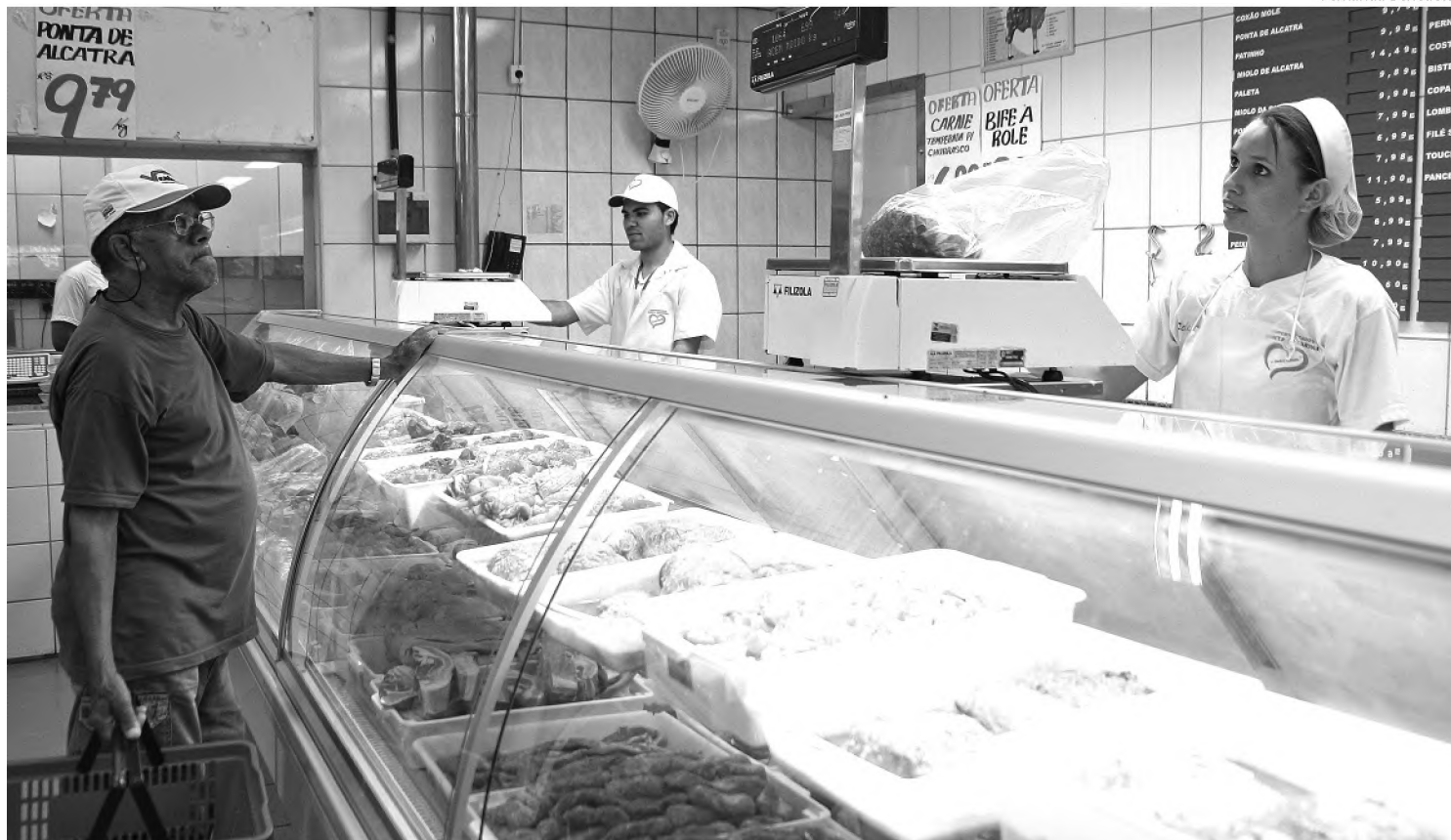
A tradição de comer peixe na quarta-feira de Cinzas perde adeptos; ontem, os açougues não registraram queda na venda de carne

Em plena quarta-feira de Cinzas, açougues tiveram filas para vender carne vermelha; consumo de peixe aumenta às sextas-feiras do período de quaresma