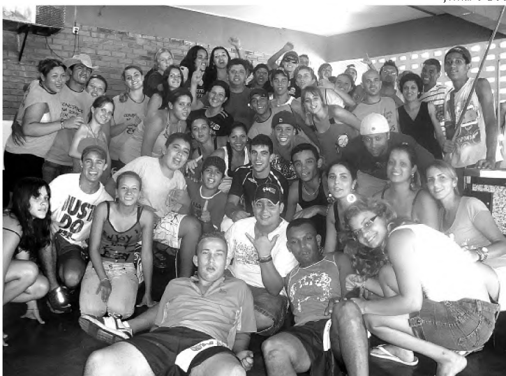
Mais de 100 jovens da Igreja Batista participaram de retiro