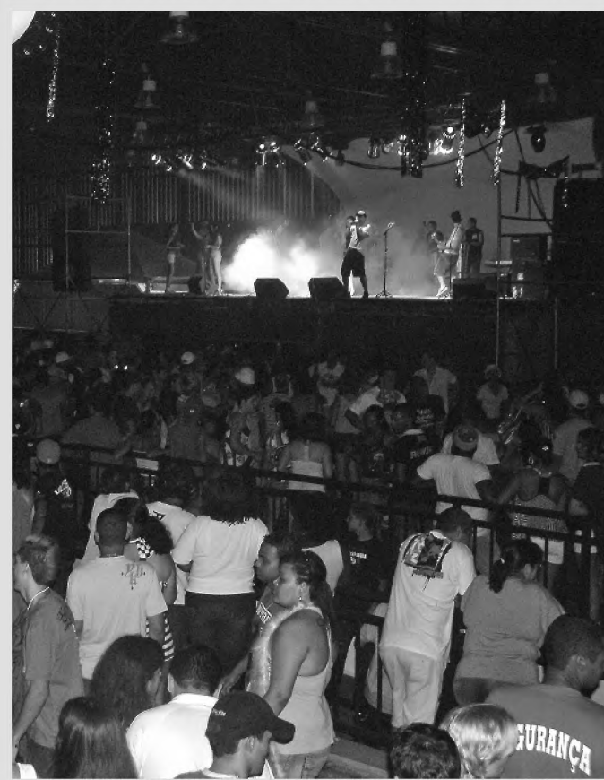
Pavilhão de Exposições recebeu 15 mil foliões em 4 dias de festa