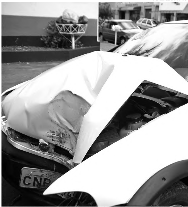
Fiat Strada que se envolveu em acidente na avenida Padre Salústio