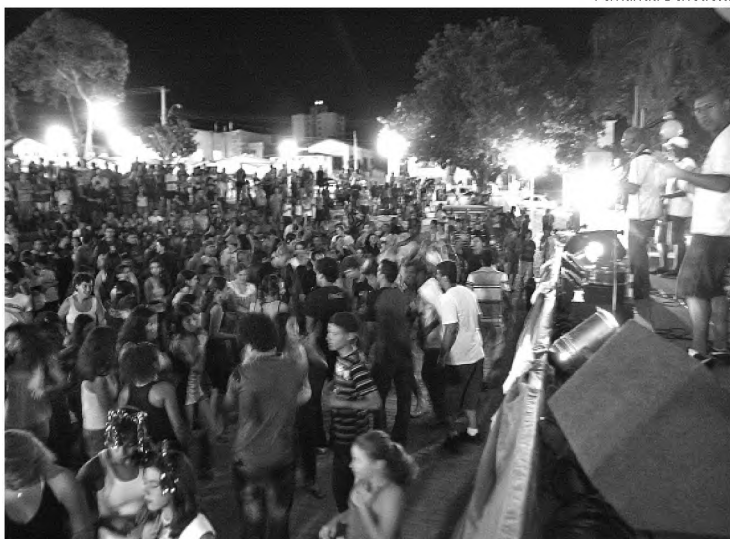
Concha Acústica reuniu milhares de fiéis no Carnaval com Cristo