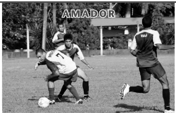
Lance do jogo em que o União da Vila e Atlético empataram em 1 a 1