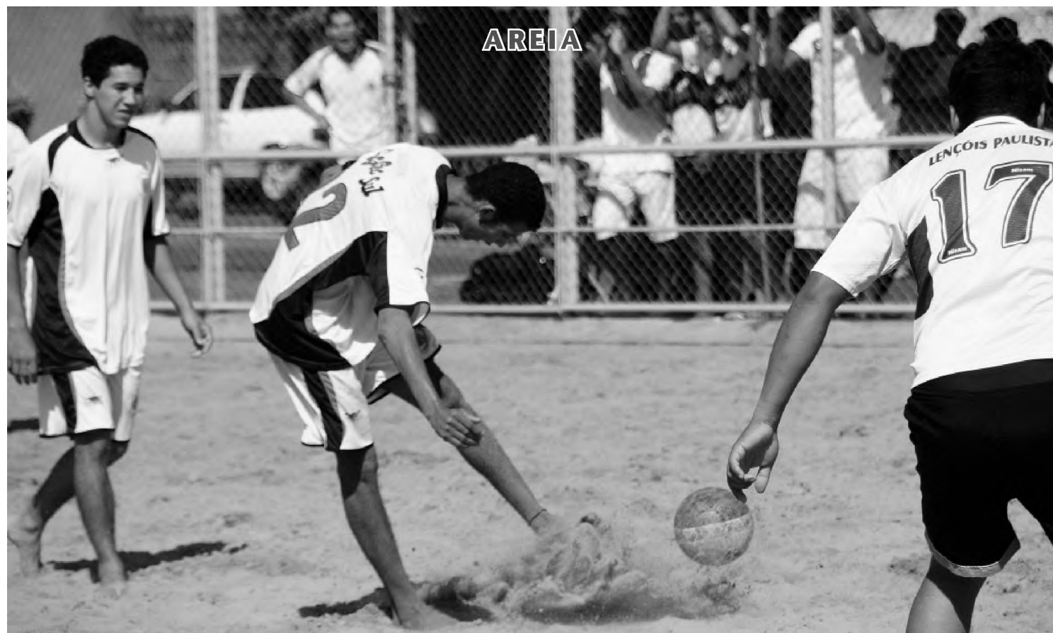
Primavera/Millennium garantiu a primeira vitória na Copa Sport Shoes de Futebol de Areia sobre a equipe dos Pingáticos