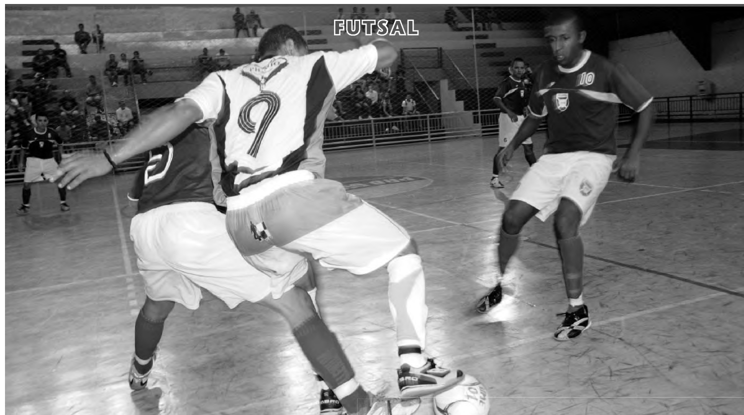
Associação Lençoense goleou a Prefeitura de Pratânia pela Copa Cidade do Livro de Futsal; placar do jogo foi de 4 a 1