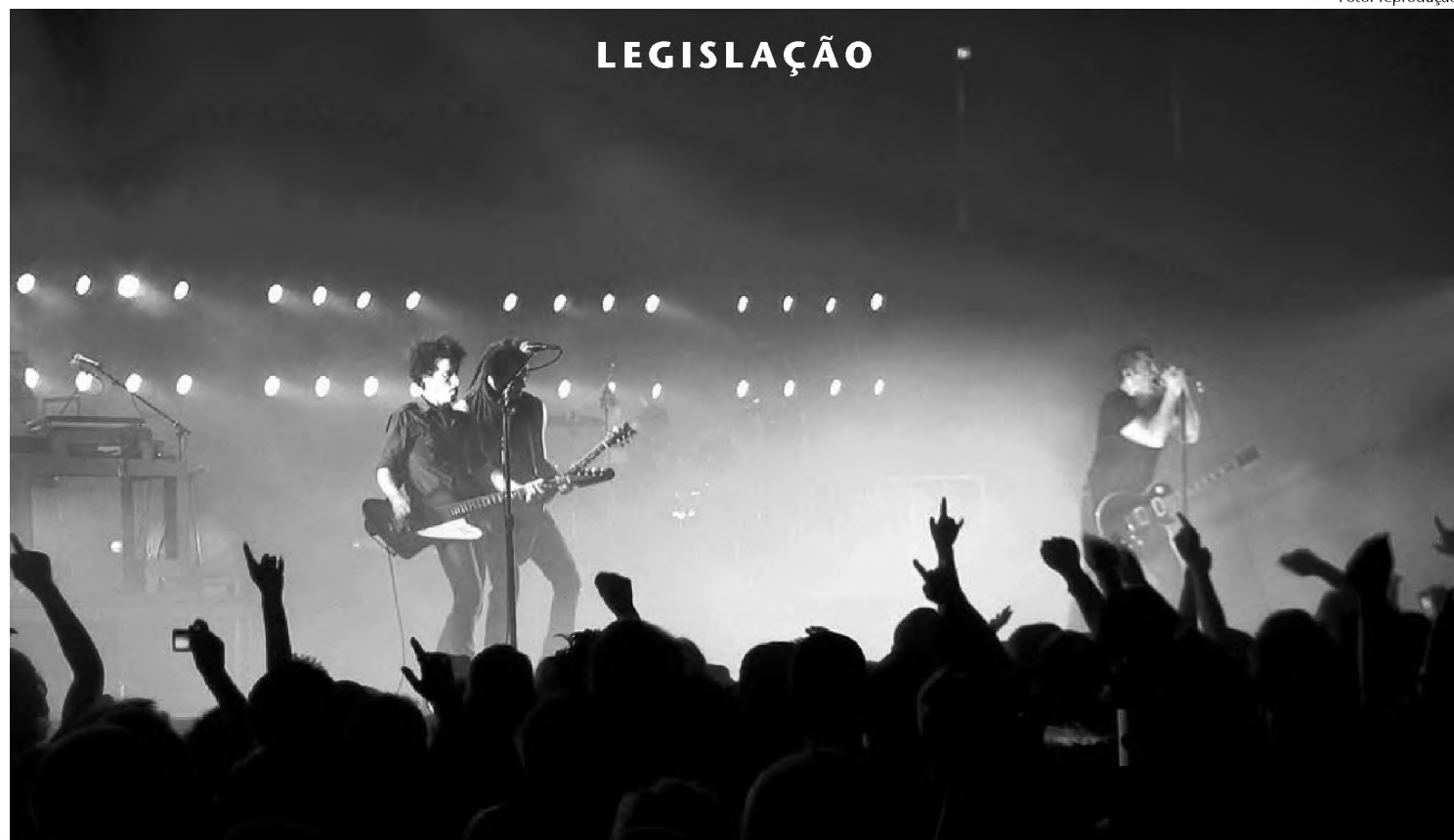
Cena do show do Nine Inch Nails, que teve vídeos em alta definição; artistas consagrados já aderiram à criação colaborativa