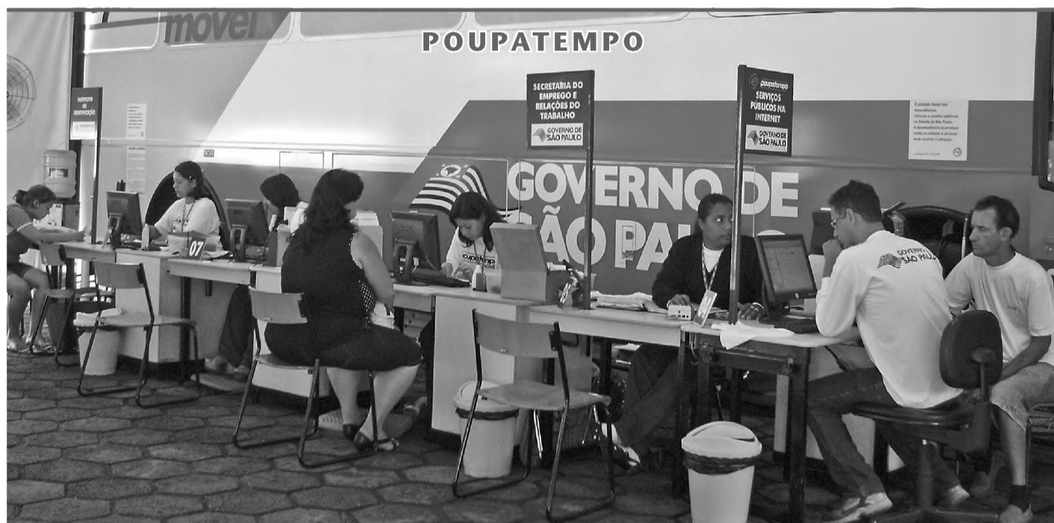
A unidade do Poupatempo Móvel vai dar plantão em Macatuba até o sábado 7. O posto está instalado no Terminal Rodoviário Fernando Valezi Filho. Os serviços estarão disponíveis de segunda a sábado, das 9h às 16h. No Poupatempo Móvel são prestados serviços públicos como emissão de carteira de trabalho, RG e atestado de antecedentes criminais, além de mais de dois mil serviços eletrônicos pelo e-poupatempo.