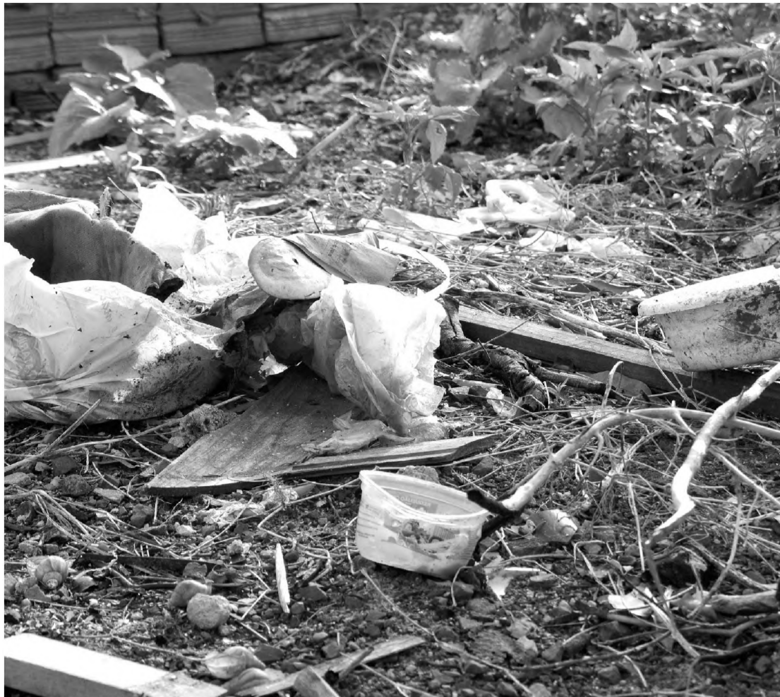
Na tarde de ontem, esta era a situação de um terreno localizado no Jardim Ubirama, em Lençóis

A dengue é uma doença causada pela picada do mosquito Aedes aegypti , que se desenvolve em água limpa e parada. Existem duas formas de dengue: a clássica e a hemorrágica. A dengue clássica apresenta sintomas como febre, dor de cabeça, dor no corpo, nas articulações e por trás dos olhos. A doença ataca crianças e adultos, mas raramente mata. Já a forma hemorrágica é a mais severa. Além dos sintomas clássicos, pode provocar hemorragias e levar à morte.