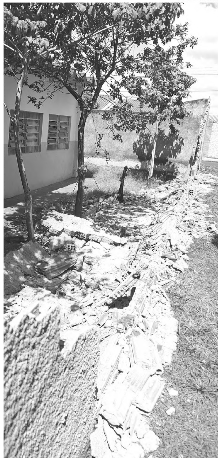
Vândalos destroem 13 metros de muro da escola Malatrasi

No sábado, a escola Antonieta Malatrasi foi tema de reportagem de O ECO porque conseguiu cumprir as metas estipuladas pelo Idesp (Índice de Desenvolvimento das Escolas do Estado de São Paulo), que mede a qualidade do ensino. Antes de o jornal chegar às ruas, o muro já havia sido destruído pelos vândalos.