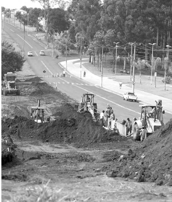
Troca de uma adutora fechou trânsito na Lázaro Brígido