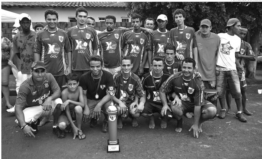
Jogadores do Grêmio Cecap posam com o troféu de campeão da Copa Sport Shoes