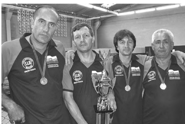
Bochófilos de Lençóis venceram rodada do Interseleções

A segunda rodada da primeira fase do Campeonato