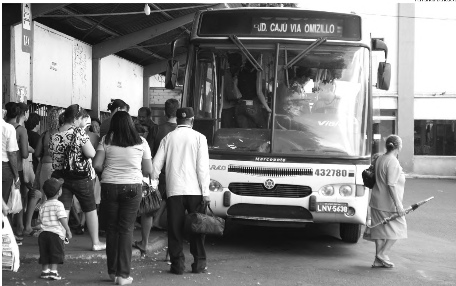
Viação Mourão pede e Bel concede reajuste para circular; passagem custa R$ 1,95 desde ontem

Preço do circular sobe para R$ 1,95; usuários reclamam e Prefeitura diz que precisou recompor o equilíbrio econômico-financeiro da Viação Mourão