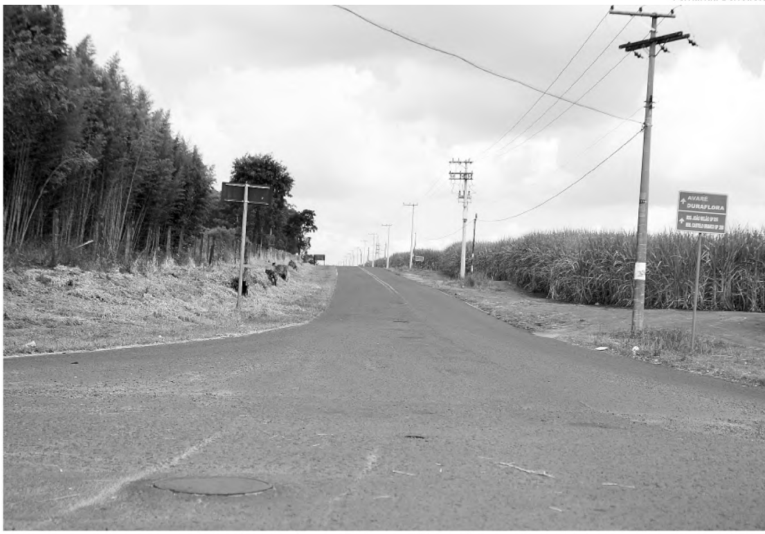
Estrada que dá acesso ao Rio Claro; ladrões roubaram 128 cabeças de gado em 7 dias nessa região

Enquanto três bandidos carregavam o gado em dois caminhões, o outro ficou tomando conta dos reféns até as 5h30 quando um carro passou para pegá-lo. Em seguida, as vítimas acionaram a Polícia Militar que foi até o local, mas já não encontrou