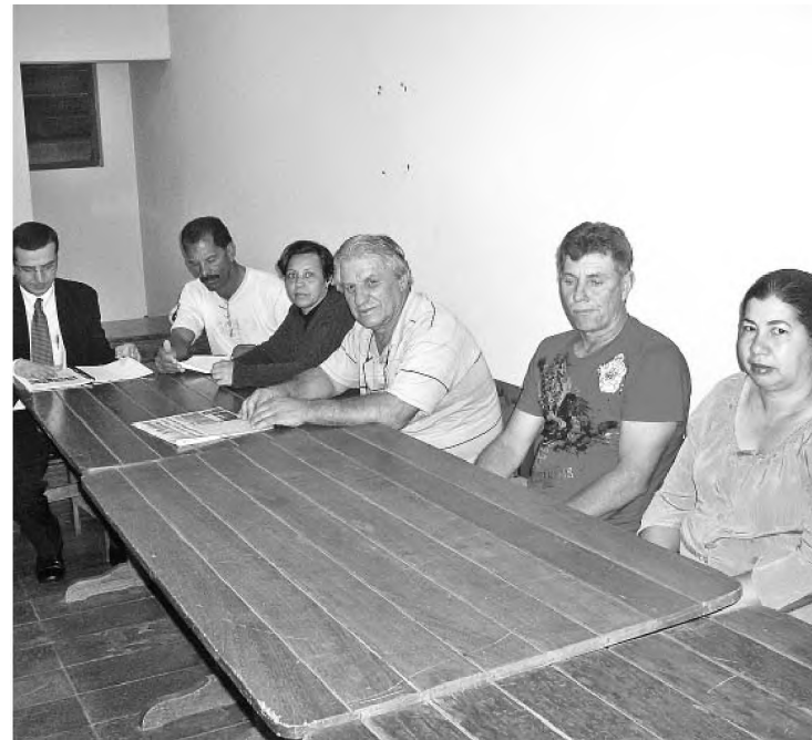
Sindicato dos Servidores de Macatuba faz reunião para discutir cortes no pagamento do adicional de insalubridade e periculosidade