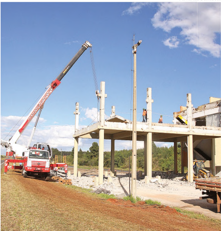
Praça de pedágio em Agudos passa por reformas; cobrança de tarifa, que começa em outubro, vai encarecer viagem de Lençóis a Bauru