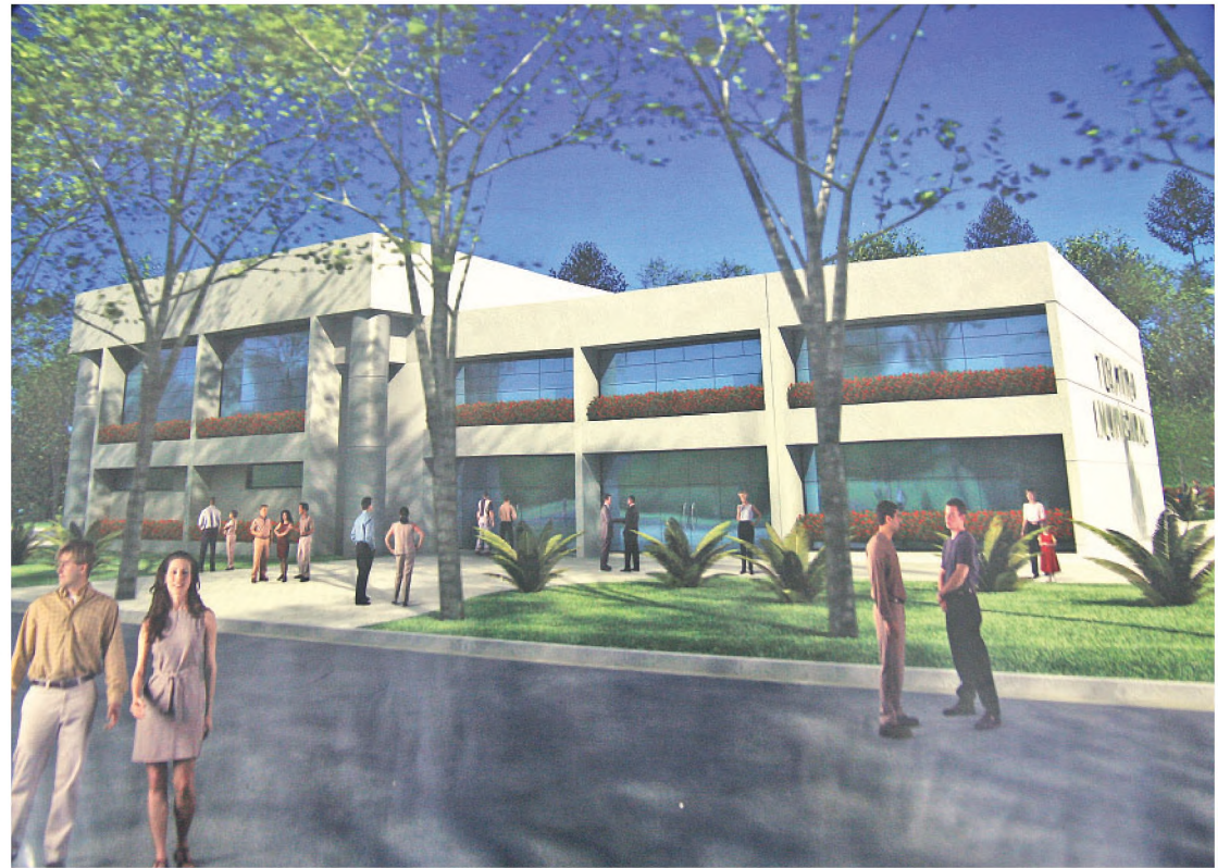
Zilor doou até agora R$ 621 mil para construção de teatro; obra vai custar R$ 2,5 milhões

No Programa Aprender Sempre, iniciado em 2007, a empresa reforça seu compro-