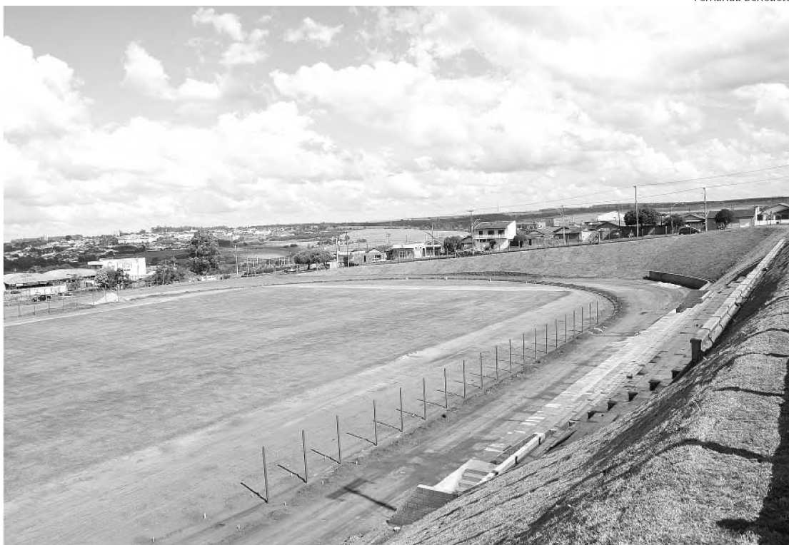
Local onde está sendo construído o estádio Vagulão; campo foi alvo de protestos de vereador