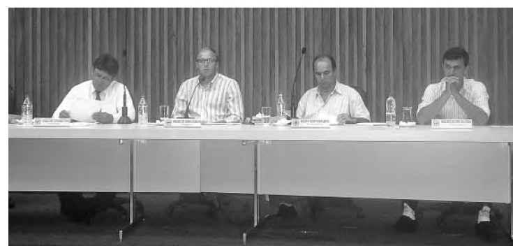
Vereadores votam e encaminham projetos para as comissões

Em menos de uma hora, os vereadores da Câmara Municipal de Lençóis Paulista aprovaram quatro projetos, enviaram três para as comissões e suspenderam um, na sessão realizada na última segunda-feira. Tanta rapidez por causa da posse dos 10 vereadores mirins da Câmara Jovem que ocorreu logo após a última sessão ordinária do primeiro semestre.