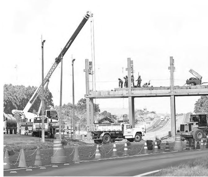
Pedágio de Agudos volta a funcionar em outubro; ida e volta

A Rodovias do Tietê, concessionária do trecho Leste da rodovia Marechal Rondon, já iniciou as obras nas praças de pedágios de Areiópolis e Agudos que devem estar funcionando nos dois sentidos da rodovia (ida e volta) até o final de outubro. As informações são da assessoria de imprensa do grupo.