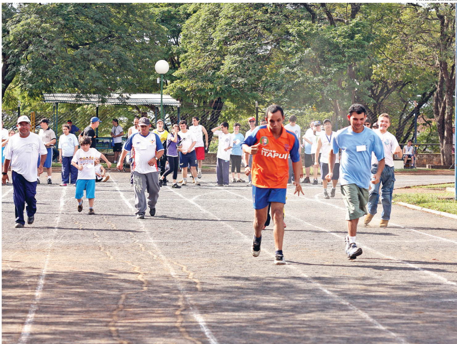
Atletas especiais de nove cidades da região se encontraram em Lençóis Paulista para mais um etapa do Circuito Especial

A terceira etapa será no dia 19 de agosto, em São Manuel. Itapuí é a sede em setembro, Jaú recebe o circuito em outubro e a final ocorre em novembro, em Barra Bonita.