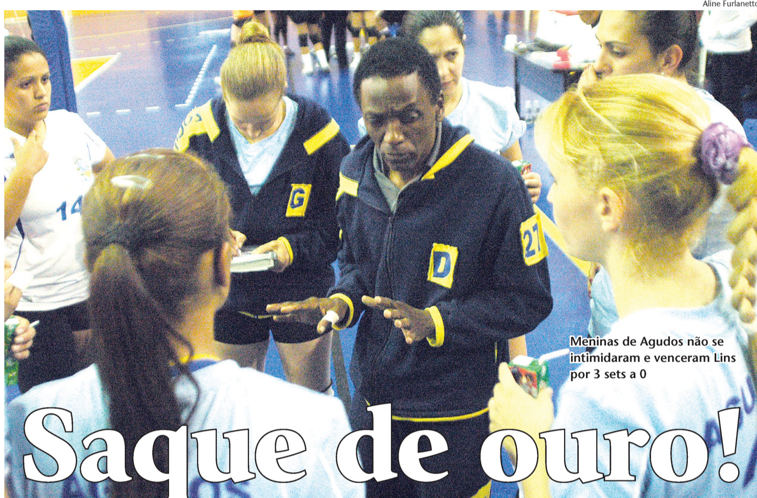
Meninas de Agudos não se intimidaram e venceram Lins por 3 sets a 0