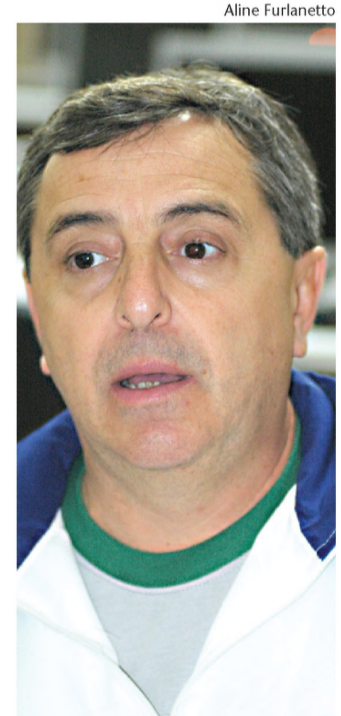
Para Lenci, Lençóis é forte para a segunda divisão e fraco para a primeira

Assim como Lençóis, a delegação de Barra Bonita, que também disputou os Regionais na primeira divisão neste ano, caiu para o grupo de acesso (veja quadro). Os quatro municípios que tiveram as piores campanhas no grupo de elite desceram para a segunda divisão, enquanto as duas delegações que conseguiram pontuar mais no grupo de acesso passarão a integrar a primeira divisão em 2010.