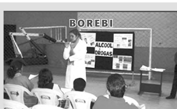
Ciclo de palestras pretende envolver programas sociais