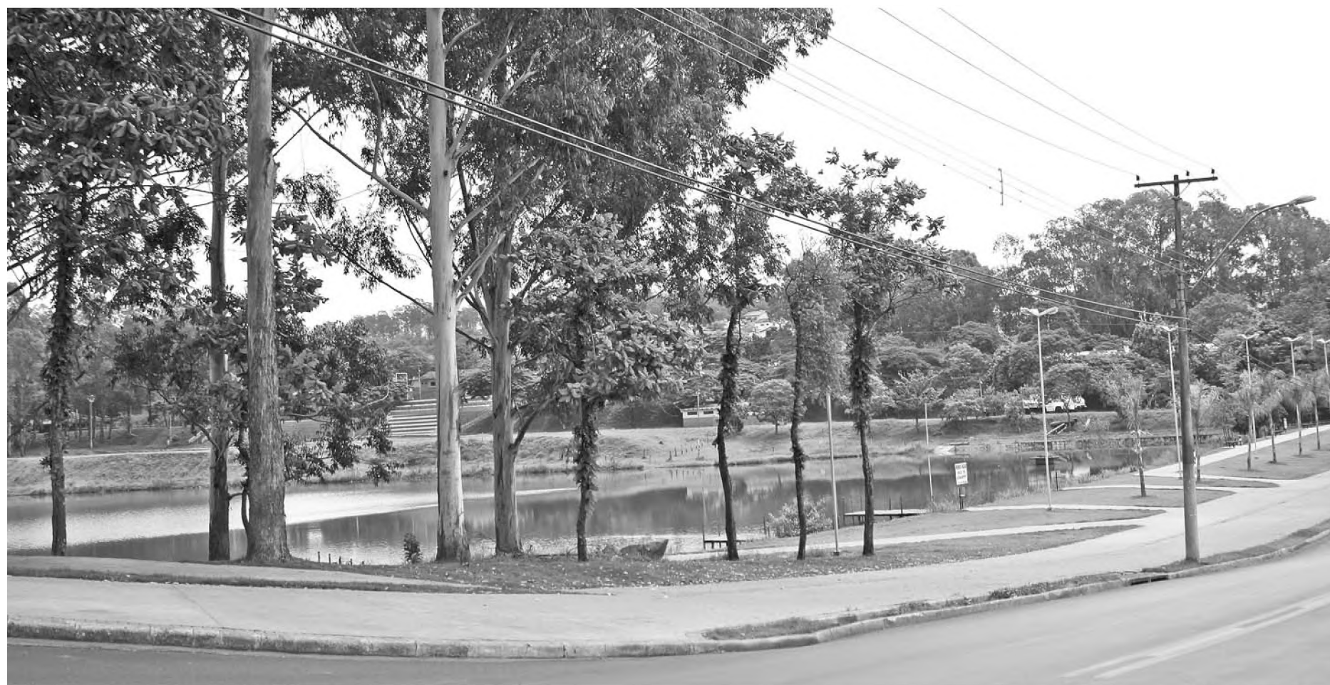
Integrantes do projeto Formação de Líderes fazem campanha para preservar Parque do Povo; para o próximo sábado, já tem ação de conscientização programada