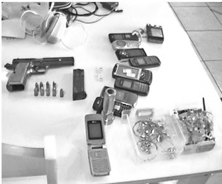
Em Agudos, líder da quadrilha foi preso com uma pistola; em Barra, arsenal estava enterrado no meio do canavial