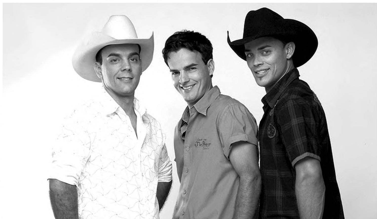
O grupo Manos Country é a atração musical de hoje na Festa do Peão de Agudos; evento comemora 111 anos do município