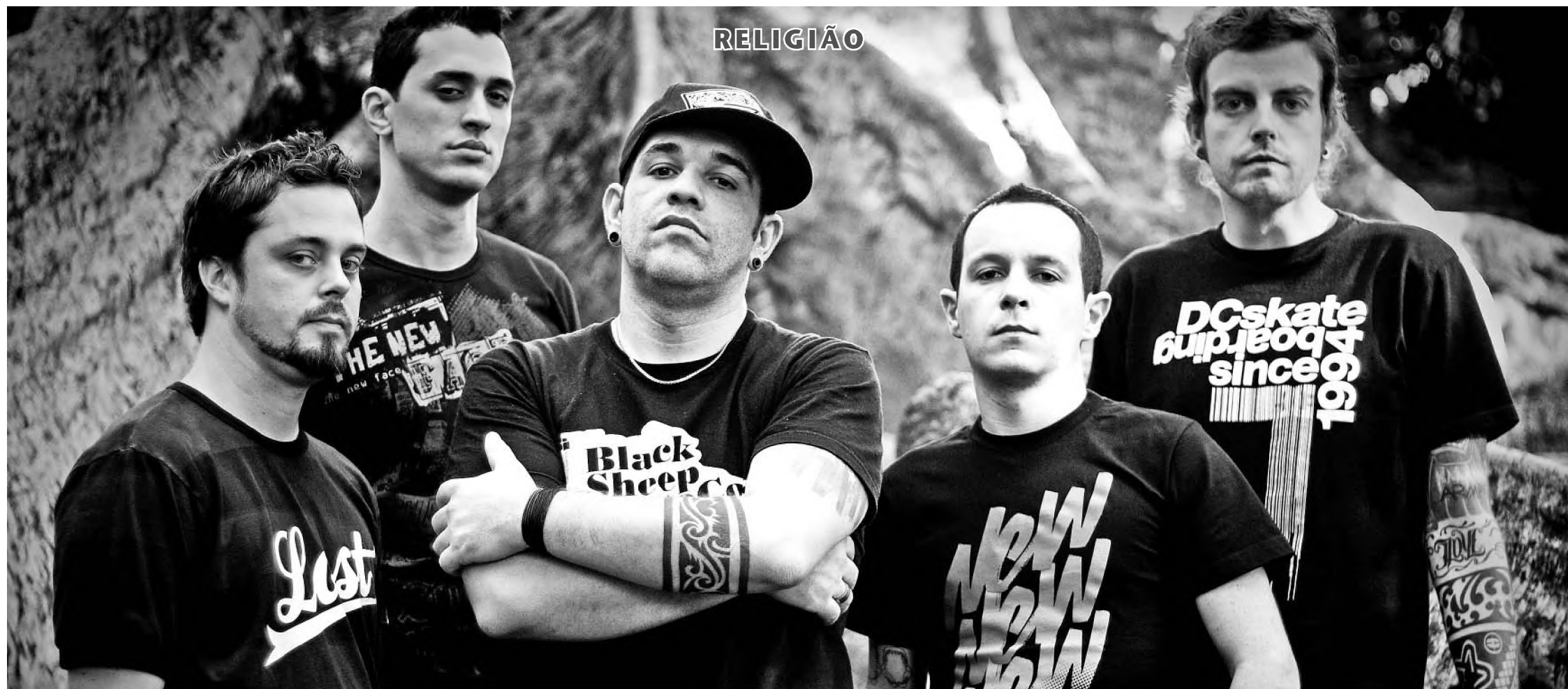
Banda The Flanders se apresenta no UTC, dia 18, no encerramento da Semana Jovem; programação também prevê celebração de missa na paróquia Nossa Senhora Aparecida, na Vila Cruzeiro