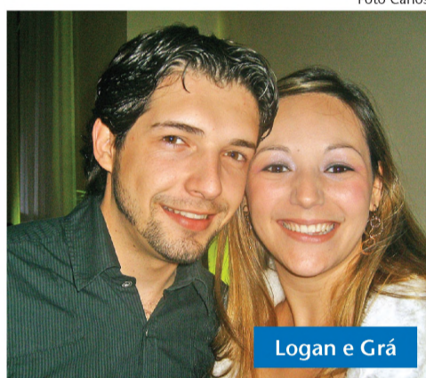
Logan e Grá