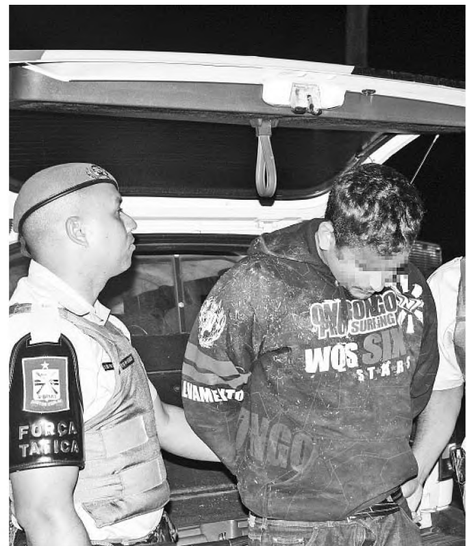
Presos também vão responder por tentativa de homicídio

A prisão dos dois bandidos foi registrada no começo da noite da última segunda-feira. O casal chegava em casa numa caminhonete de luxo quando foi rendido por dois bandidos armados de revólveres e levados para dentro da residência. Uma das vítimas acionou o alarme e teve início a perseguição, primeiro pela empresa de segurança e logo em seguida da Polícia Militar. Os bandidos saíram pela rodovia Marechal Rondon sentido interior-capital. Quando notaram que estavam sendo perseguidos pela PM, fizeram o retorno na Fazenda Progresso e seguiram no sentido contrário. Durante a perseguição, atiraram contra a viatura da polícia, que revidou e atirou nos pneus. Os bandidos retornaram e acabaram rendidos na altura do posto 295. Ninguém ficou ferido. (VG)