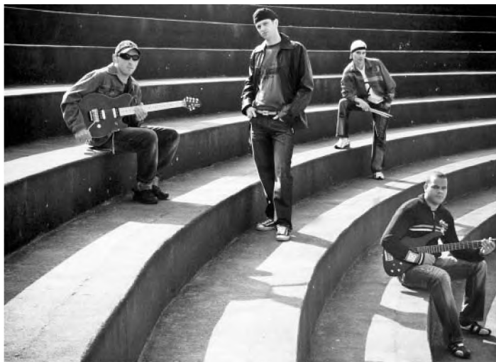
Banda Insanity faz show dia 26 na Casa da Cultura de Lençóis