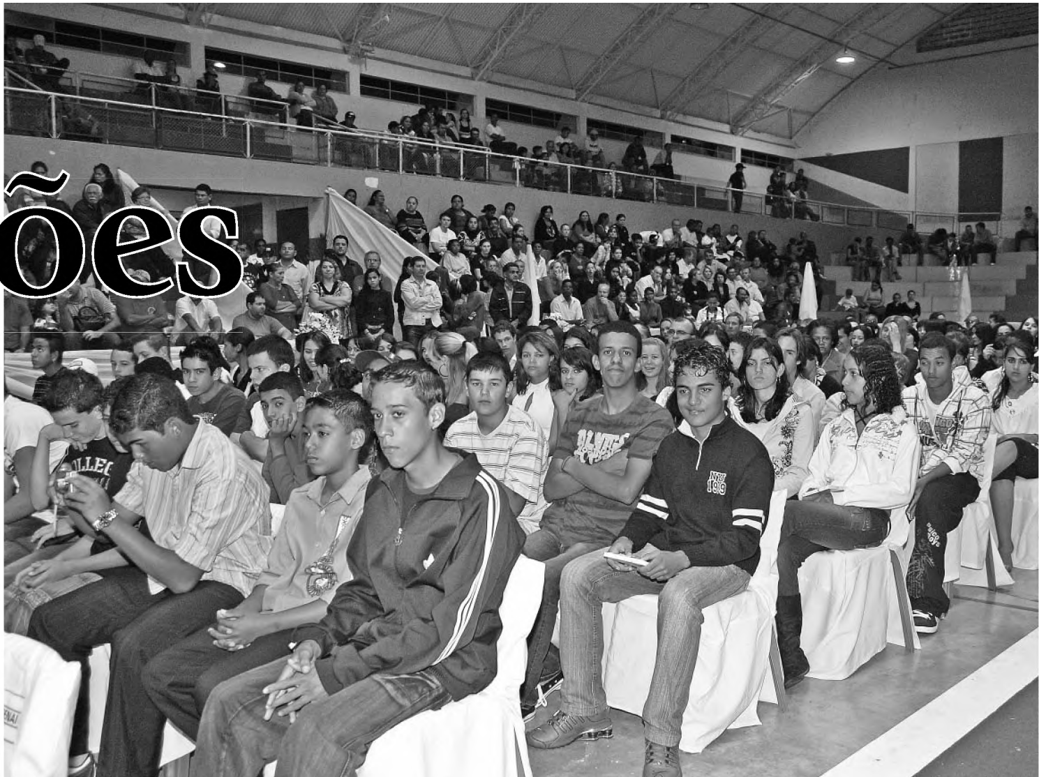
Na segunda-feira 7, 500 jovens receberam certificado de qualificação profissional; procura por cursos recebeu recorde de inscrições

Ao todo são 600 vagas oferecidas pelo Centro de Formação em cursos de seis meses e um ano. Aqueles que não conseguiram se matricular ficam em uma lista de espera e, segundo Francatti, são