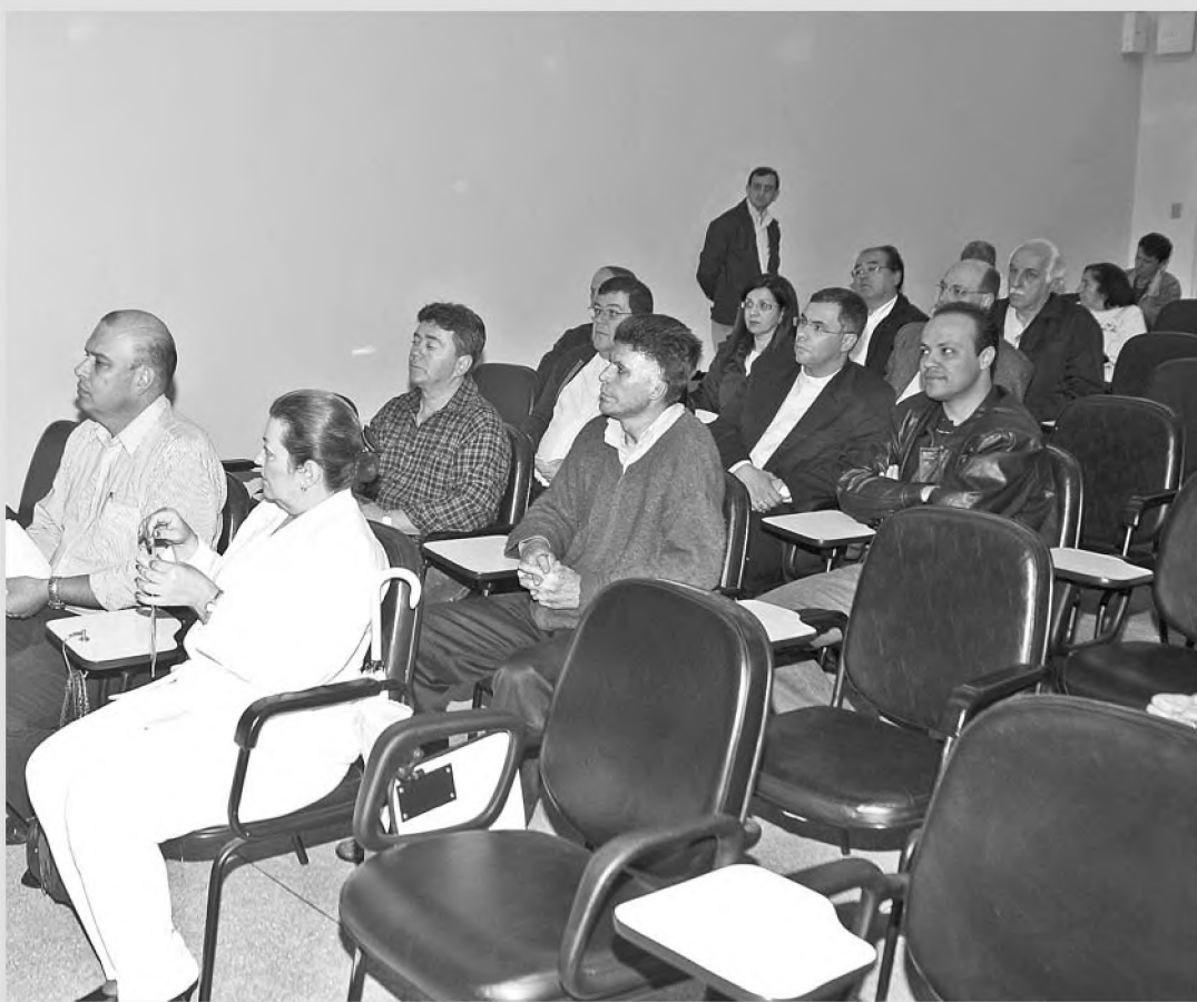
Encontro na tarde de ontem reuniu padres, pastores e representantes de clubes de serviço