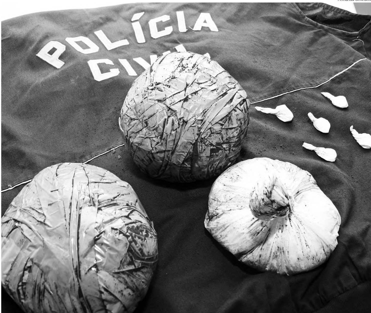
Polícia Civil de Lençóis apreendeu 2,4 quilos de cocaína; rapaz de 18 anos, acusado de comercializar a droga, foi preso em flagrante

Todas as pessoas que estavam na casa foram encaminhadas para a delegacia para averiguações. A reportagem do jornal O ECO abordou a mãe