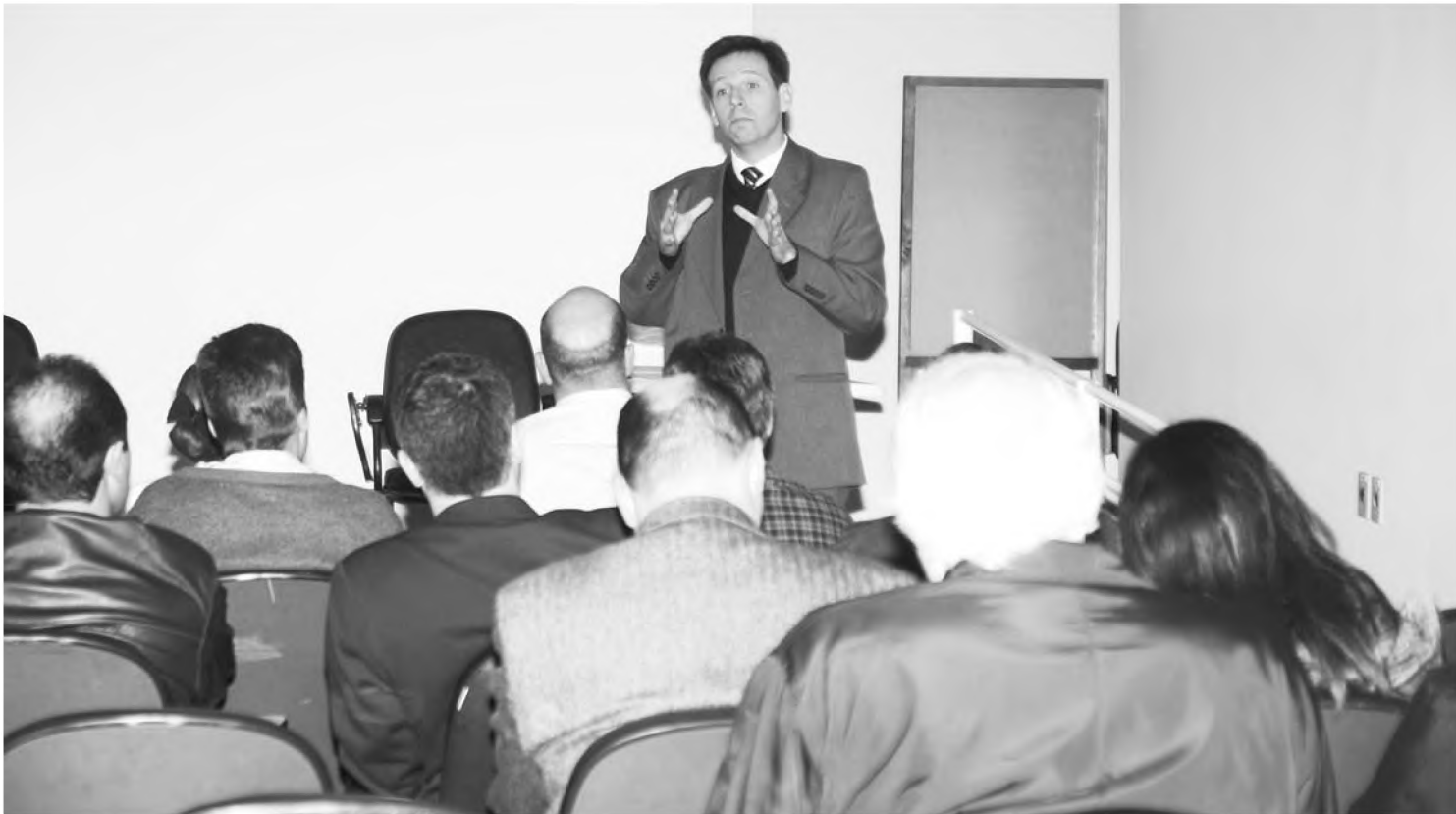
Promotor Henrique Varonez ameaça fechar casas noturnas e escolas se não diminuir casos de gripe suína em Lençóis Paulista

taçou. Segundo o promotor, não é possível saber como será a evolução da epidemia daqui para frente. Especialistas acreditam que a cadeia do vírus só será quebrada dentro de 30 ou 40 dias, que é quando chega a primavera nos países do Hemisfério Sul. "Podemos tomar medidas para deixar de incrementar o risco", completou.