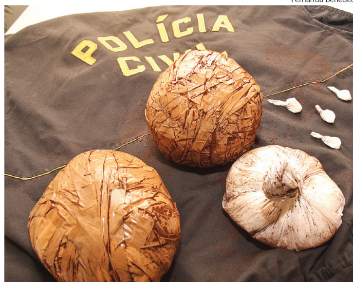
Cocaína encontrada dentro de uma residência na Vila Capoani

Em uma operação que durou menos de 30 minutos, a Polícia Civil de Lençóis Paulista fez a maior apreensão de drogas do ano. Em uma casa na Vila Capoani foram localizados 2,4 quilos de cocaína. O produto é avaliado em mais de R$ 82 mil. A operação foi desencadeada no final da tarde de terça-feira e resultou na prisão de um rapaz de 18 anos, acusado de comercializar a droga na cidade. Na segunda-feira, a Polícia Civil de Agudos apreendeu 165 quilos de maconha. A droga estava escondida dentro de uma bolsa repleta de café. ► Página A3