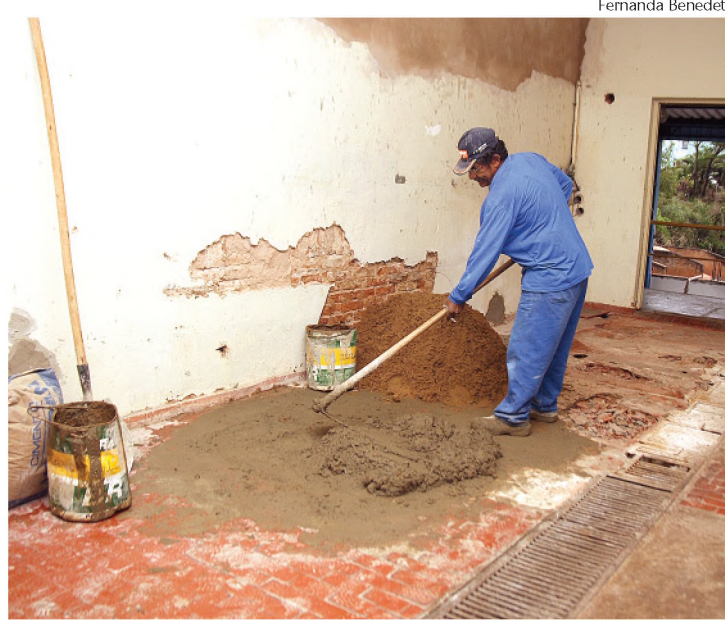
Reforma do prédio vai manter as características originais