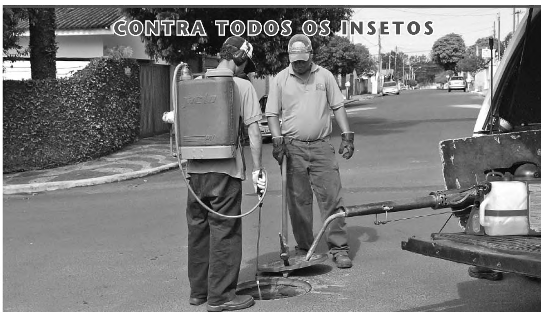
O SAAE (Serviço Autônomo de Água e Esgotos) de Lençóis Paulista continua o serviço de dedetização dos bueiros na cidade. Ontem, uma equipe trabalhava na rua José Bonifácio, na Vila Marimbondo. A orientação é para manter os ralos fechados durante a aplicação de inseticida.