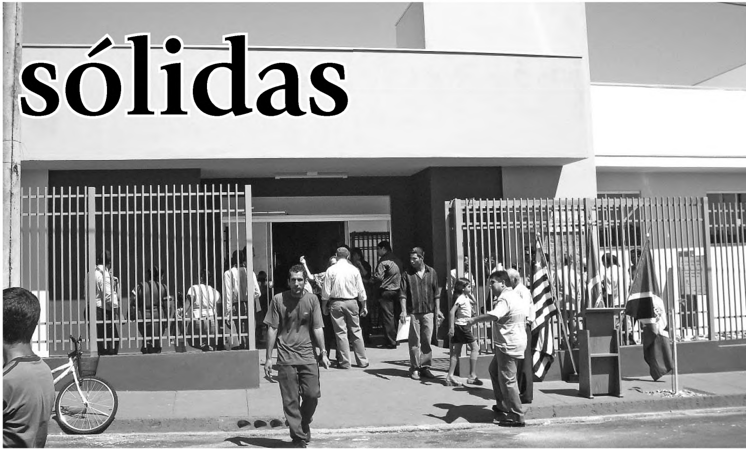
O novo prédio do PSF do Jardim Planalto foi inaugurado no último sábado com a presença da comunidade e de políticos

A pavimentação da rodovia Osny Matheus até Águas de Santa Bárbara, também está parada, segundo Cury. O atraso é atribuído a crise financeira. "O DER não tem data para lançá-lo. Mesmo porque com essa crise mundial do governo do Estado deixou de arrecadar R$ 1,8 bilhão. E grande parte disso iria para a Secretaria dos Transportes. Então houve um atraso em relação a isso. Agora inicia-se a terceira etapa da recuperação de vicinais e também em outubro a licitação da quarta etapa de vicinais. Muitas vicinais daqui da região estarão nesse pacote", conclui.