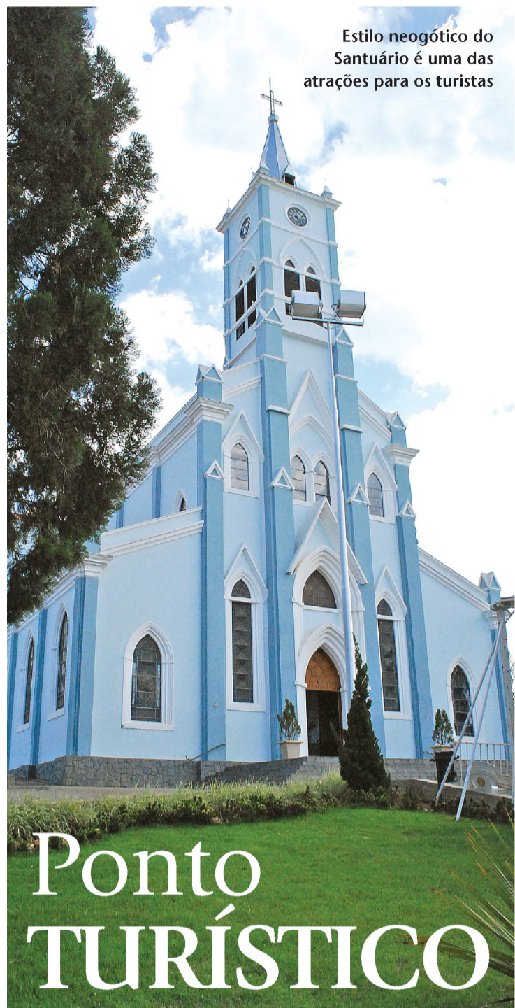
Estilo neogótico do Santuário é uma das atrações para os turistas

E4 ★ LENÇÓIS PAULISTA, TERÇA-FEIRA, 15 DE SETEMBRO DE 2009