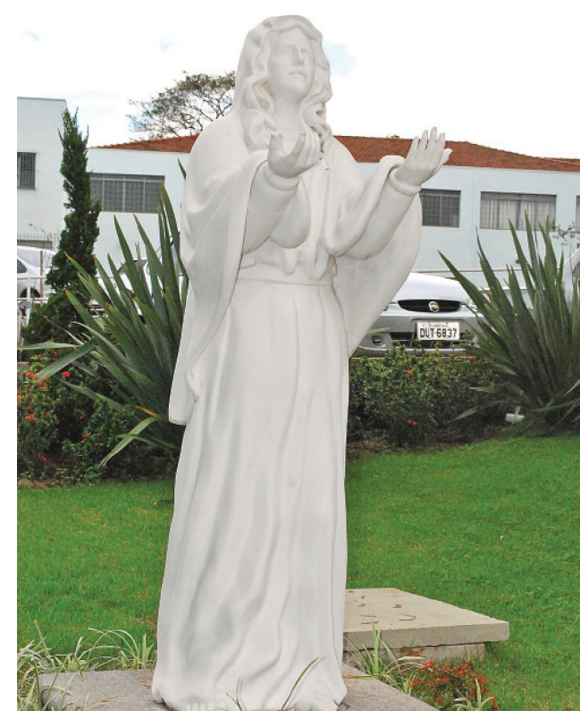
1ª DOR – A PROFECIA DE SIMÉÃO É o momento em que Nossa Senhora apresenta o menino Jesus no templo em Jerusalém. Por isso, nessa imagem Nossa Senhora está em posição de quem entrega o seu filho a Jesus. E ouve a profecia do velho Siméão: "uma espada de dor transpassará a tua alma".