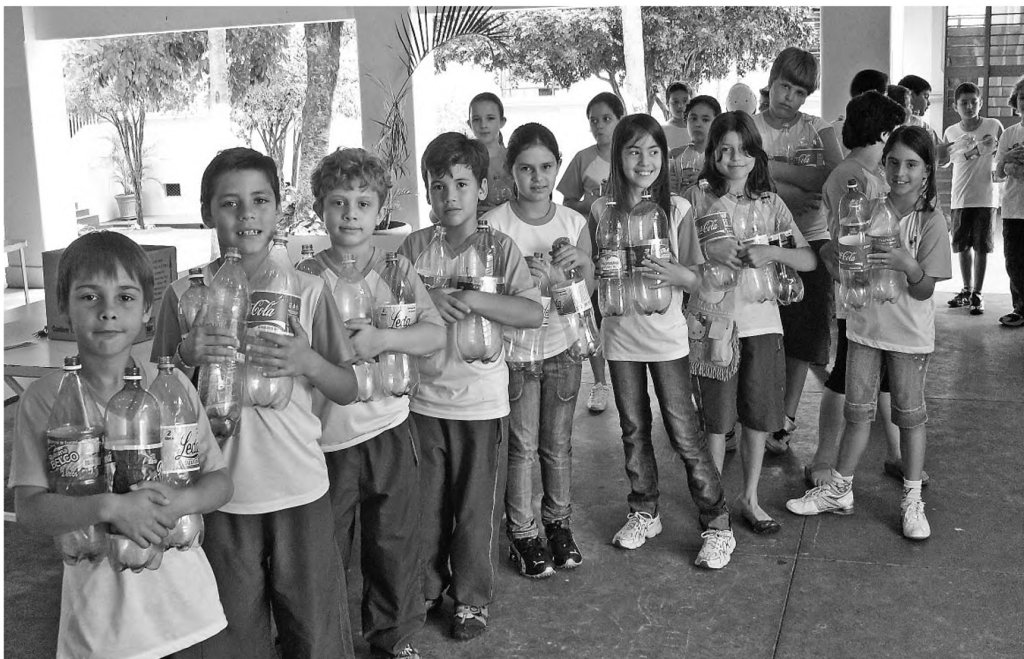
Na escola Esperança de Oliveira, os alunos fazem fila para trocar as pet; cinco garrafas valem um cupom

A campanha é realizada pelas diretorias de Desenvolvimento, Geração de Emprego e Renda, Cultura, Educação e Meio Ambiente, com participação da Cooprelp (Cooperativa de Reciclagem de Lençóis Paulista), Adefilp (Associação dos Deficientes Físicos de Lençóis Paulista), Núcleo de Artesãos e apoio da Acilpa (Associação Comercial e Industrial de Lençóis Paulista).