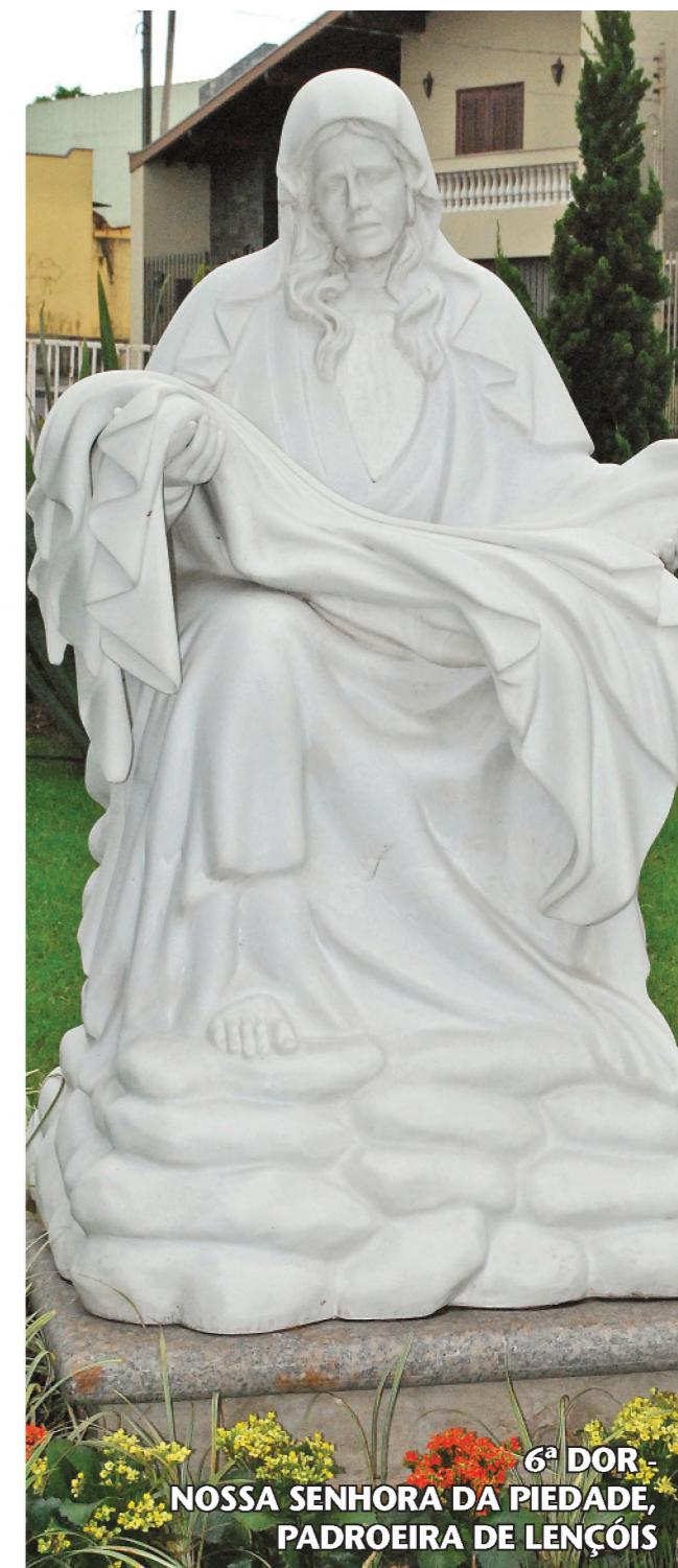
6ª DOR – NOSSA SENHORA DA PIEDADE, PADROEIRA DE LENÇÓIS É uma representação da imagem de Michelangelo, a Pietà (em português Pietade), uma das mais famosas esculturas do artista, porém em vez de ter o corpo morto de Jesus, Nossa Senhora segura um lençol. É possível notar que em nenhuma imagem temos a representação de Jesus. Isso porque aquilo que Maria realizou com Jesus na sua vida terrena é exatamente aquilo que ela realiza conosco hoje. É Maria quem amparou Jesus morto em seus braços, e hoje é ela quem ampara todos nós em nossos momentos de dificuldades, em nossos momentos de dor. Aquele lençol nos braços da virgem Maria representa que um dia o colo de Maria sustentou Jesus, hoje o colo de Maria nos sustenta.