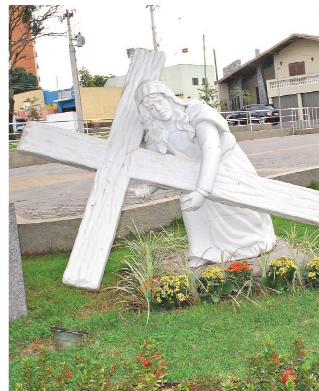
4ª DOR – FILHO JESUS CARREGANDO A CRUZ Essa imagem nos lembra o momento em que Maria encontra Jesus a caminho do Calvário, carregando sua cruz. A imagem representa exatamente isso. Maria com sua presença consola e fortalece o seu filho, como que apolando-o no caminho da cruz.