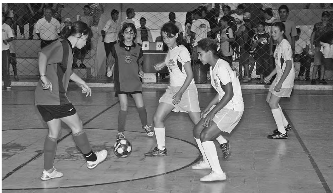
Mais de 1,5 mil alunos das escolas pública e particular de Agudos participaram da competição