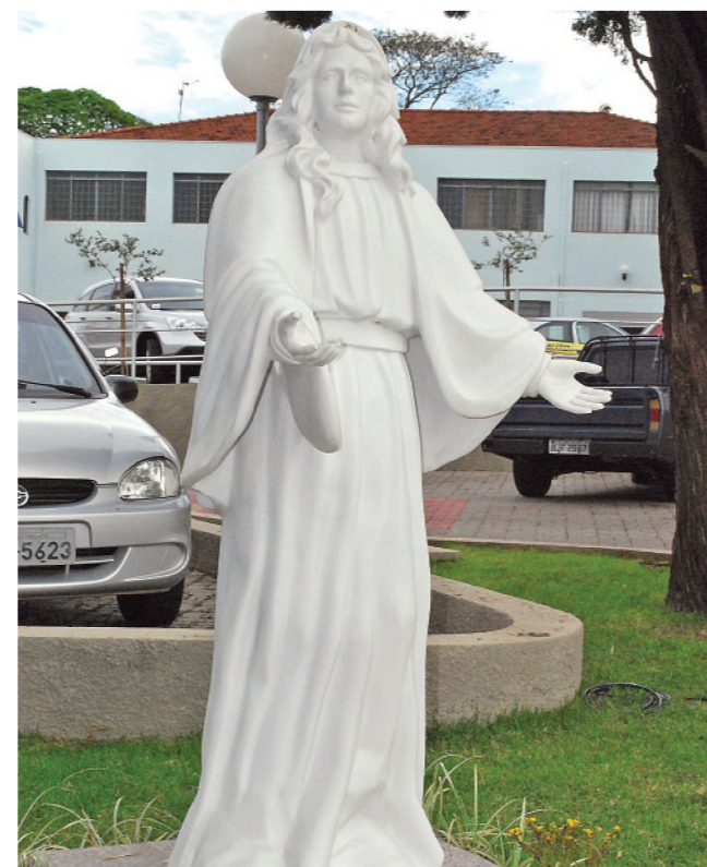
3ª DOR – PERDA DE JESUS NO TEMPLO Na terceira dor, Nossa Senhora perde o menino Jesus no templo em Jerusalém. É a imagem procura representar isso, um rosto angustiado de Maria e uma expressão: onde está meu filho? Onde está o menino Jesus?