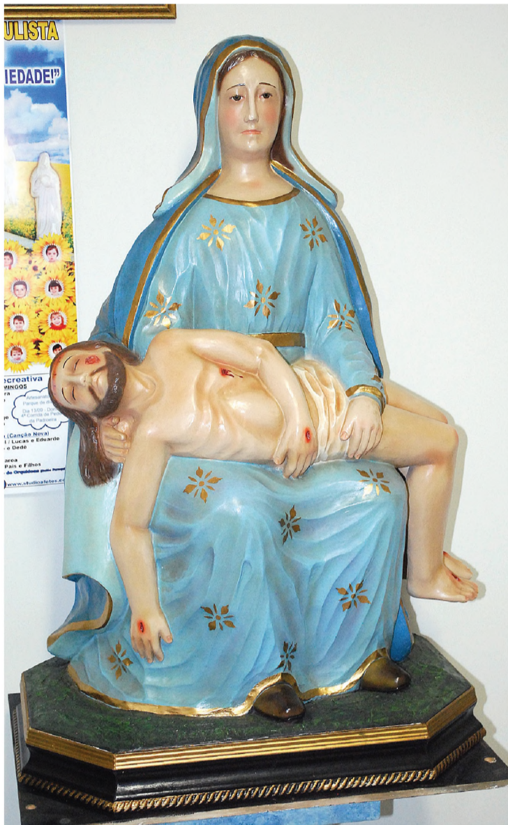
A réplica da Pietà, Nossa Senhora da Piedade feita em madeira

Santuário cria Pastoral do Turismo e Festa da Padroeira pode fazer parte do calendário turístico de Lençóis Paulista