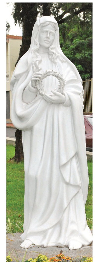
7ª DOR – MARIA NO ENTERRO DE SEU FILHO JESUS Na sétima dor Nossa Senhora aparece com uma coroa de espinhos nas mãos, o instrumento da paixão de Cristo. É o enterro de Jesus o qual Nossa Senhora acompanha o sepultamento do filho. Nossa Senhora sofre, mas na esperança e certeza da ressurreição.