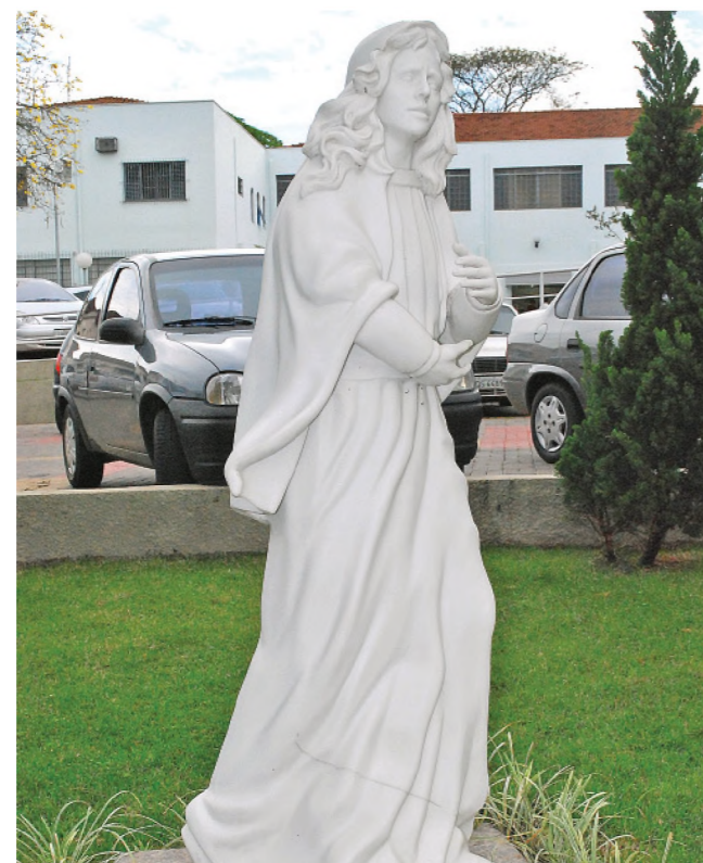
2ª DOR – A FUGA PARA O EGITO Nessa imagem, Nossa Senhora está em atitude de fuga, como que segurando uma criança, o menino Jesus. É aquilo que nos é relatado pelo evangelista São Mateus: "... por vontade de Herodes, as crianças de Belém foram assassinadas, mas um anjo anunciou a Maria e José que eles deveriam fugir. Essa segunda imagem representa a dor de Maria fugindo para o Egito.