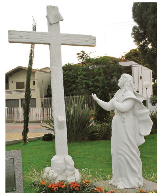
5ª DOR – CONTEMPLA A MORTE DE SEU FILHO JESUS Nesse monumento vemos a representação da cruz levantada e Nossa Senhora aos pés dessa cruz vendo o momento da morte de Jesus. É nesse momento que ela ouve aquelas palavras do Senhor Jesus que a fez mãe de todos os cristãos: "eis aí a tua mãe, eis aí o teu filho".