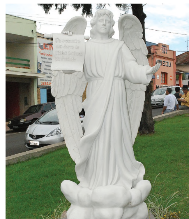
ANJO A imagem é do anjo que anunciou à Virgem Maria que ela seria a mãe do Salvador. O anjo que a consola nos momentos de suas dores é o mesmo que aponta o caminho: "eis o caminho das dores de Nossa Senhora da Piedade", aponta o anjo.