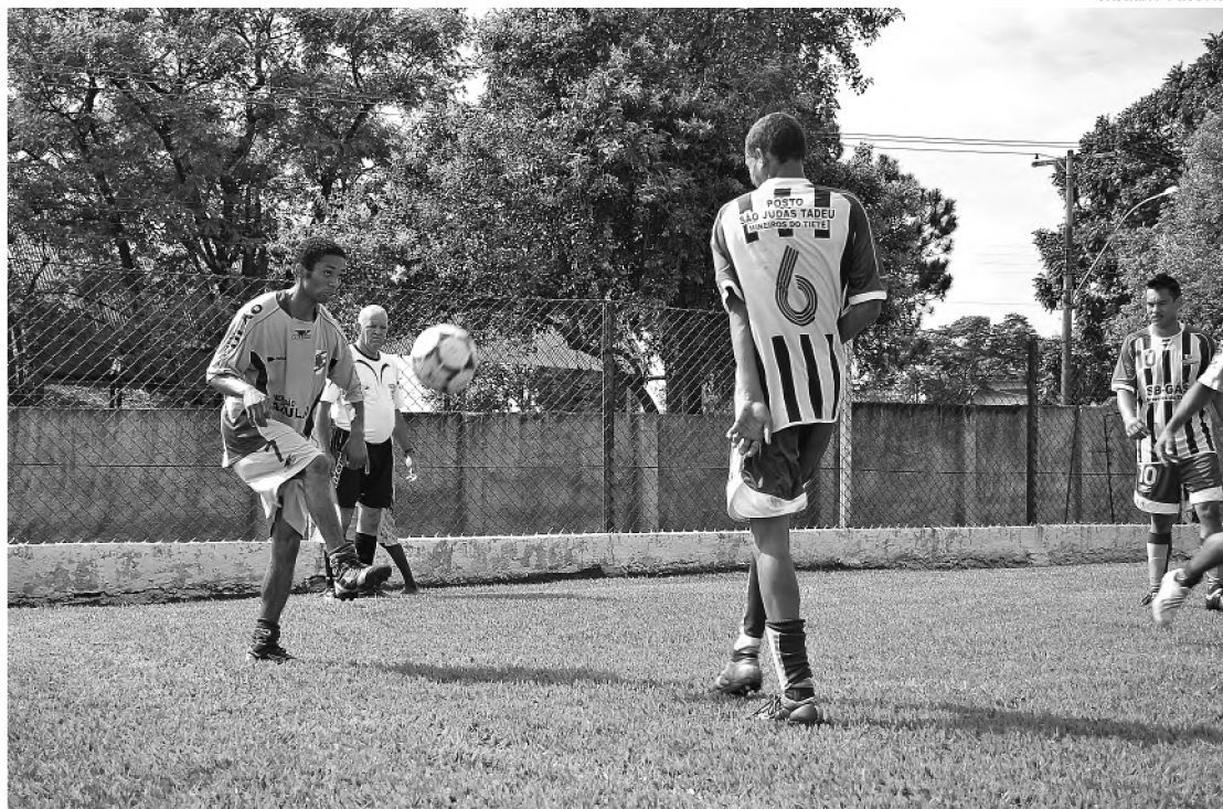
Grêmio Cecap goleou Mineiros do Tietê por 4 a 1, no Bregão, e garantiu o segundo lugar