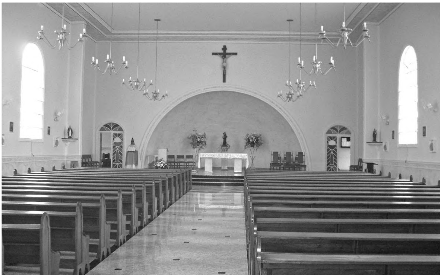
Vista interior da matriz de Santo Antonio, depois de dois meses de reforma; igreja renovada foi apresentada aos fiéis no último domingo