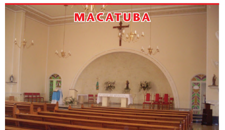
Vista interna da igreja de Santo Antonio que teve até piso trocado