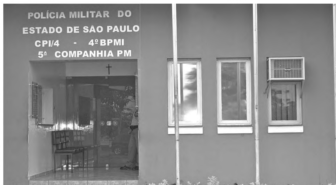
Final de semana registrou três ocorrências; um roubo contra um restaurante e dois furtos

A Polícia Militar foi acionada e iniciou um patrulhamento nas imediações com base na descrição física passada pela vítima. Um dos bandidos usava