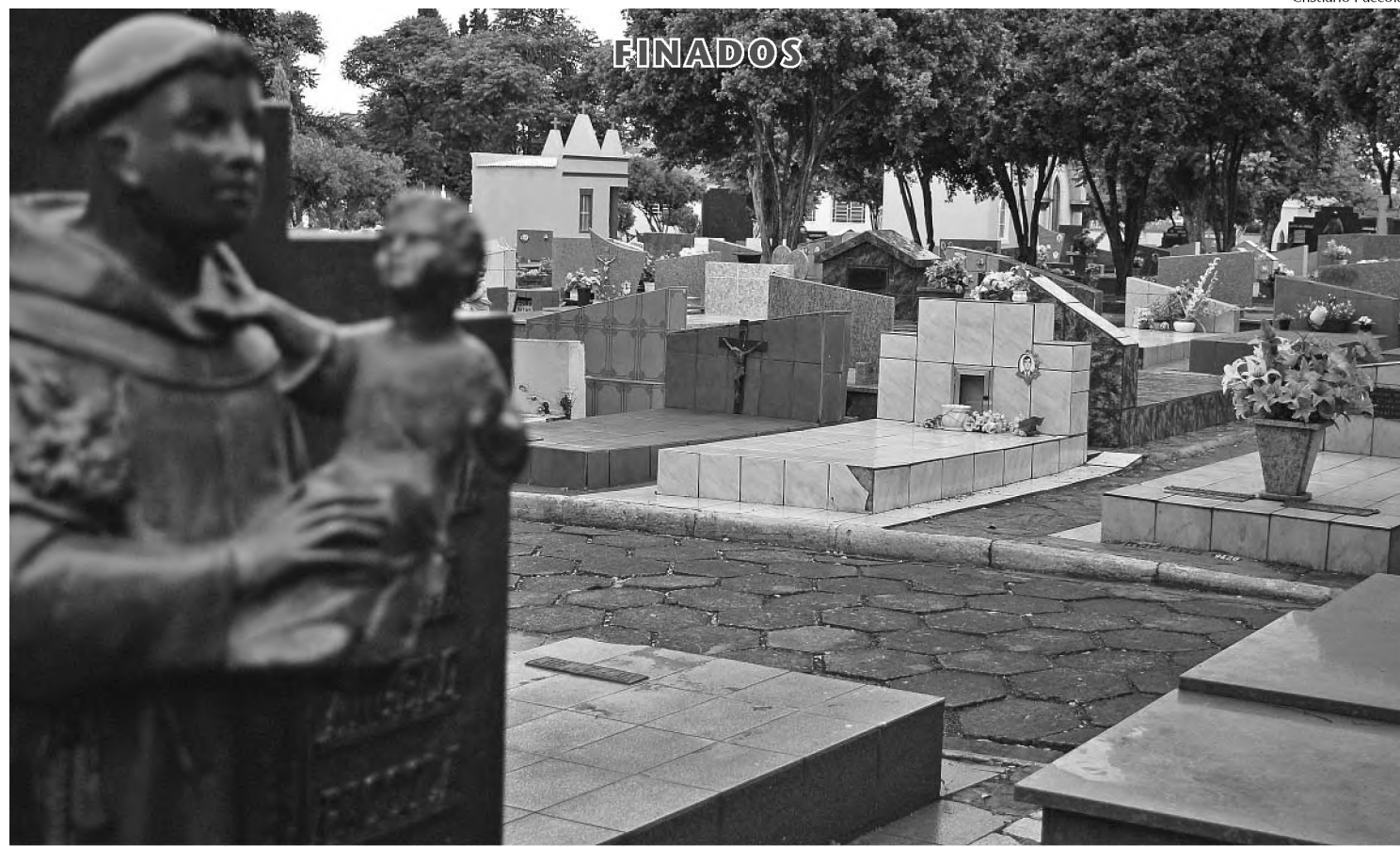
Praço para limpeza de túmulos no Cemitério Municipal vai até dia 31 deste mês; no Paraíso da Colina, finados terá pára-quedaismo