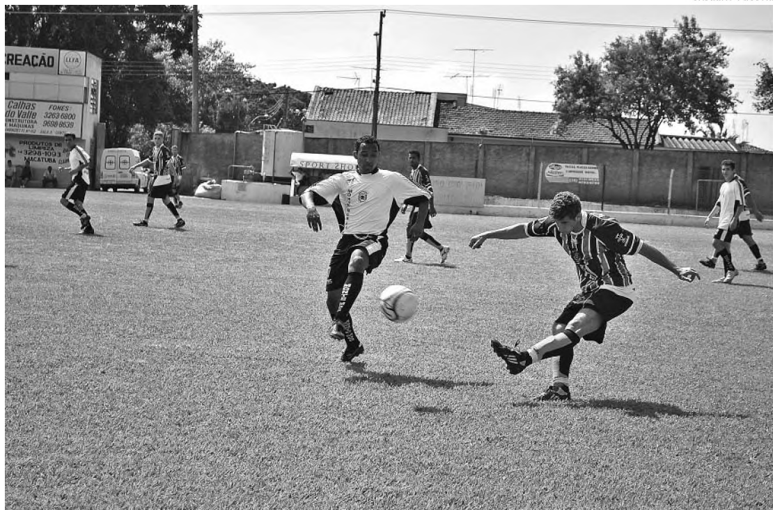
Primavera Millenium vence Monte Mor Botucatu por 2 a 0 e assume liderança do grupo A