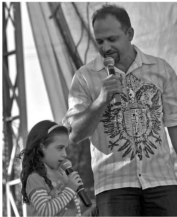
Feira abriu espaço para artistas locais se apresentarem

No sábado teve Esquadrilha da Fumaça, aeromodelismo e paraquedistas