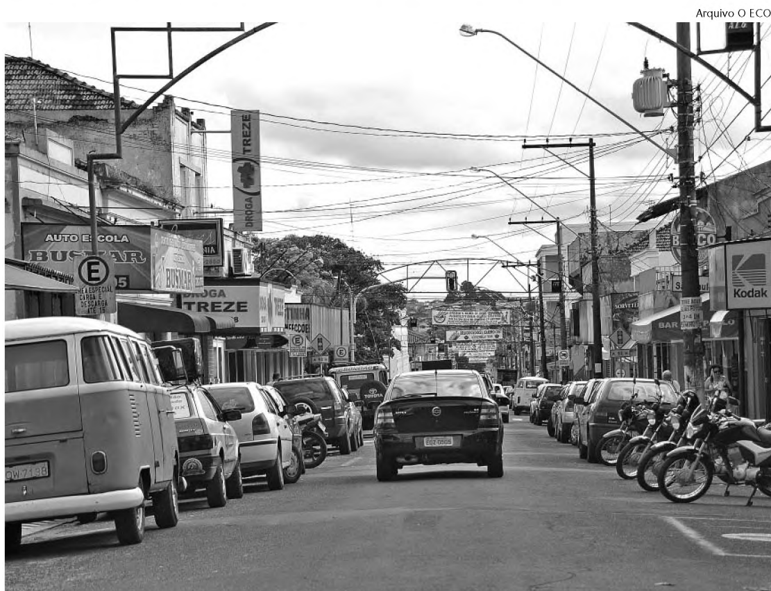
Centro de Agudos registrou dois roubos no último final de semana; em Pederneiras, carro foi furtado

O final de semana registrou dois roubos em estabelecimentos comerciais no sábado 22. O primeiro assalto foi registrado contra uma loja na rua Treze de Maio e outro na rua Sete de Setembro. Nos dois casos os bandidos fugiram levando dinheiro. O valor não foi informado.