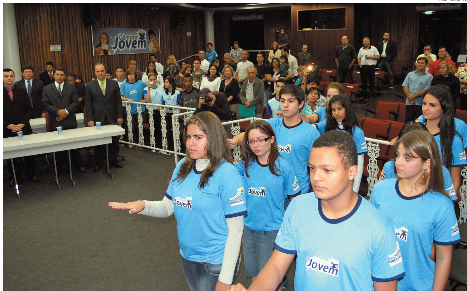
Posse dos vereadores mirins começou por volta das 20h de ontem e foi transmitida pela TV Preve, de Bauri, ao vivo

Dez jovens vereadores tomaram posse na noite de ontem; Formigão comandou a segunda edição do evento