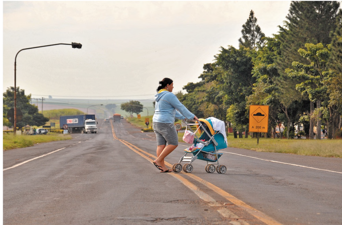
Pedestres atravessam a Osny Matheus sem se importarem com o risco de atropelamento