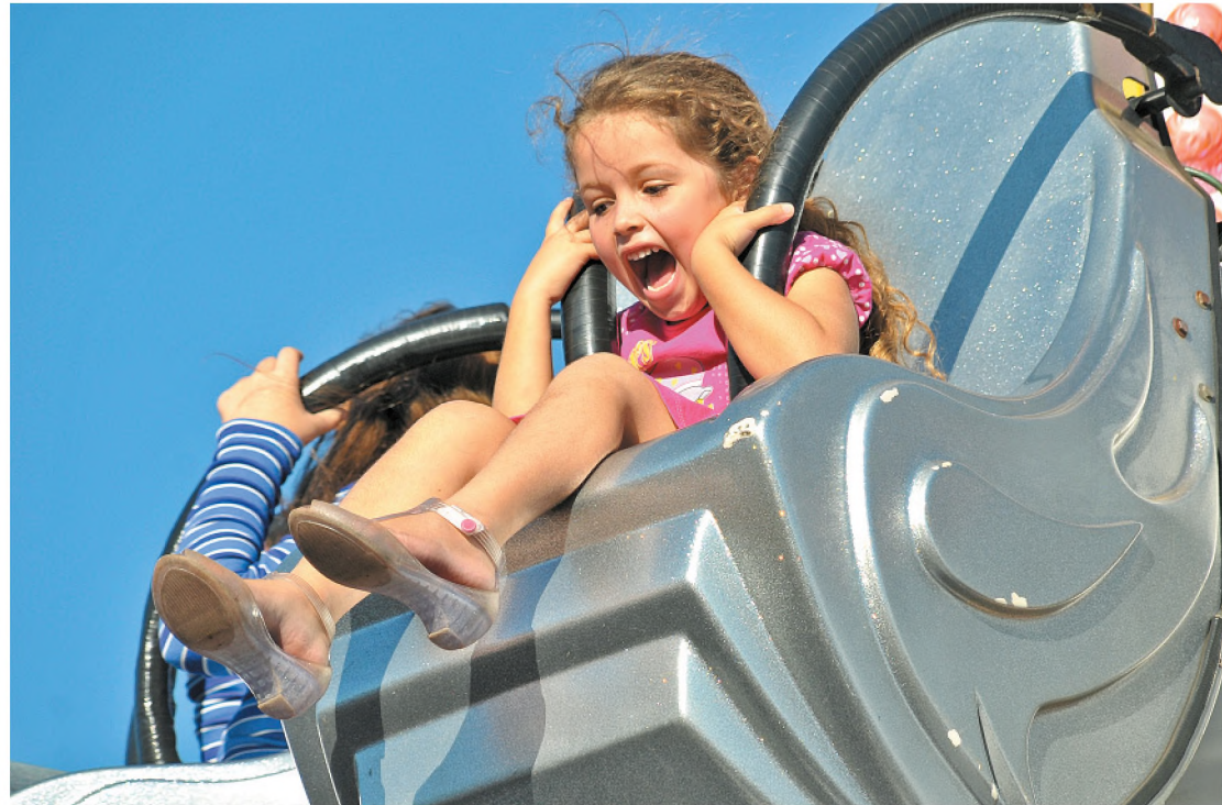
Domingo de sol marcou o último dia da Feira das Nações e as crianças aproveitaram o parque

O show da dupla sertaneja Hugo Pena & Gabriel marcou o encerramento da Feira das Nações 2010, no domingo 23. A festa que comemorou os 119 anos de Pederneiras, completados no sábado, começou na