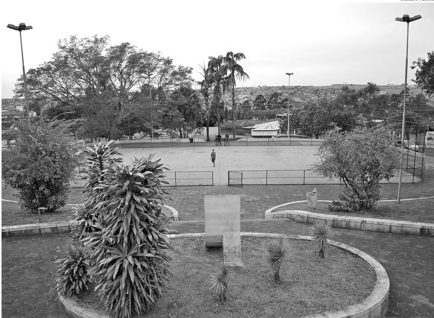
Na quadra de esportes do Jardim Bela Vista as atividades vão das 10h às 11h30; programação inclui ainda outros 10 locais da cidade

Os municípios de Areópolis e Borebi não souberam informar contra quem vão competir. Como o site do Sesc São Paulo, organizador do evento, estava com problemas não foi possível obter mais informações até o fechamento desta edição.