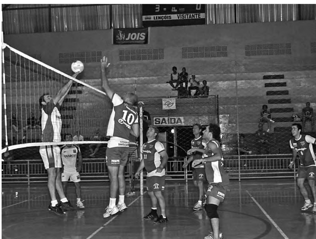
Equipe masculina de vôlei da Prefeitura de Lençóis bateu a Lwarcel pelo placar de 3 a 0

Na noite de sábado 22, no Tonicão, a equipe feminina de futsal da Prefeitura de Lençóis goleou a Adria/Zabet pelo placar de 7 a 1. Pelo futebol master sete, na noite de sexta-feira 21, no Espaço Lazer Zilor, a Lwart venceu a Lwarcel B por WO. Prefeitura de Borebi e Zilor A ficaram no empate em 1 a 1 e a Adria/Zabet bateu