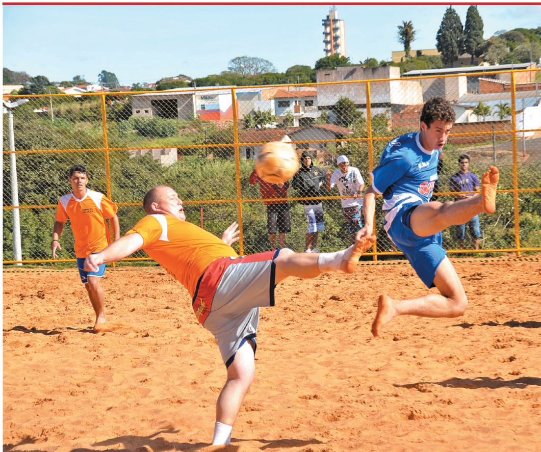
Nova Lençóis, de azul, venceu os Pngáticos e se classificou para a próxima fase da Copa de Areia

O Cemp/Senai de Macatuba está com inscrições abertas para os cursos do segundo semestre. Ao todo são oferecidas 286 vagas, sendo que 144 são para a área de construção civil. Todos os cursos são gratuitos. As inscrições começam ontem e seguem até o dia 16 de junho. ► Página A6