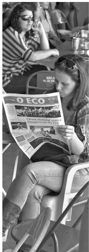
O Jornal O ECO participou da Festa das Nações; no domingo, muita gente deu uma pausa no almoço para conferir as notícias da região

Artesanato mostrou novidades como bolsa feita de toalha de banho