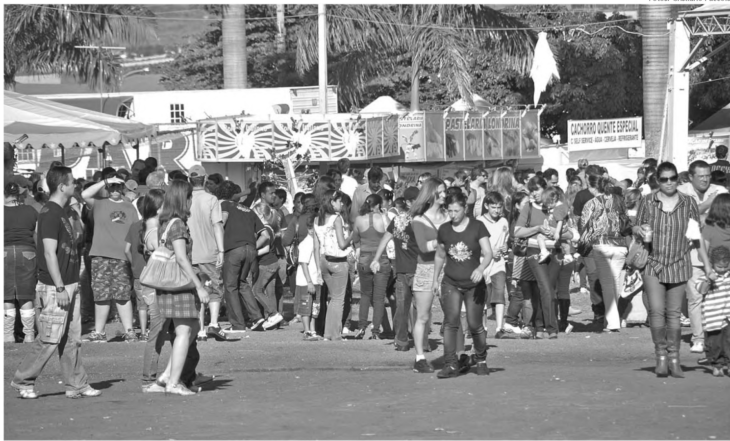
Movimento no recinto na tarde de domingo, dia do encerramento da Feira; para organizadores, festa atendeu às expectativas

No domingo 23, o movimento começou cedo no recinto. Teve gente que saiu de casa para assistir a apresentação de algum artista ou para aproveitar o almoço servido pelas barracas. No cardápio tinha comida italiana, árabe,