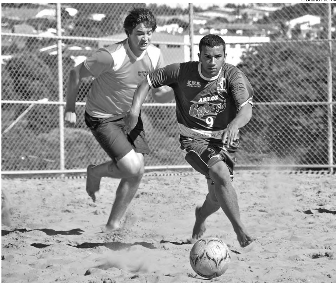
Lance da partida em que a Nova Lençóis venceu Os Pingáticos por 5 a 3; nas oitavas, pega União Primavera