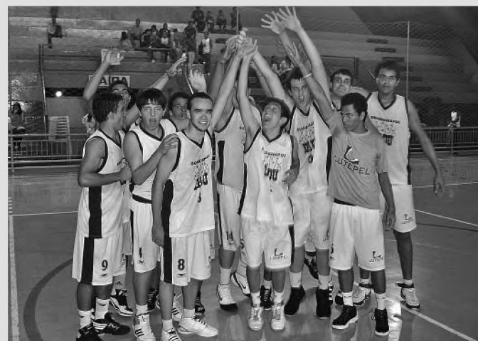
Basquete infanto-juvenil Lutepel/Grupo Lwart venceu Bauru

Lutepel/Grupo Lwart bate equipe de Bauru no Tonicão