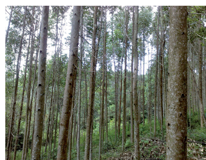
Preservar o meio ambiente é uma das preocupações da empresa

Outro ponto de preocupação da Moretto é no quesito sustentável da população de Lençóis. Para ajudar a cidade, a Moretto é parceira do Centro Municipal de Formação Profissional e apoia a Escola de Marcenaria José Moretto.