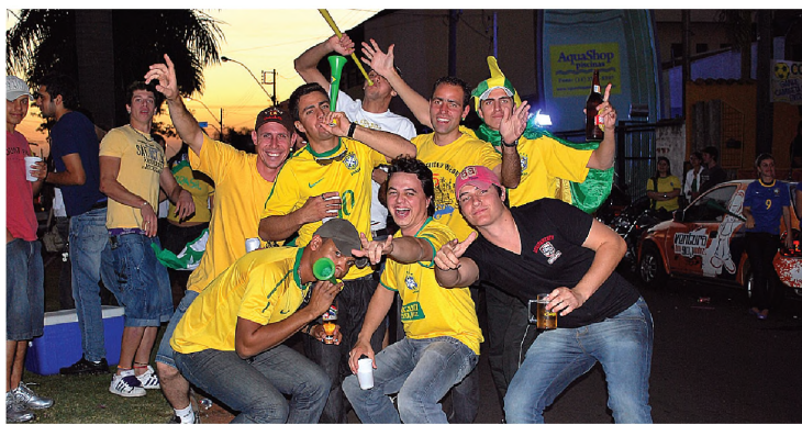
Em Lençóis, torcedores se reuniram na avenida Padre Salústio

taram o movimento para faturar. Tanto o Bichano - que preparou um show para depois do jogo - como os outros estabelecimentos.