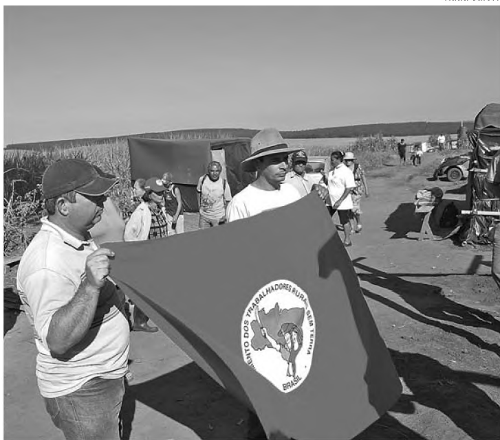
Sem-terra acampados às margens da fazenda Mamedina

"Nós estamos reivindicando parte da Fazenda Mamedina e uma vistoria do