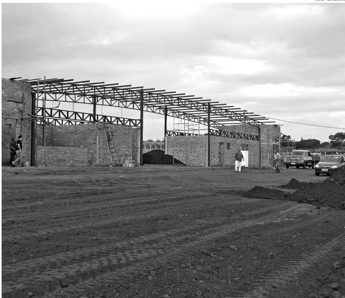
Obras no autódromo não param e primeira prova com caminhões foi marcada para agosto

Nos próximos dias, Coquinho disse que começa a parte da pavimentação da reta de 900 metros de comprimento por 40 metros de largura. "Essa parte requer muito cuidado porque é uma construção especial. Será colocada uma camada de 45 centímetros de pedra para depois colocar uma camada de oito centímetros de um asfalto emborrachado, específico para pista