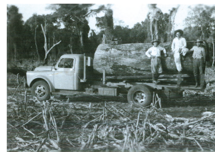
Bepim em uma de suas viagens para exploração de madeira

Serviço prestado: Venda de materiais para construção