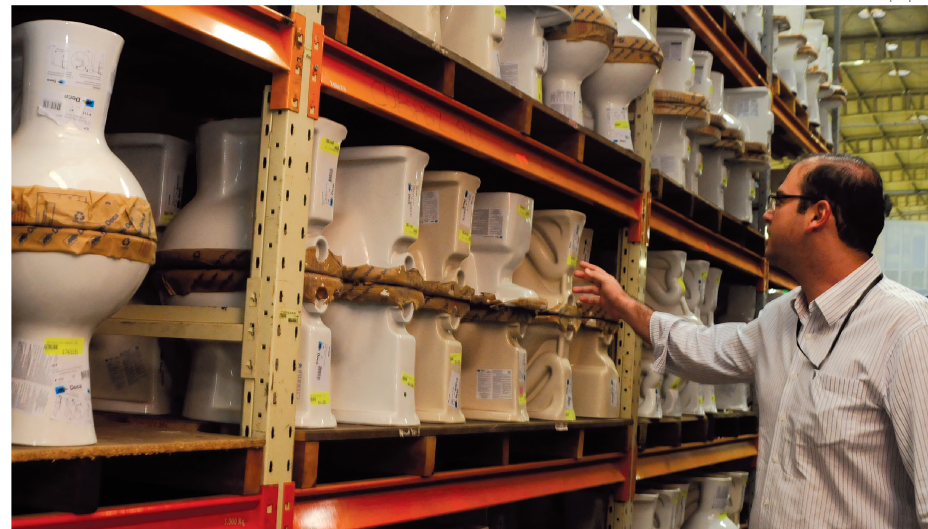
A Moretto conta com um estoque com mais de 18 mil itens