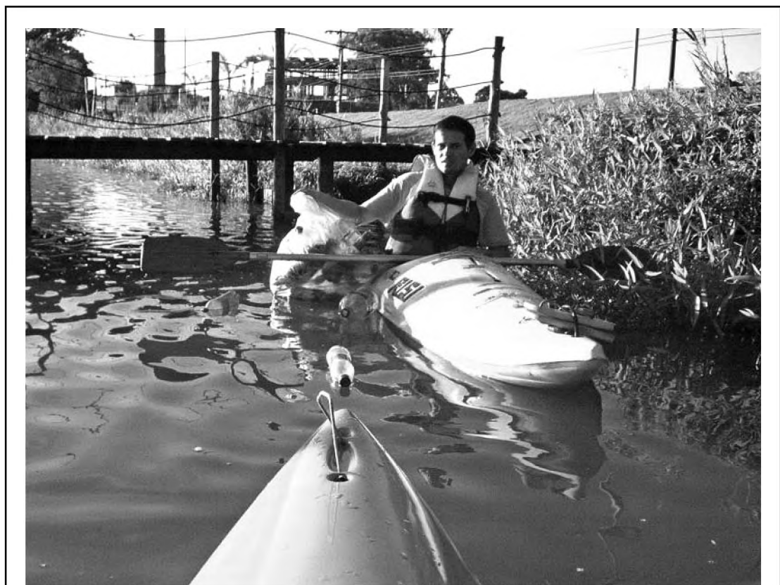
IMUNDÍCIE O flagrante da quantidade de sujeira que se acumula a cada fim de semana no Lago da Prata foi feito por um grupo de amigos ambientalistas que frequentemente navega em caiaques pelo lago e retira das águas garrafas de cerveja, latas de alumínio, pets de refrigerantes, entre outros. Segundo eles, jogados por pessoas que frequentam o Parque do Povo de sexta-feira a domingo.