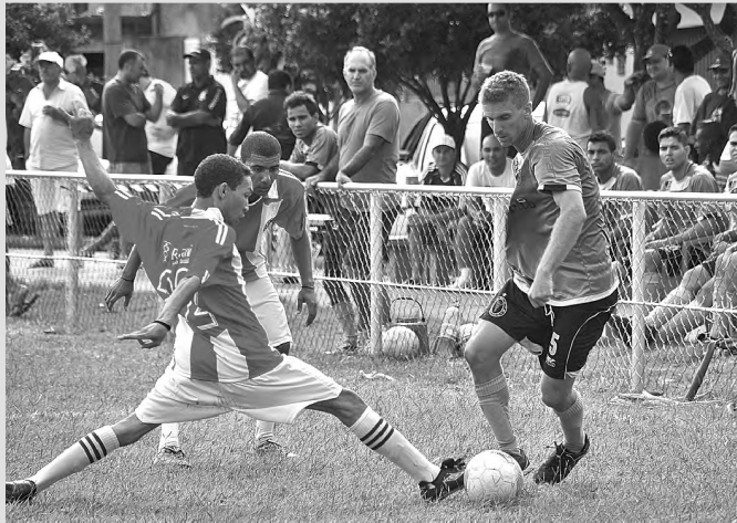
Nações Unidas e Amigos da Fisio: empate