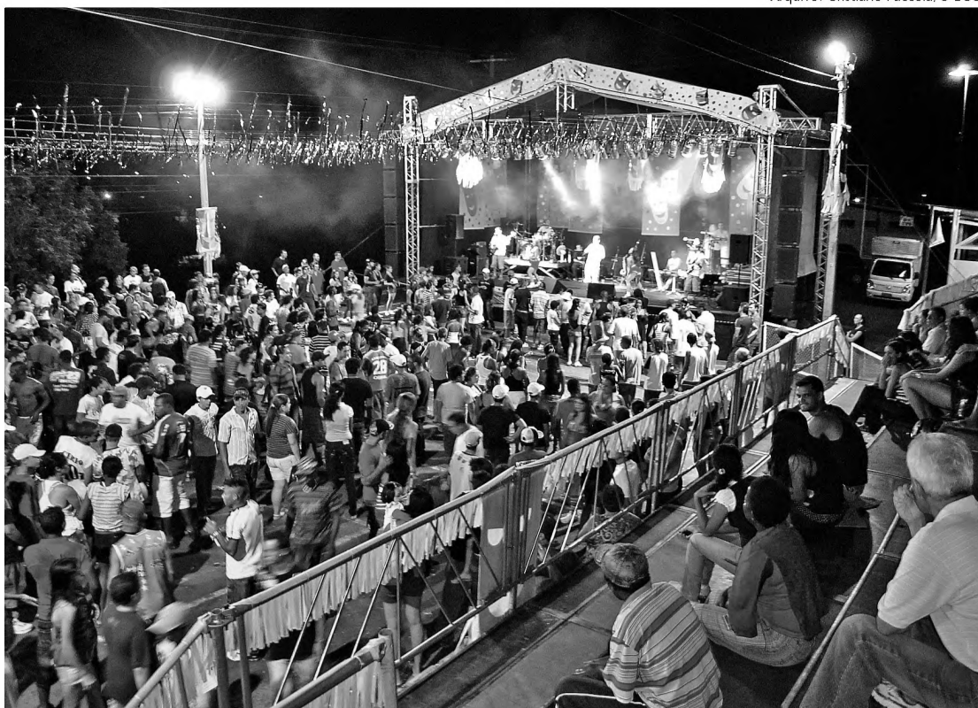
Carnaval Popular começa na noite do dia 6 de março, à noite os bailes vão das 23h às 3h

Além do horário diferenciado, uma cobertura montada em frente ao palco é outra novidade desse ano. A ideia é dar mais conforto para os foliões devido ao período chuvoso do ano, que atinge principalmente crianças e famílias surpreendidas pela chuva du-