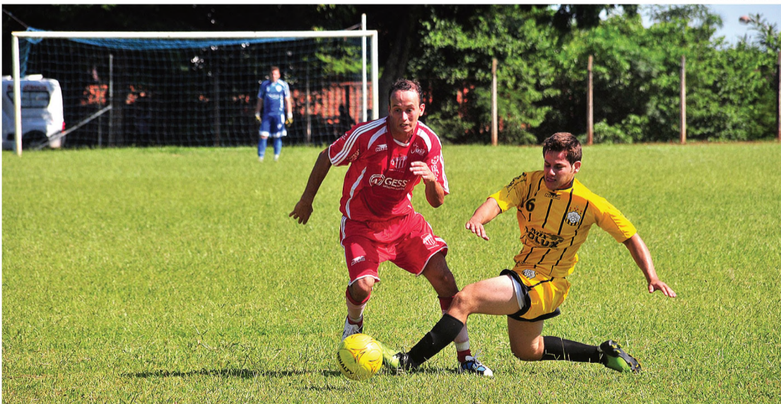
Lance da partida entre Expressinho (vermelho) e Santa Luzia, em Macatuba

A primeira rodada da Copa Macatuba de Futebol Amador Troféu Antonio Ugucioni, começou no domingo 6, com muitos gols. A copa tem parceria com