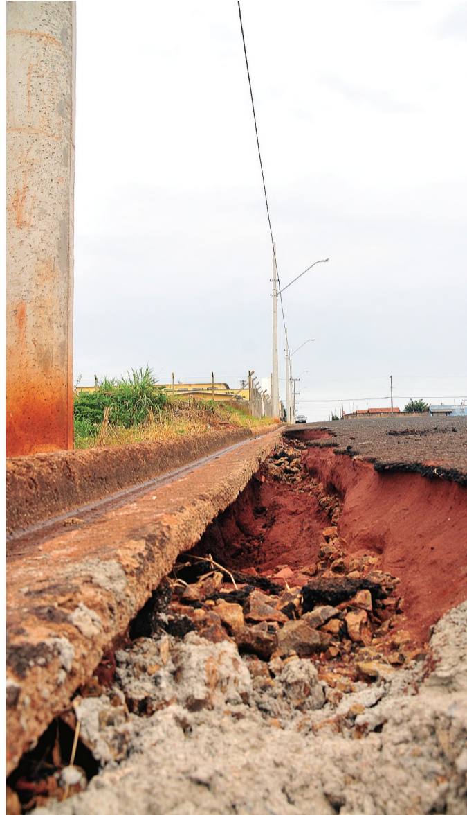
Moradores temem que buraco 'engula' poste de energia

Há cerca de dois meses os moradores da rua João Coneglian, no Jardim Caju, sentem as consequências da falta de galeria de águas pluviais. Com as fortes chuvas dos últimos dias e sem local para escoamento da água, a rua foi ganhando buracos que hoje assustam os moradores. As calçadas também