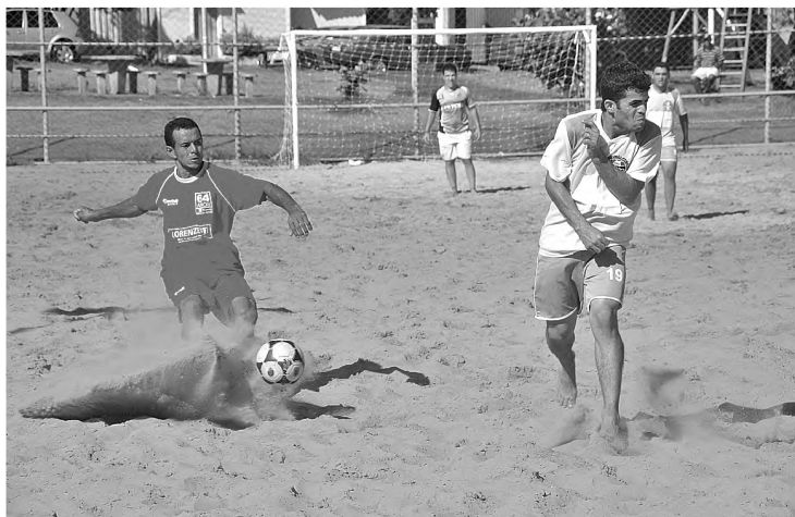
Lance de Sport Primavera e Moretto no campo de areia

À tarde, em jogo movimentado e disputado, o time Meninos da Vila assegurou vaga para a fase seguinte da Copa, ao vencer nos pênaltis a Adria/