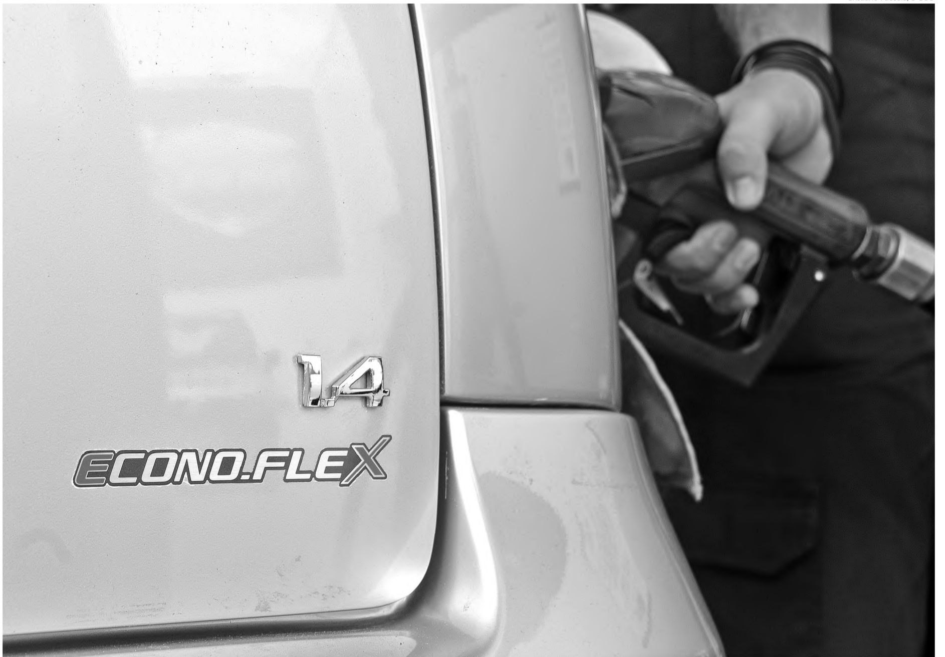
Crescimento do mercado de carro flex, desempenho e adição de etanol a gasolina são os fatores que elevaram consumo de etanol, segundo especialistas

Na cidade de Pederneiras a preferência também foi pelo combustível derivado da cana, mas com uma diferença bem menor que a registrada em Lençóis Paulista. Foram consumidos 7,8 milhões de litros de álcool contra 6,3 milhões de litros de gasolina. Uma diferença de apenas 23%.