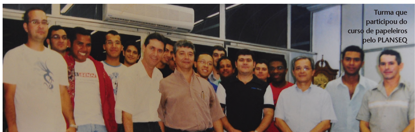
Turma que participou do curso de papeleiros pelo PLANSEQ

Passado o período de turbulência, a entidade se apressa em resguardar mais direitos para o trabalhador papeleiro. “Não adianta se ter estrutura de trabalho sem uma entidade para balizar esse trabalho. Sendo assim, seria uma situação manca”, conclui o coordenador.