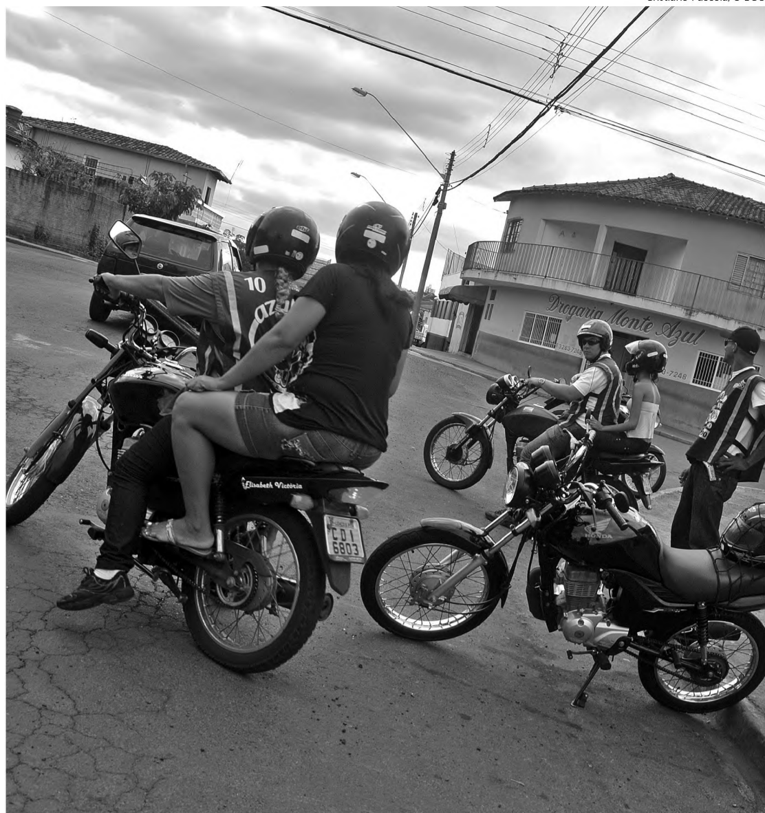
Transporte é opção de 40% dos usuários, segundo dados das empresas de transporte

OS INTERESSADOS DEVEM LEVAR CURRÍCULO NA EMPRESA.