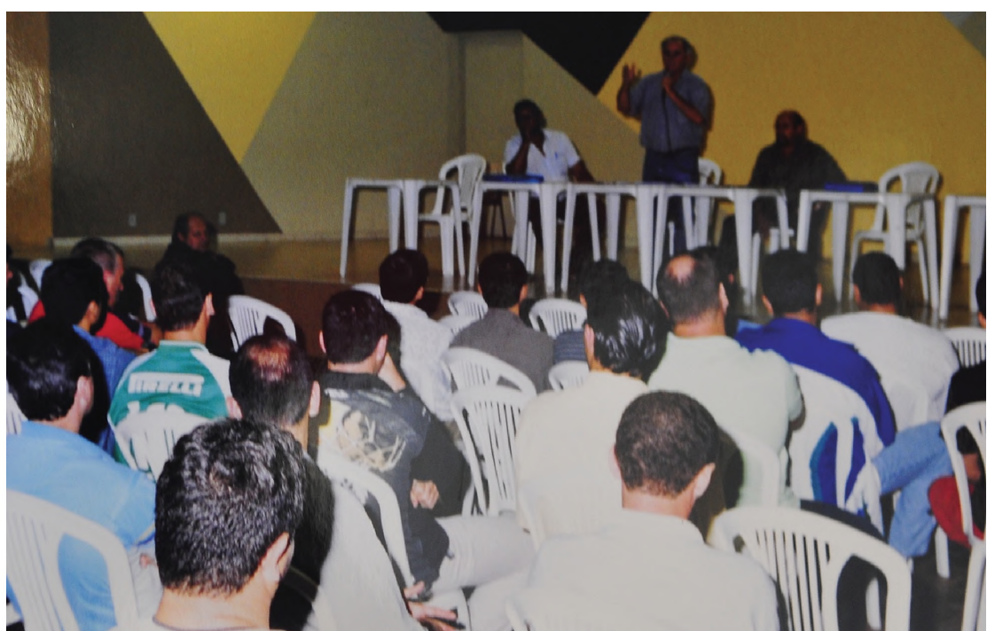
Reunião do sindicato na câmara

fronteiras do Estado. Agora é a vez da entidade criada pela FNTIP em Três Lagoas (MS) seguir os passos de Lençóis Paulista, que passou a figurar na vanguarda trabalhista do mercado de celulose brasileiro.