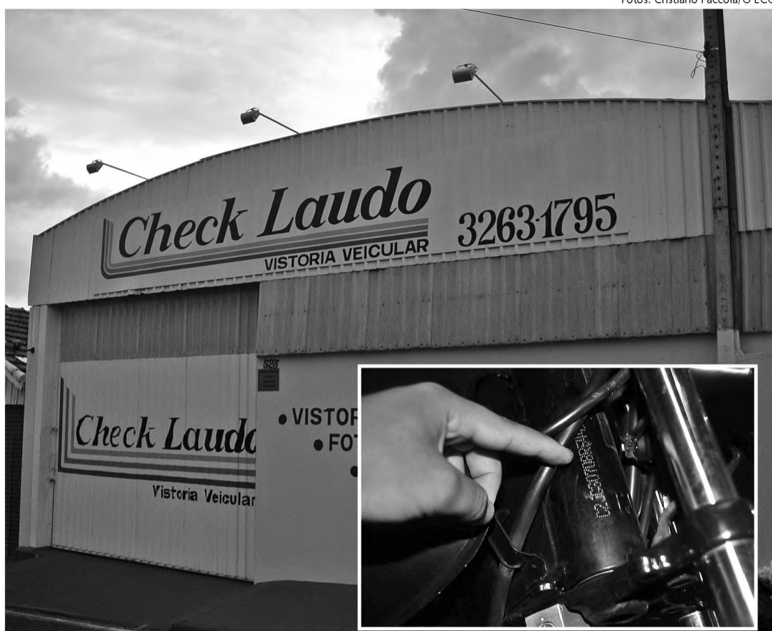
Pela decisão mais recente, laudos de vistorias voltam a ser realizados por empresas especializadas

Das cinco empresas que funcionavam em Lençóis Paulista, segundo apurou O