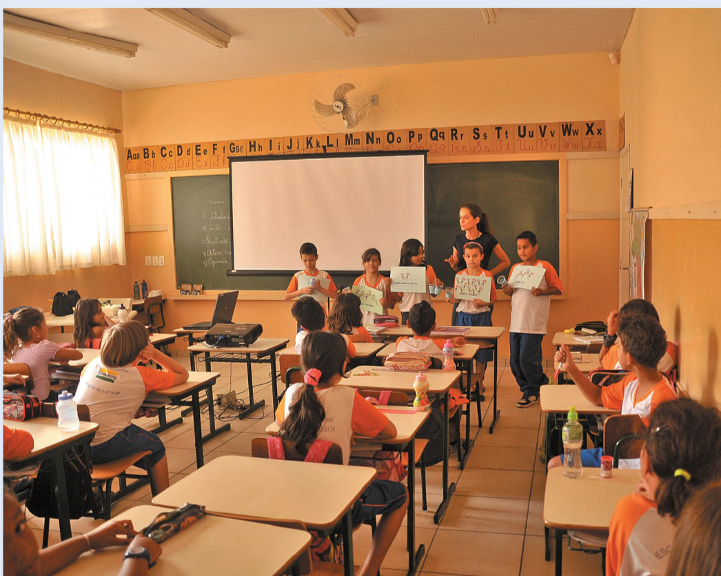
Alunos da escola Eliza Pereira de Barros acompanham palestra sobre uso correto da água