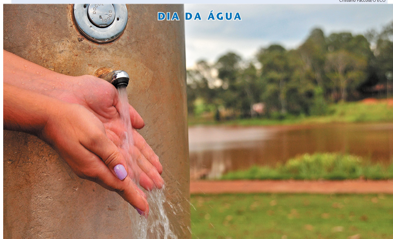
DIA DA ÁGUA

da obrigatoriedade ocorreu na mesma semana em que o governador Geraldo Alckmin assinou decreto que transferiu o comando do Detran para a Secretaria de Gestão Pública de São Paulo. ► Página A4