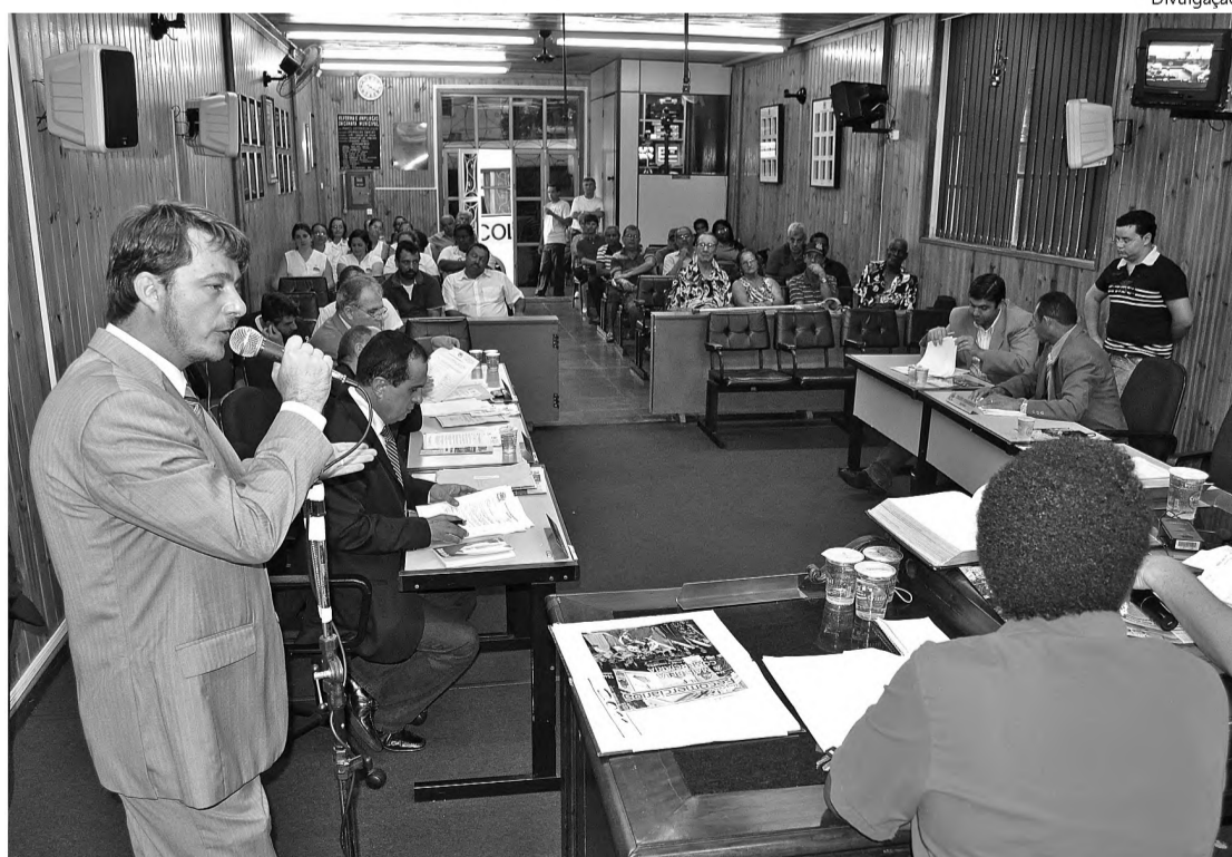
Sessão legislativa em Agudos, ontem: apoio à subvenção para as entidades sociais da cidade