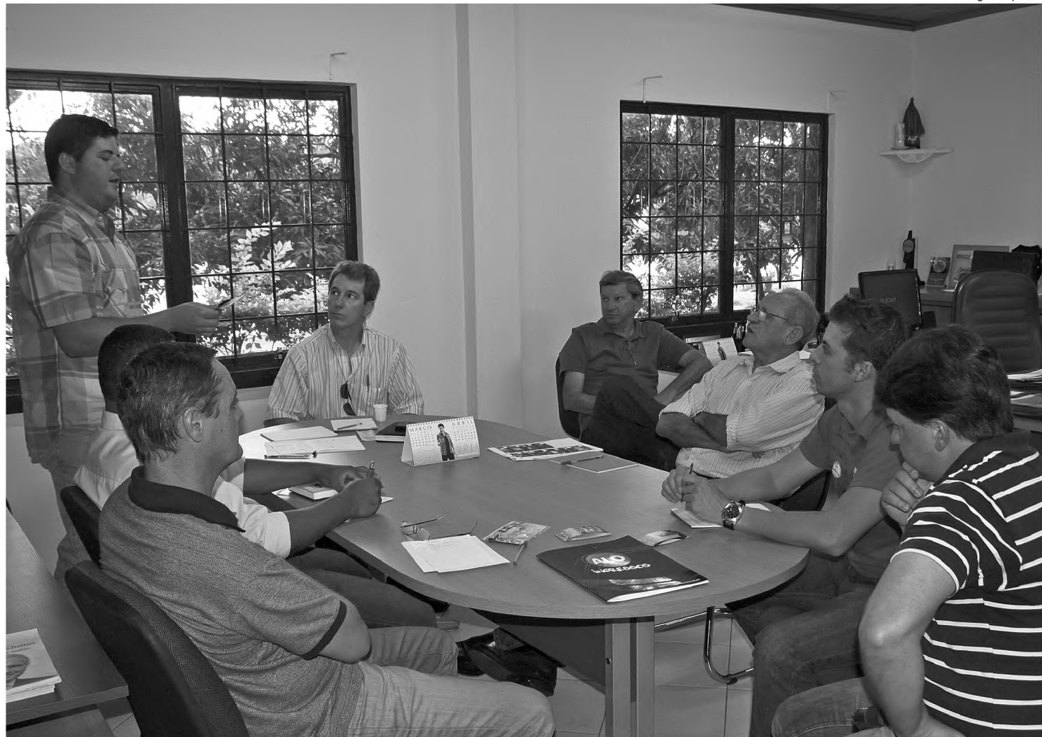
Reunião realizada ontem entre a Alô Ingressos e Associação Rural deveria fechar a parceria para venda de ingressos pela internet

A grade de shows da 34ª Facilpa terá cinco noites com portões abertos, cinco com bilheteria e um com ingresso solidário (um quilo de alimento não perecível).