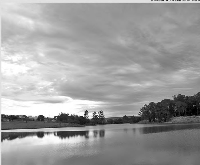
Lago da Prata vai receber variadas espécies de peixes