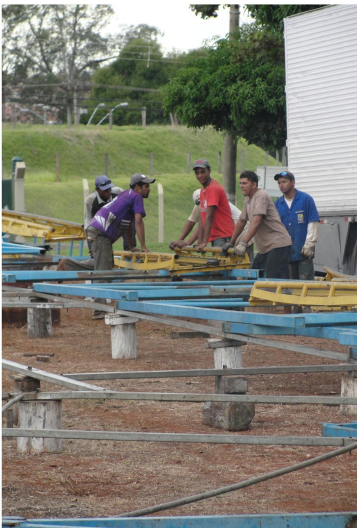
Homens trabalhavam ontem à tarde na montagem do parque...

Quem quiser economizar precisa se apressar para adquirir ingressos; dupla lençoense, que abre a programação artística, lança CD Apaixonado e terá stand