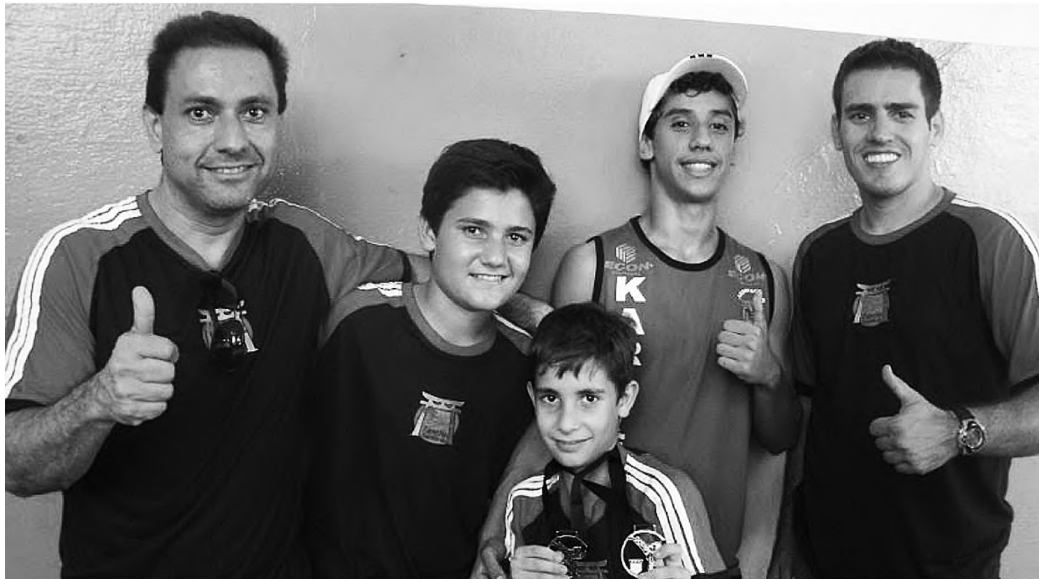
Equipe da Associação Zanchin de Karatê, que está classificada para a final do Paulista