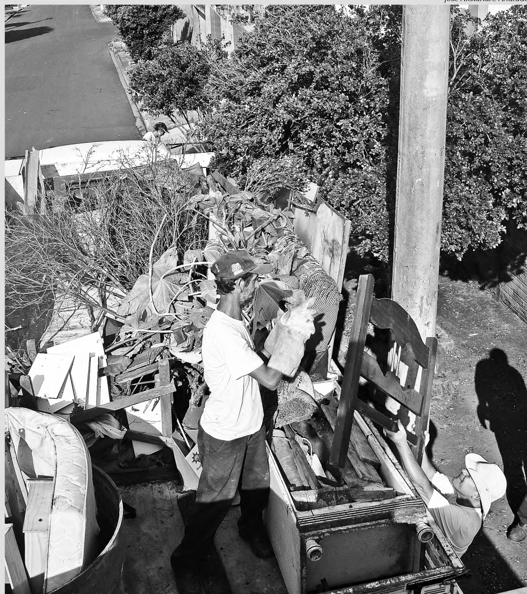
Material recolhido do imóvel lotou vários caminhões da diretoria de Meio Ambiente