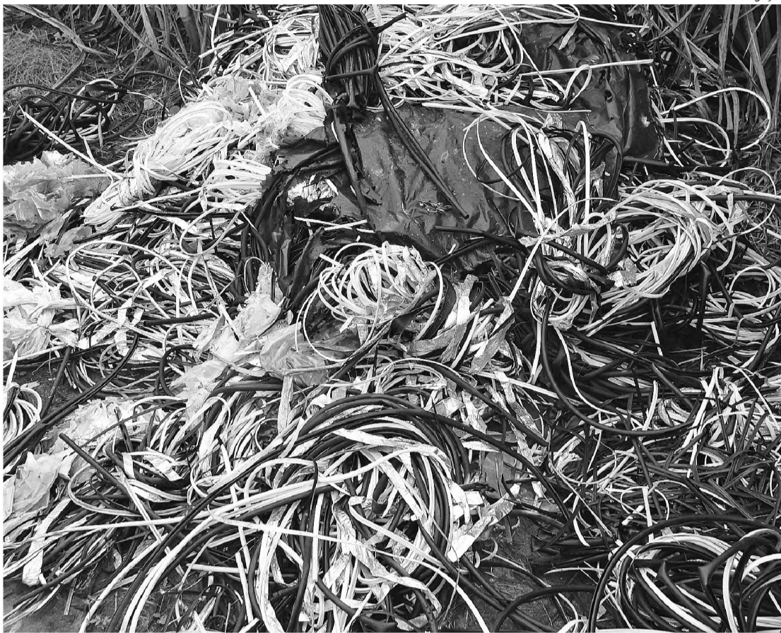
Material apreendido com o homem acusado de furtar câmeras de videomonitoramento

cia Militar apreendeu um tijolo pesando 286 gramas de maconha na Vila Contente. A polícia fazia patrulhamento de rotina quando se deparou com um menor em atitude suspeita. Ao perceber a viatura, o rapaz fugiu e tentou jogar a maconha sobre o muro para o interior de uma residência, mas não conseguiu. A droga caiu sobre a calçada e foi apreendida pelos policiais militares.