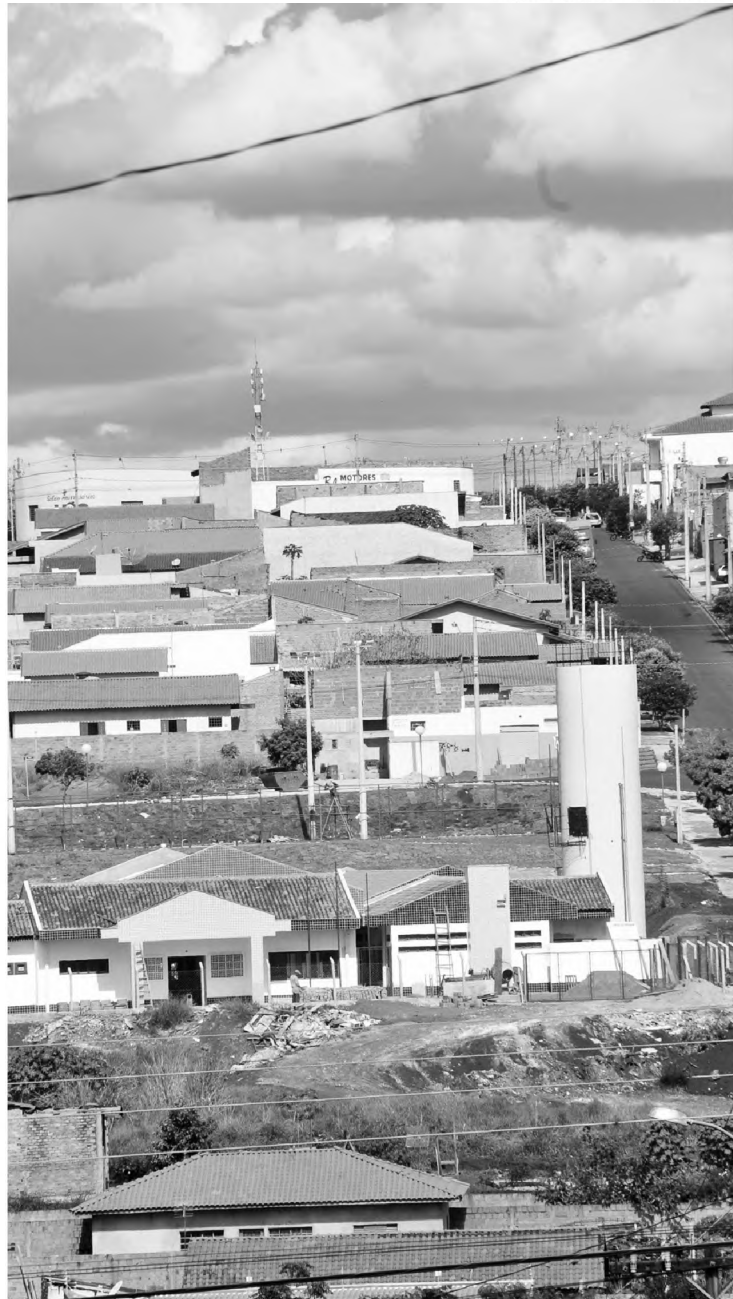
Vista do prédio em construção, no bairro Jardim Maria Luiza, que será inaugurada