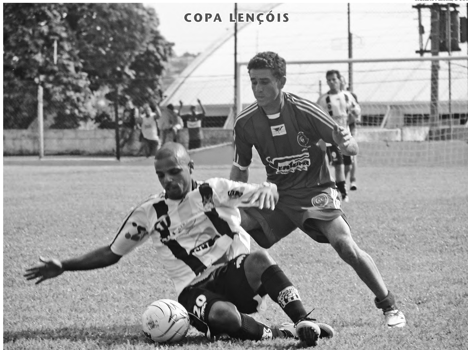
Jogada da partida entre Santa Luzia e Grêmio da Vila, no último fim de semana