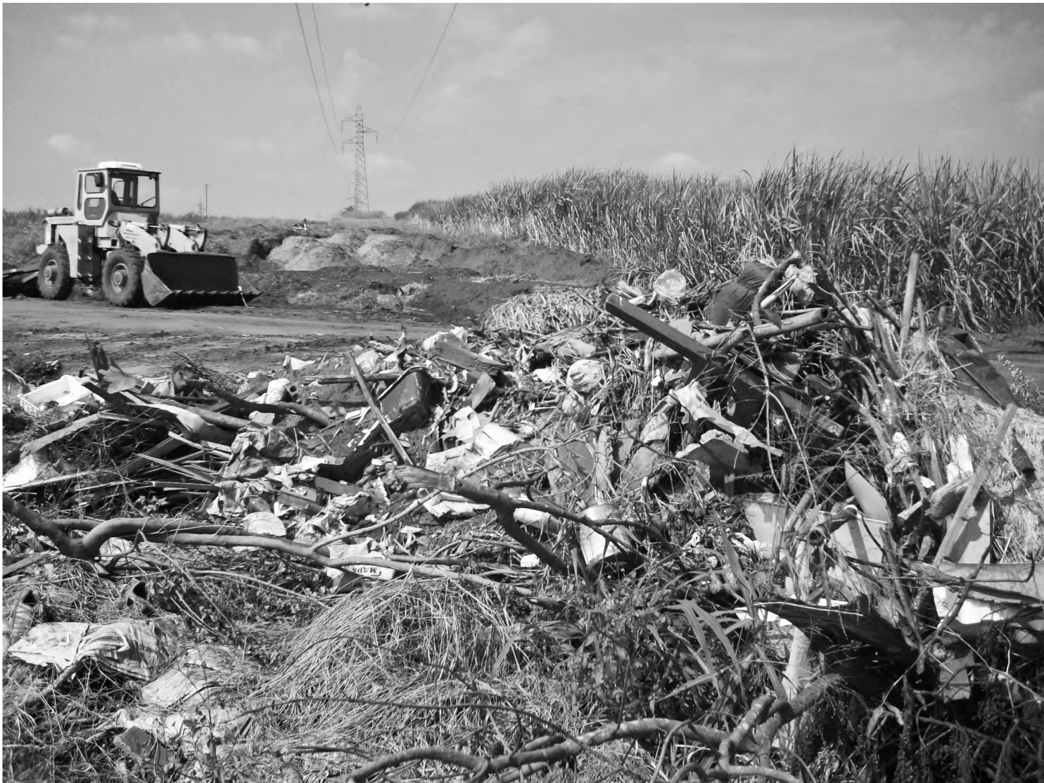
Foto tirada por morador mostra máquinas da Prefeitura trabalhando próximas ao monte de lixo; até ontem, material continuava no local

O morador contou que passou pelo local na última quarta-feira (dia 20) e viu uma máquina trabalhando. "A máquina estava trabalhando no local. Eles chegaram a amontoar o lixo embaixo da torre e não foram capazes de jogar sobre o caminhão para levar embora. Isso é um desperdício do dinheiro público", reclamou.