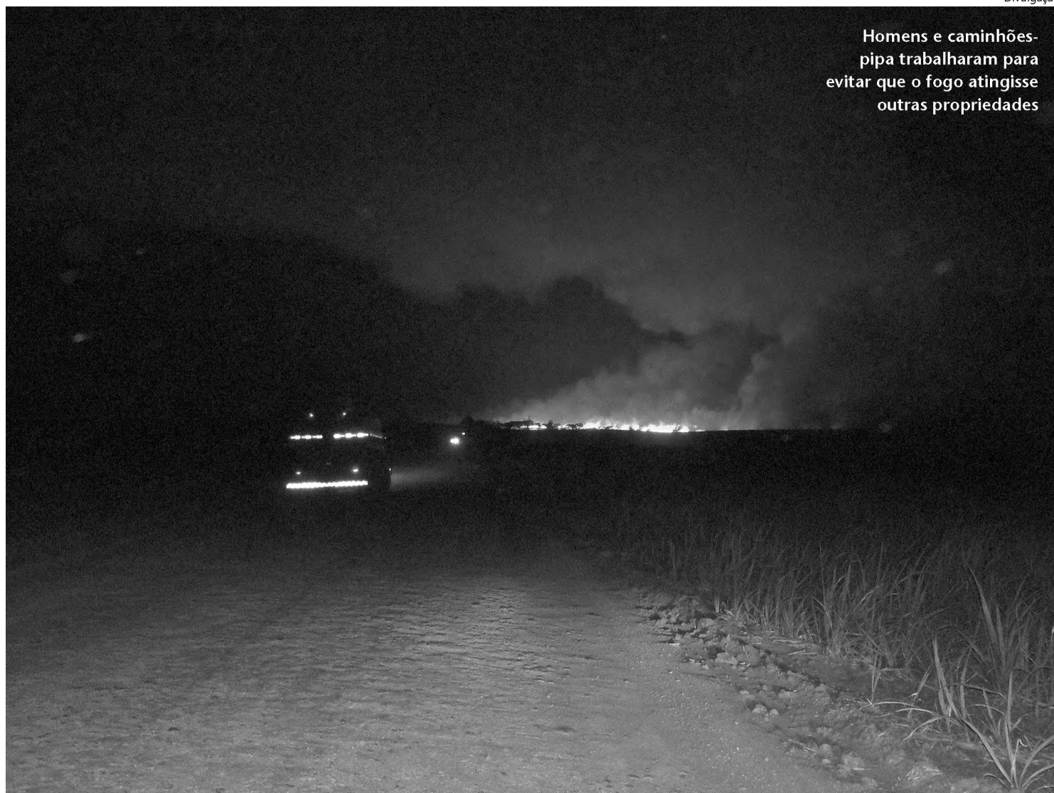
Homens e caminhões-pipa trabalharam para evitar que o fogo atingisse outras propriedades

O bombeiro explicou que o fogo teve início à tarde e pode ter sido provocado por uma máquina, que se incendiou. Os funcionários conse-