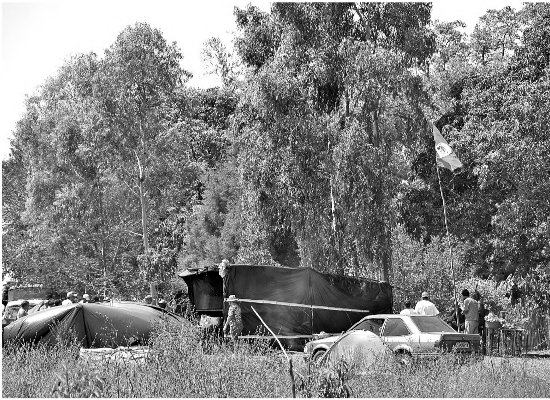
Cristiano Paccola/O ECO

Na ocasião, depois de deixar a propriedade por determinação da Justiça, integrantes do MST realizaram uma marcha pelas ruas de Bauru e um ato público na Câmara Municipal. À época, eles avisaram que novas ocupações