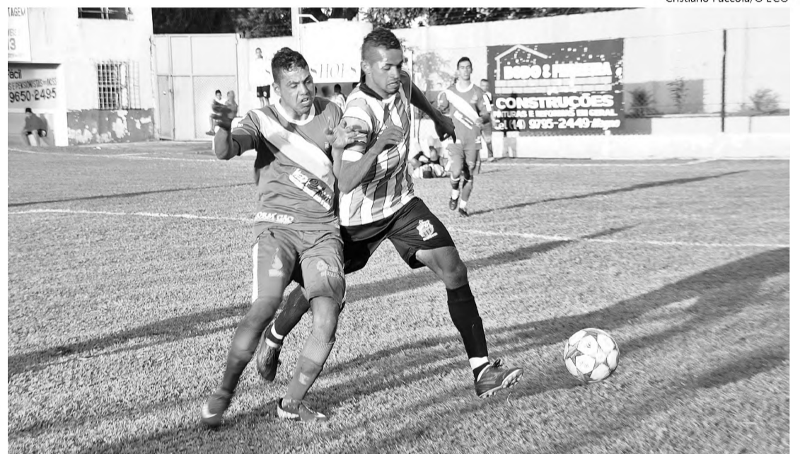
A equipe Mensagem conquistou a sua segunda vitória na competição