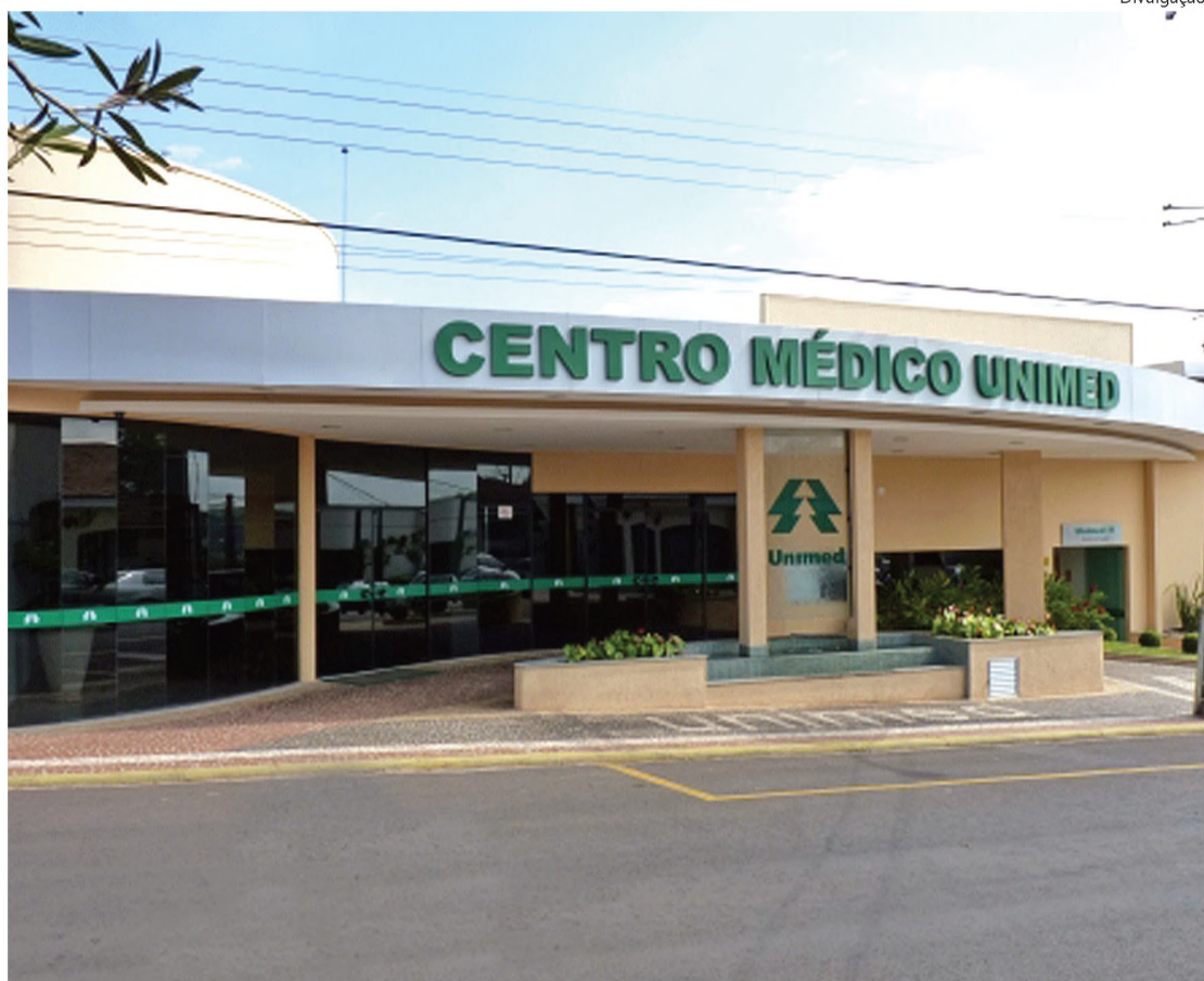
Unimed Lençóis atende mais de 30 mil pessoas em Lençóis Paulista, Macatuba, Areiópolis e Borebi

E8 ★ LENÇÓIS PAULISTA, TERÇA-FEIRA, 18 DE OUTUBRO DE 2011