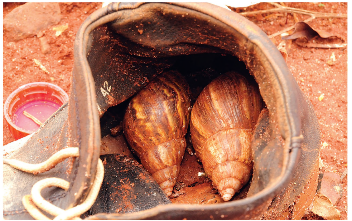
Diretoria de Saúde pede à população que mantenha os quintais limpos para combater o mosquito palha, transmissor da leishmaniose - já diagnosticada em cães -, e a infestação de caramujos