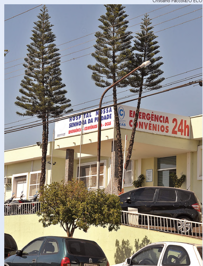
Fachada do Hospital Nossa Senhora da Piedade

Em atividade desde o início dos anos 1970, a Santa Casa de Macatuba passou por uma grave crise nos últimos anos e hoje