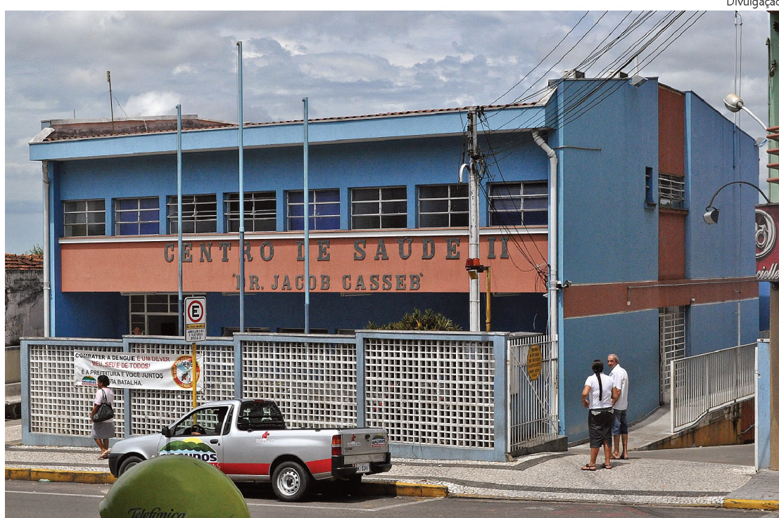
Em Agudos, a rede pública de saúde atende, em média, três mil pessoas por dia

E4 ★ LENÇÓIS PAULISTA, TERÇA-FEIRA, 18 DE OUTUBRO DE 2011