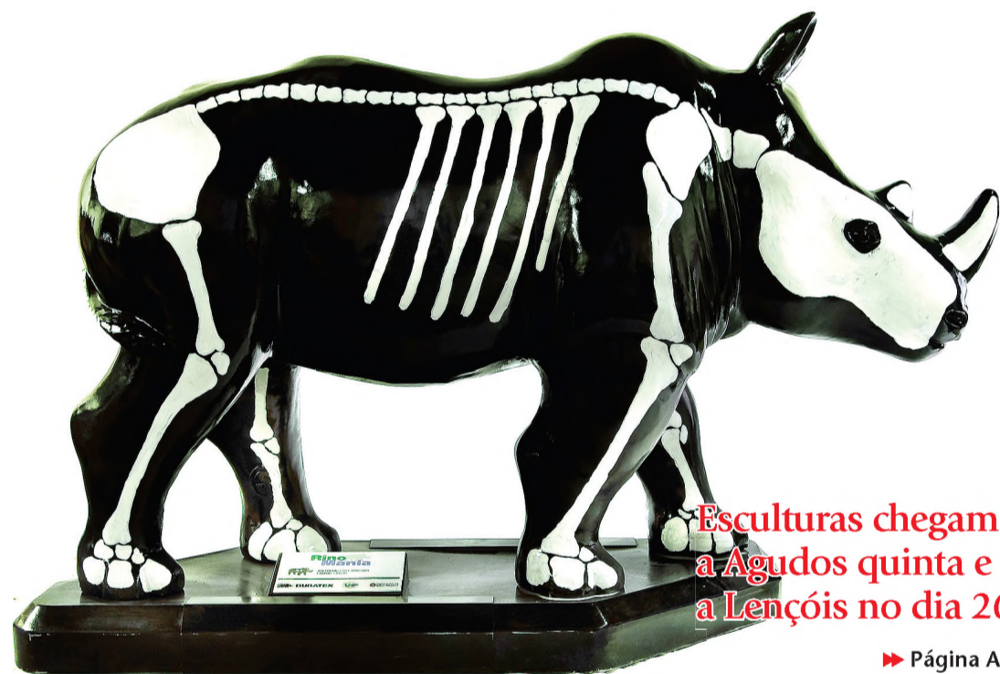
Esculturas chegam a Agudos quinta e a Lençóis no dia 26