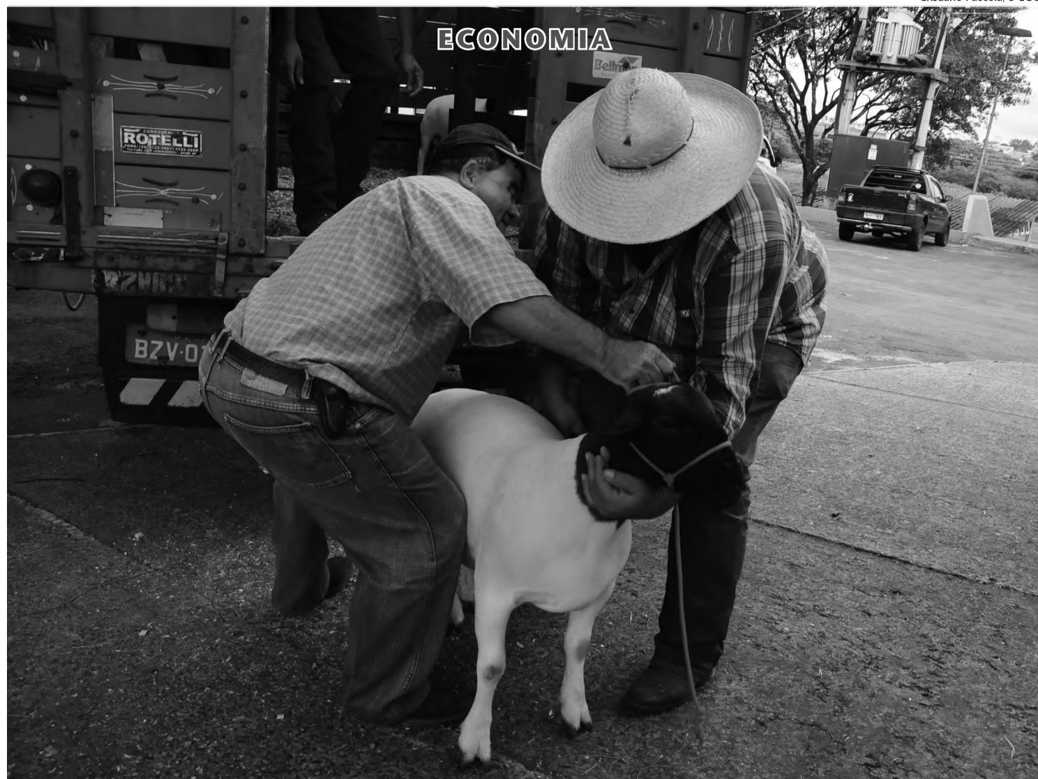
Primeiros animais para exposição na 24ª Expovelha começaram a chegar ontem; evento vai até o domingo 23, com diversas atrações