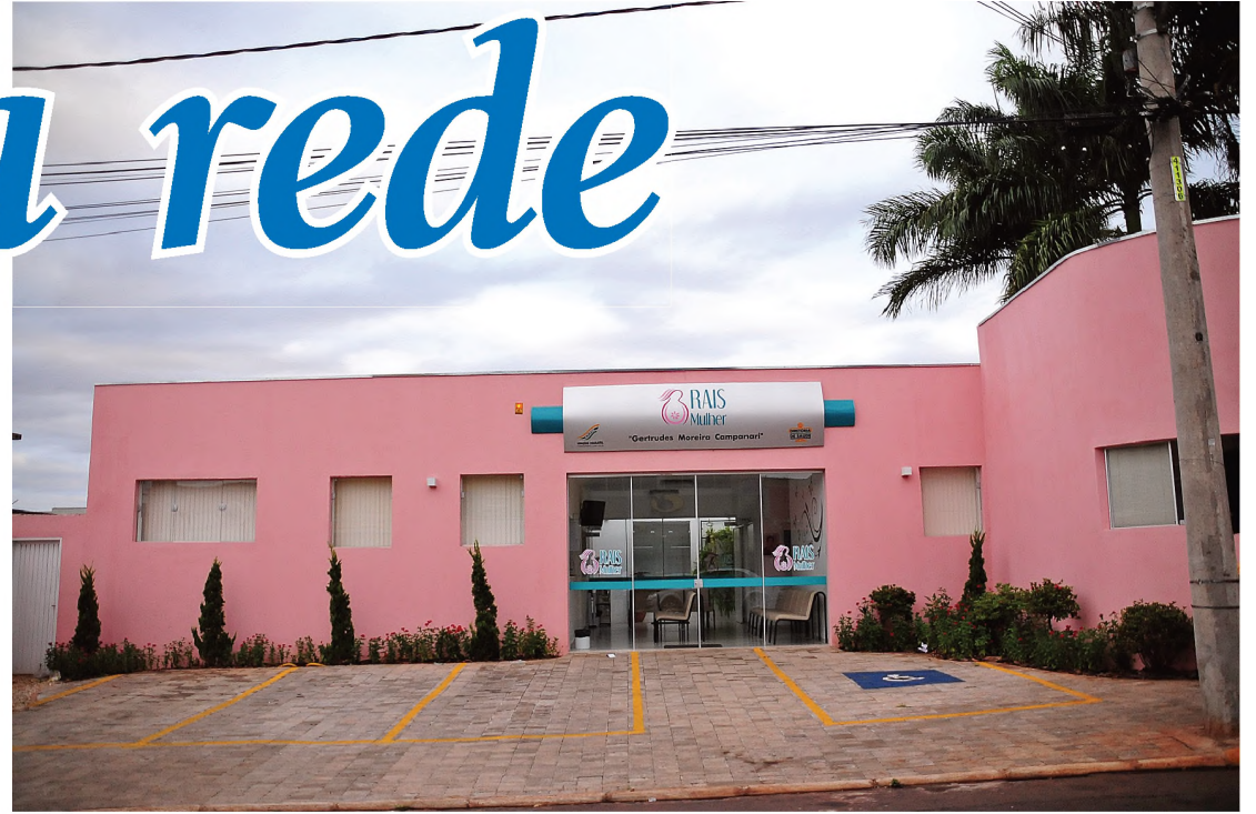
Inaugurado recentemente, Rais Mulher incrementa estrutura de saúde pública em Lençóis Paulista

Entre assistência médica e odontológica, a rede de atenção básica de saúde de Lençóis Paulista atende, em média, 26 mil pessoas por mês. Os centros de especialidades contabilizam cerca de 7,2 mil atendimentos mensais e a saúde mental tem, mensalmente, um número aproximado de 800 pacientes. Fora isso a rede municipal de saúde também administra o Pronto Socorro, com aproximadamente 4 mil atendimentos mensais.