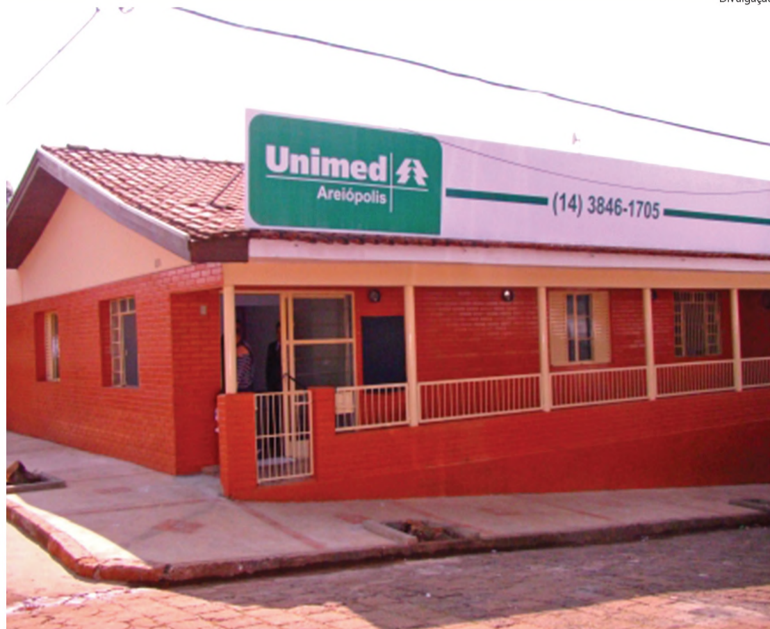
Recentemente Unimed reinaugurou posto em Areiópolis com atendimento ambulatorial e emissão de guias