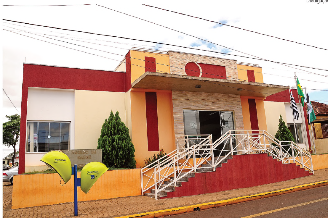
Já em Macatuba, a estrutura do PSF atende 95% da população: unidades estão reformadas