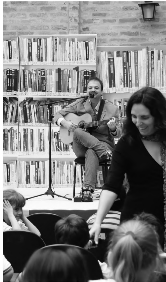
Na tarde de ontem, crianças já participaram da oficina Cantigas para criança, com o grupo Trovadores Urbanos

Outra solução é comprar iscas próprias em casas de produtos agropecuários. É só jogar o material no jardim e os moluscos aparecem mortos. (FB)