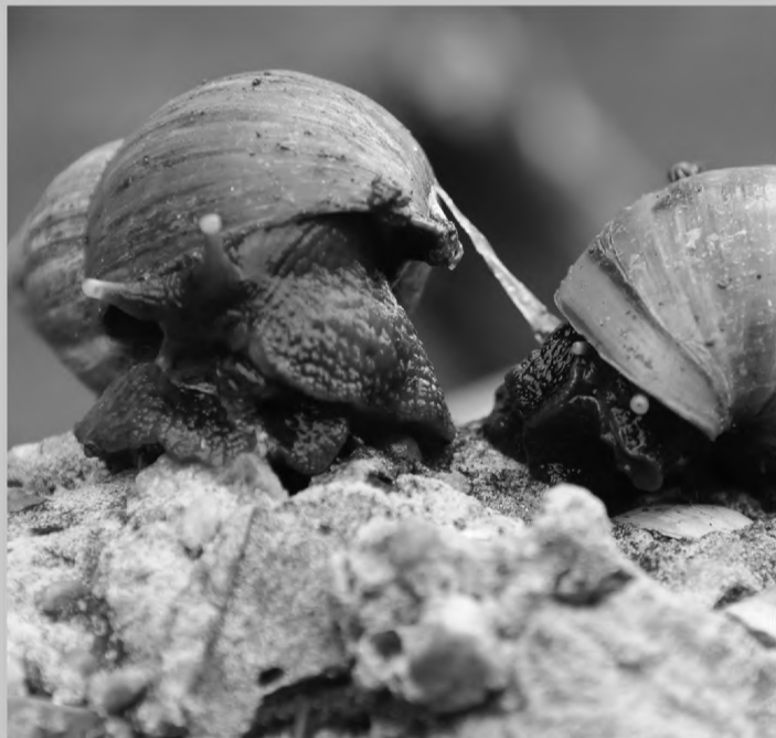
Com a volta das chuvas, caramujos já voltam a infestar os quintais e terrenos baldios

É comum depois de vários dias de chuva que o quintal ou muros fiquem infestados de caramujos, incomodando muita gente. Ao contrário que muita gente pensa, sal ou cal não acabam com o molusco. A partir do momento que o caramujo recebe esses ingredientes, ele desova cerca de trezentos ovos. Isso faz com que ele se prolifere no mesmo local.