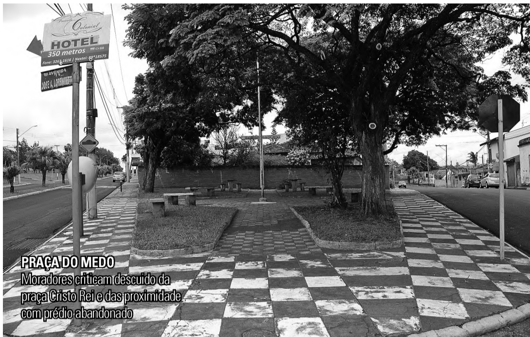
PRAÇA DO MEDO Moradores criticam descuido da praça Cristo Rei e das proximidades com prédio abandonado

Zilda Caçador, monitora de escola e moradora do bairro, diz que o problema está relacionado com diversos fatores. "A vila está esquecida pelo poder público e pelas autoridades. É necessário melhorar a estrutura do bairro, iluminação da praça, cortar o mato dos terrenos e tirar essas pessoas da rua. Tem um prédio abandonado aqui do lado que serve como hotel para