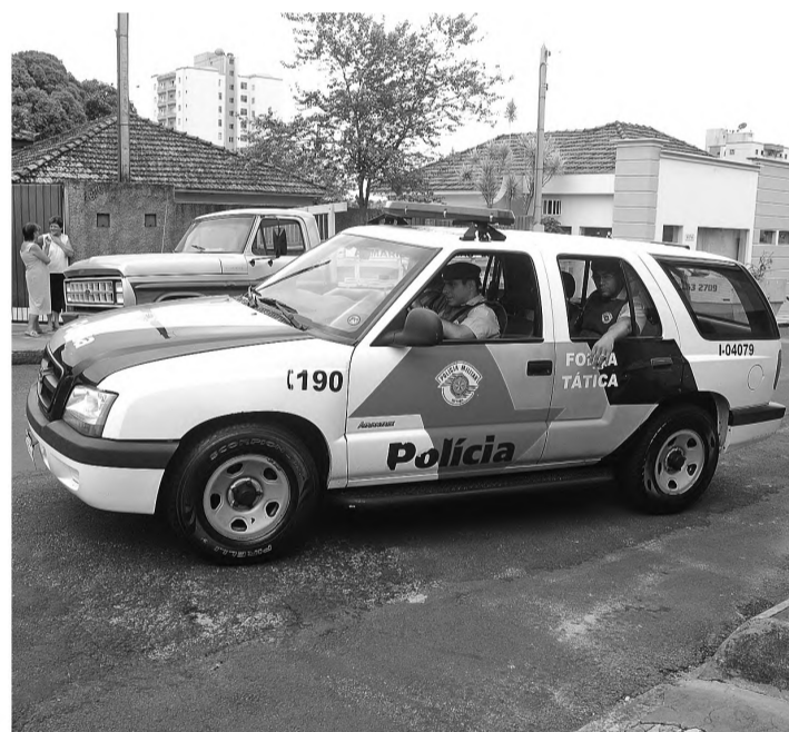
FORÇA DE COMBATE À CRIMINALIDADE - Ação da Polícia Militar levou várias pessoas para a cadeia no final de semana

Pela maneira de intimidar as pessoas, os dois são suspeitos de outros roubos que vêm ocorrendo desde o final do ano. Também são suspeitos, de armados com uma faca, roubar uma mulher na semana passada, logo após a vítima desembarcar de um ônibus circular. "Eles roubavam mulheres e adolescentes", contou o sargento Azevedo, da Equipe da Força Tática da PM, ao pedir que outras vítimas procurem a Delegacia de Polícia para mantê-los presos por mais tempo.