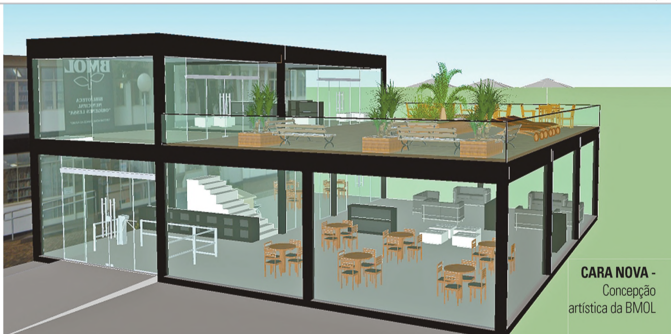
CARA NOVA - Concepção artística da BMOL