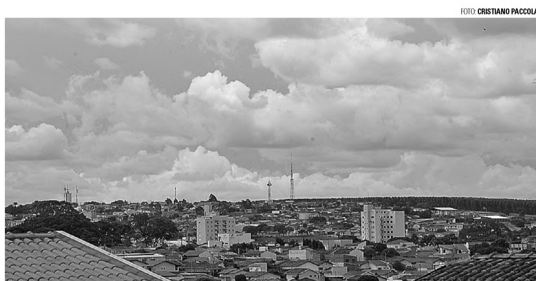
SOL E CHUVA - Tempo segue nublado; a partir de amanhã, previsão é de que o sol apareça entre pancadas de verão

Figueiredo também orienta a população que tiver dúvidas em relação ao tempo e quiser orientação, que procurem o IPMET. O instituto tem um serviço 24 horas para atender à população. O telefone é (14) 31036029.