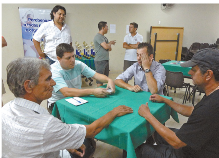
PREPARAÇÃO - Ação serve de aquecimento para o torneio interno do CEM, que acontece a partir de abril

O campeonato interno de truco é um dos mais disputados do CEM (Clube Esportivo Marimbondo). De acordo com o calendário esportivo do ano, o campeonato da modalidade acontece a partir de abril.