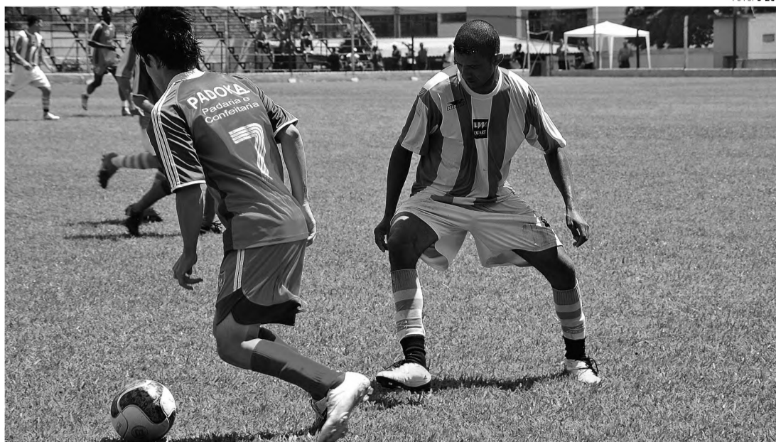
DE VIRADA – A equipe do Palestra saiu atrás no placar e conseguiu a virada sobre o Nacional