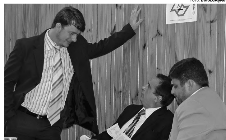
REAJUSTE - Vereadores de Agudos passam a ganhar R$ 6 mil a partir de 2013; aumento foi aprovado em sessão realizada na sexta-feira 9

Kucão foi procurado para comentar o voto contrário, mas por motivo de viagem particular, não foi possível o contato.