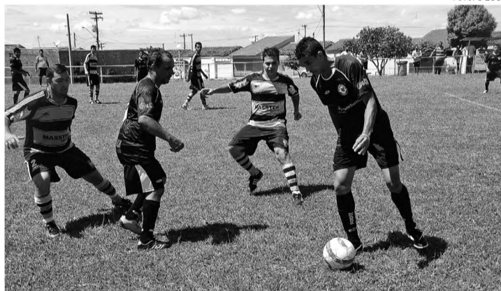
GOLEADA – O Millenium bateu o Monte Azul por 4 a 0 e se garantiu na final da Copa Lençóis que acontece no domingo 18, no Jardim América

As equipes do Millenium e Palestra/Esritório Ventura/Padoka disputam no próximo domingo 18, às 10h15, no campo society do Jardim América, a final da 4ª Copa Lençóis de Futebol Society - Troféu Luiz Antonio Gomes, o Zinho. Millenium e Palestra buscam o bicampeonato da competição. O Millenium ergueu a taça em 2009 e o Palestra levantou o caneco em 2010. Antes, às 9h, Monte Azul e Nova Lençóis brigam pelo terceiro lugar.