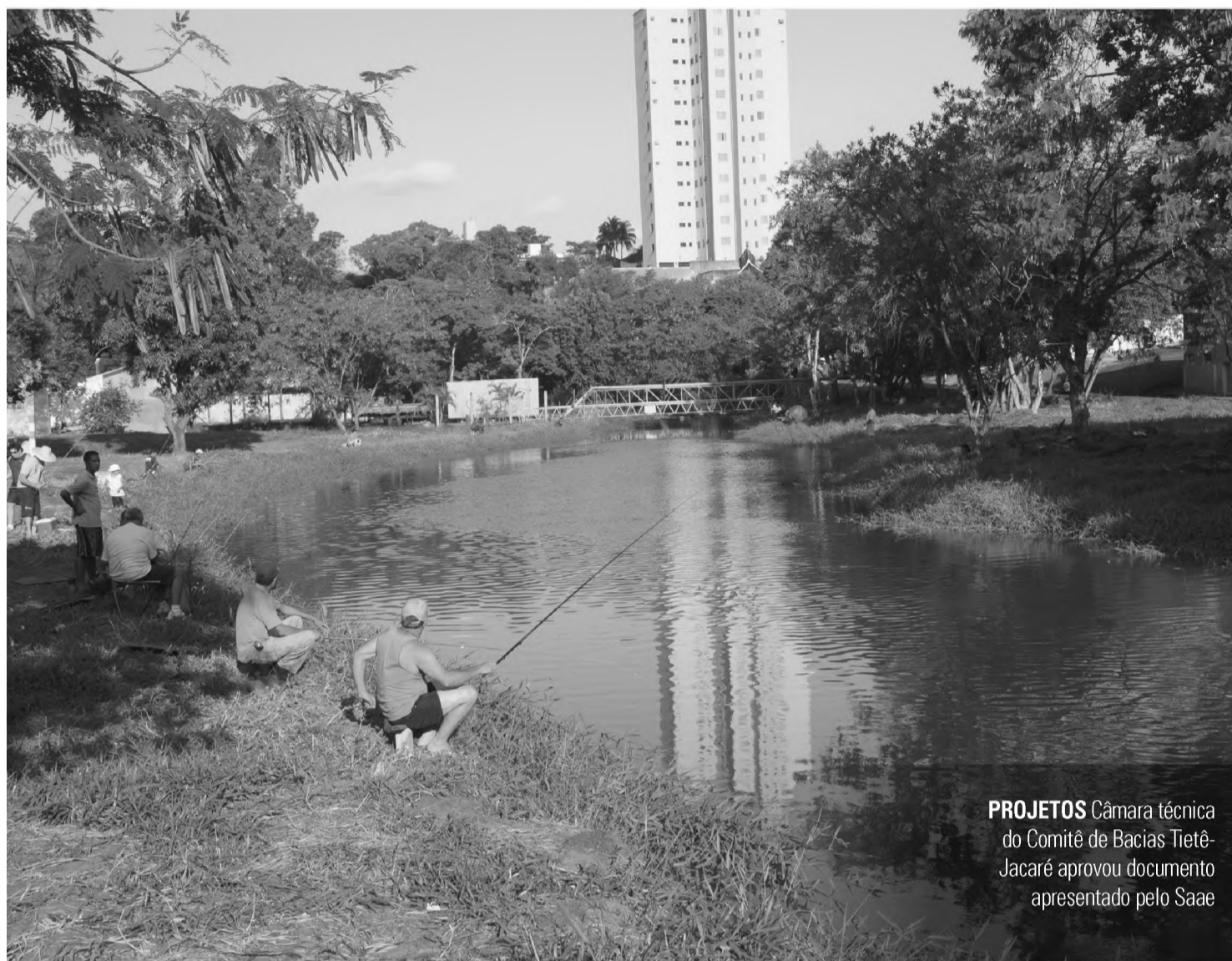
PROJETOS Câmara técnica do Comitê de Bacias Tietê-Jacaré aprovou documento apresentado pelo Saae

Levantamento servirá de base para formulação de Plano de Modernização da Rede de Água; estudo vai analisar produção de água, setorização da distribuição e redução de perdas