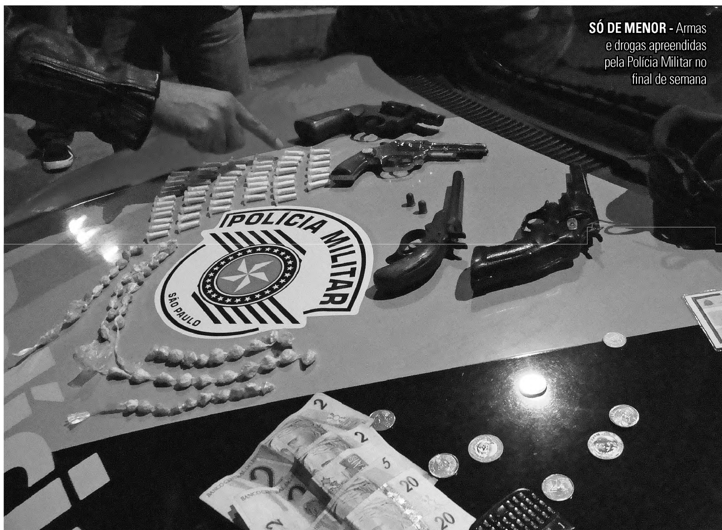
SÓ DE MENOR - Armas e drogas apreendidas pela Polícia Militar no final de semana

Filmagens mostram menor de 12 anos em assalto à agropecuária; adolescentes apreendidos com armas moram no mesmo bairro e são amigos