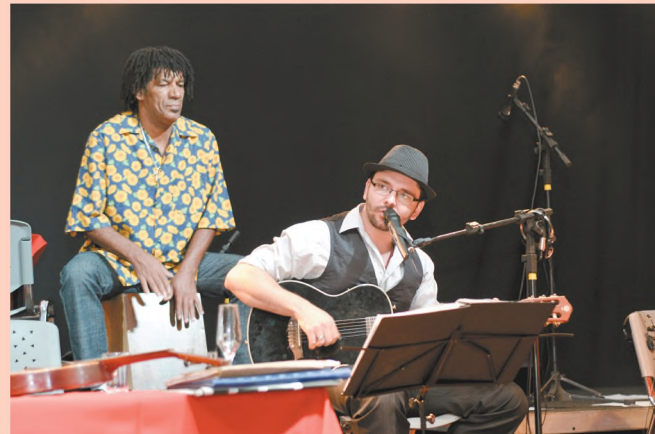
SUCESSO Foi um sucesso a realização do baile de Dia dos Namorados, no último final de semana, no Clube Esportivo Marimbondo. Cerca de 250 pessoas participaram do evento, que teve animação da conceituada banda Família Klim. Quem foi, aprovou.