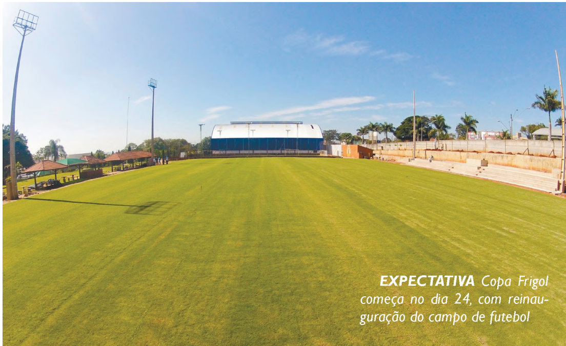
EXPECTATIVA Copa Frigol começa no dia 24, com reinauguração do campo de futebol

Abertura da competição marca início da Copa Frigol; associados que não se inscreveram até domingo 10 vão ficar na lista de espera