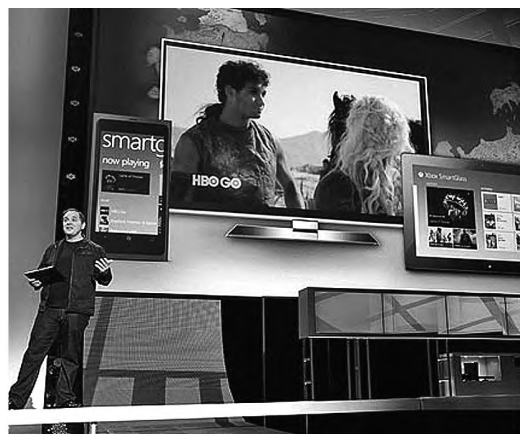
Apresentação de recurso do Xbox 360 que integra equipamentos da casa

Qual o aparelho de entretenimento mais completo da sua casa? TV? Computador? Se os planos de Microsoft, Nintendo e Sony derem certo, no futuro próximo sua resposta será videogame. Na E3, a maior feira de games do mundo, realizada em Los Angeles na semana passada, os três fabricantes mostraram que querem transformar seus consoles em experiências centrais de lazer, interligadas a ferramentas on-line, tablets e smartphones. Entraram de vez na disputa pelo mercado que busca englobar todo o conteúdo multimídia do usuário em um só aparelho conectado a todas as telas da casa. Concorrem não só entre si, mas também com outras empresas de mídia e tecnologia, como Apple, Google e os serviços de TV por assinatura. A Microsoft anunciou o SmartGlass, tecnologia que integra ao seu videogame Xbox 360 aparelhos com os sistemas operacionais Windows, iOS e Android. Na prática, o programa faz do console da empresa o coração de um ecossistema: será possível usar celulares ou tablets para exibir informações adicionais dos games (como mapas ou inventário de itens) ou filmes (como ficha de atores ou sinopses) executados pelo Xbox.