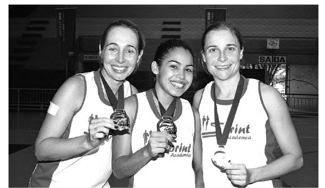
OURO – As atletas da Sprint garantiram a medalha de ouro ao vencer a Prefeitura de Lençóis