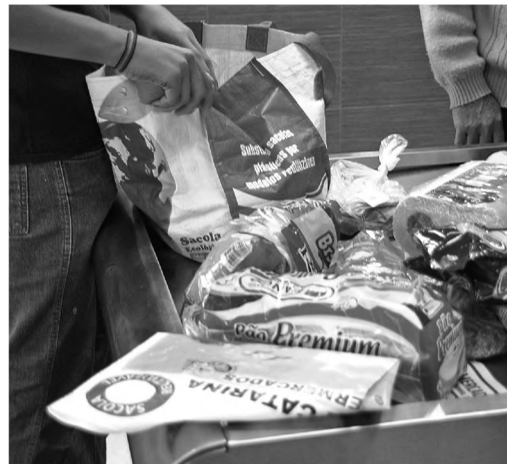
MERCADOS - Sacolinhas serão distribuídas de novo