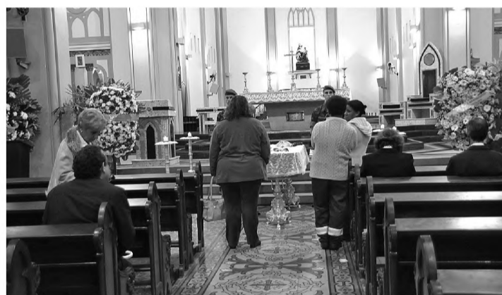
VELÓRIO - Dom Aloysio José Leal Penna foi velado na Catedral Metropolitana de Botucatu. A cada duas horas missas eram realizadas para lembrar e homenagear o arcebispo emérito da Arquidiocese Santana.

dom Aloysio será levado para o Rio de Janeiro, onde será velado na Igreja Santo Inácio do Colégio dos Jesuítas, em Botafogo. O sepultamento será na sexta-feira, às 16h, no Cemitério São João Batista, de Botafogo, no Rio, junto a seus confrades.