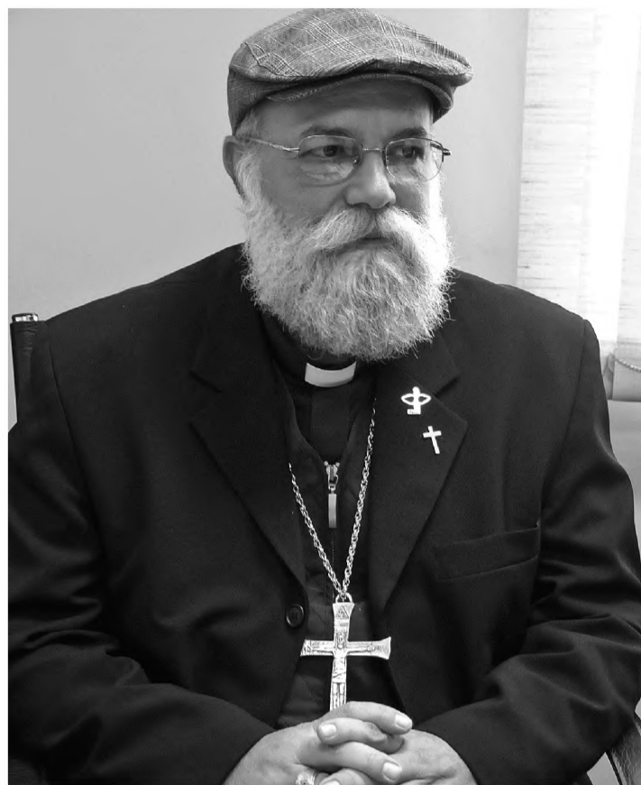
TRISTEZA - Dom Maurício falou sobre a morte do arcebispo emérito de Botucatu, dom Aloysio, que faleceu na terça-feira