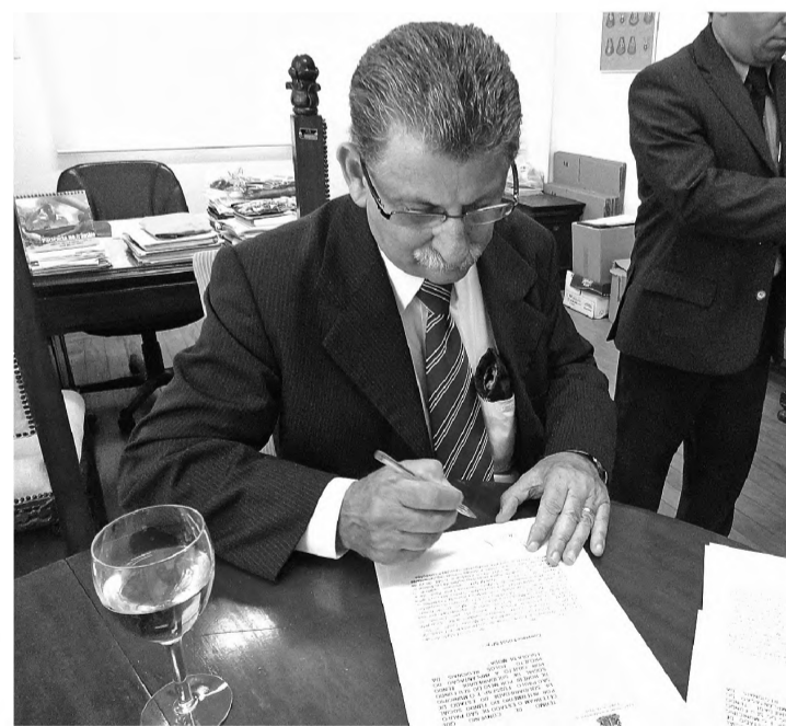
VERBAS - Vaca assina convênio que garantiu um caminhão pipa para a prefeitura

Mas não são os únicos recursos. Além desses seis convênios, o Estado já autorizou R$ 1 milhão para construção