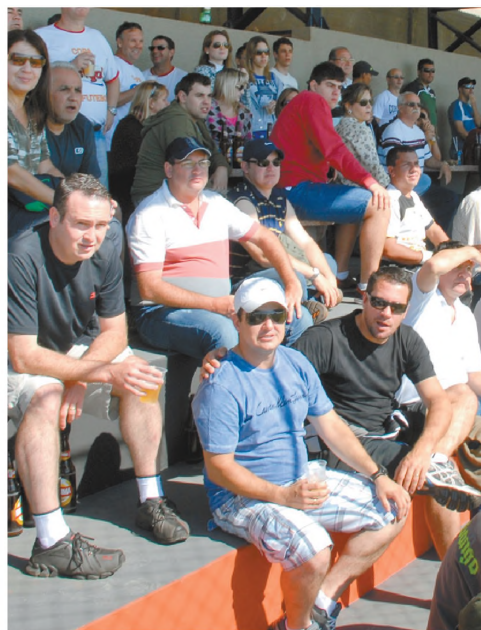
NATORCIDA Outra novidade das obras, as arquibancadas, foram tomadas por centenas de pessoas que prestigiaram o evento