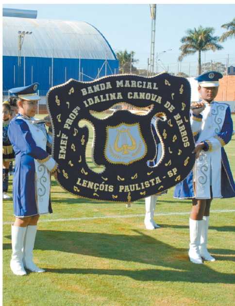
PARTICIPAÇÃO Banda marcial da escola Idalina Canova de Barros fez parte da solenidade de inauguração do campo