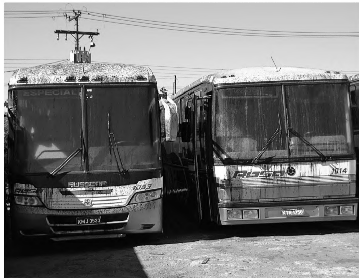
ACIDENTE - Explosão na Lwart lançou óleo em diversas casas e veículos no Jardim Nova Lençóis, nem os ônibus escaparam da sujeira

A explosão aconteceu por volta de 21h30 de sexta-feira 6. A mesma nota oficial garante que a empresa tomou todas as providências para conter o vazamento de asfalto do tanque e descartou o risco de novas ocorrências em