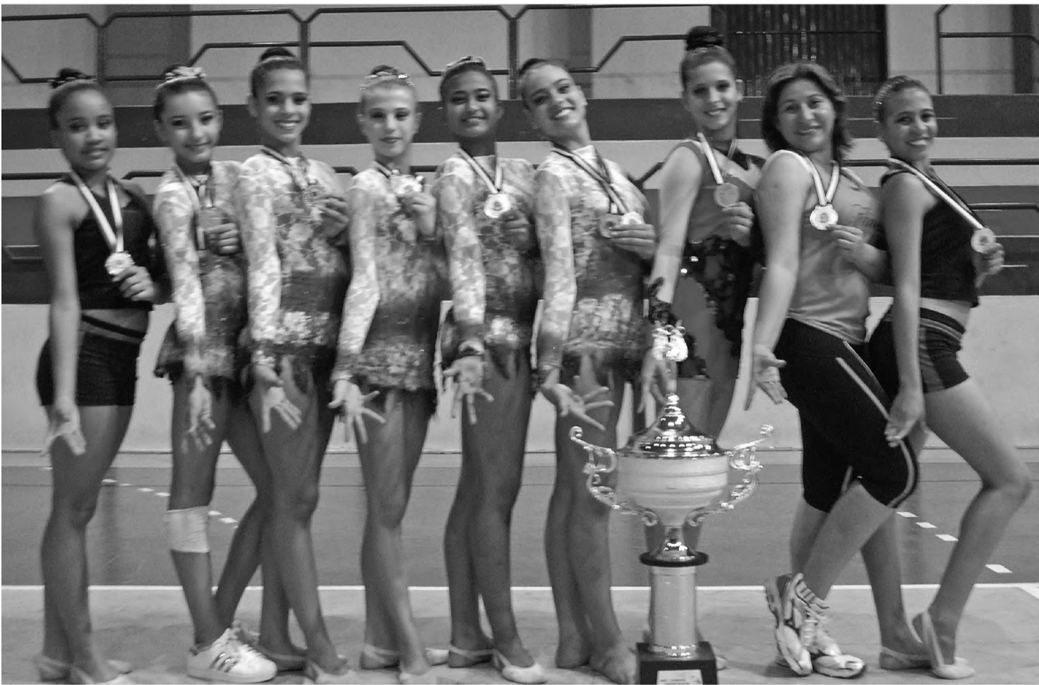
SHOW - Meninas da ginástica rítmica ficam em segundo nos Regionais