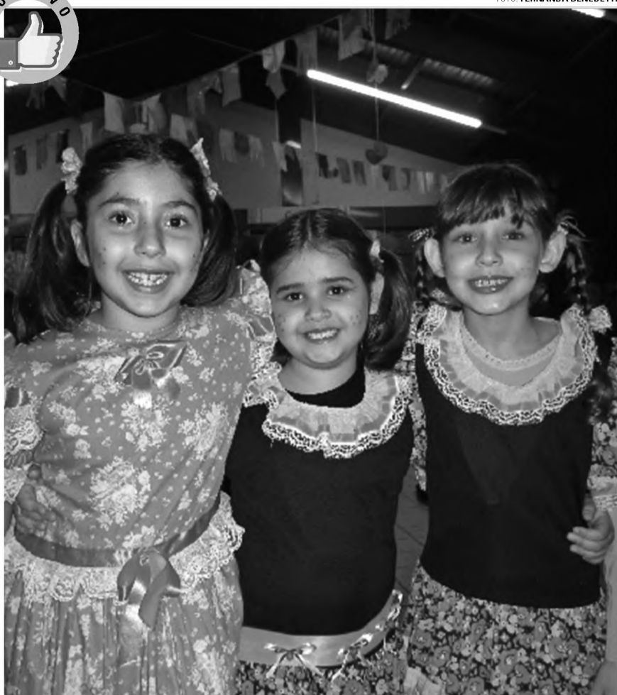
CAIPIRA - No sábado 30, aconteceu a Festa Junina do Colégio Liceu Francisco Garrido, no campus da Facol. A festa proporcionou aos convidados barracas típicas como cachorro-quente, mini-pizza, churrasco, refrigerante, touro mecânico, cadeia e muito mais. Houve também a apresentação de quadrilhas com a participação do Garrido Kids, Fundamental e Médio.