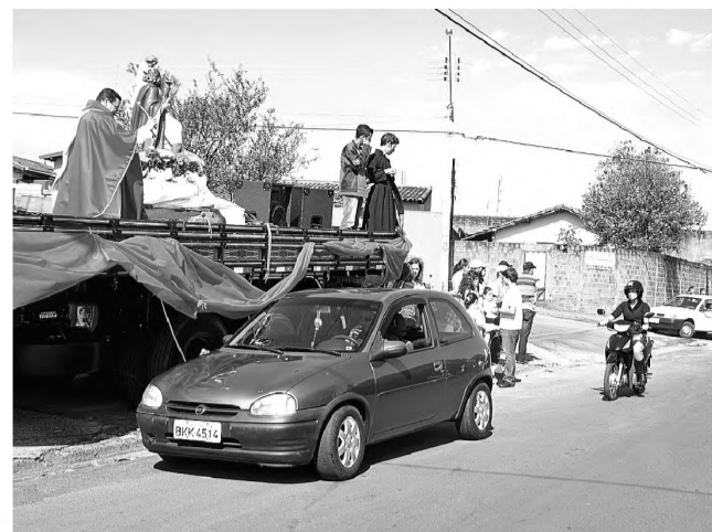
FESTIVIDADE - A festa que aconteceu aos sábados e domingos na Cecap durante o mês de julho termina domingo 29