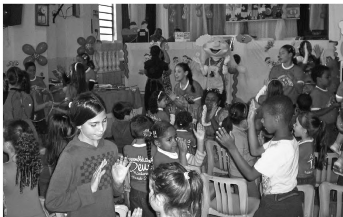
EVANGELIZAÇÃO - Centenas de crianças participaram da 6ª Edição da Escola Bíblica de Férias