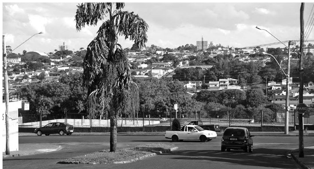
NOVIDADE - Rotatória não vazada vai ligar as avenidas Jácomo Nicolau Paccola e Cruzeiro do Sul; obra será em 2013

"No final da avenida dos Estudantes será construído um dispositivo", explicou, ao afirmar que parte da obra na região adquirida pela Prefeitura Municipal já foi concluí-