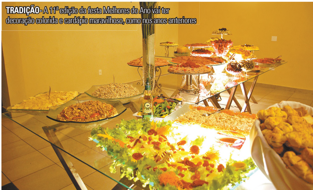
TRADIÇÃO - A 11ª edição da festa Melhores do Ano vai ter decoração colorida e cardápio maravilhoso, como nos anos anteriores