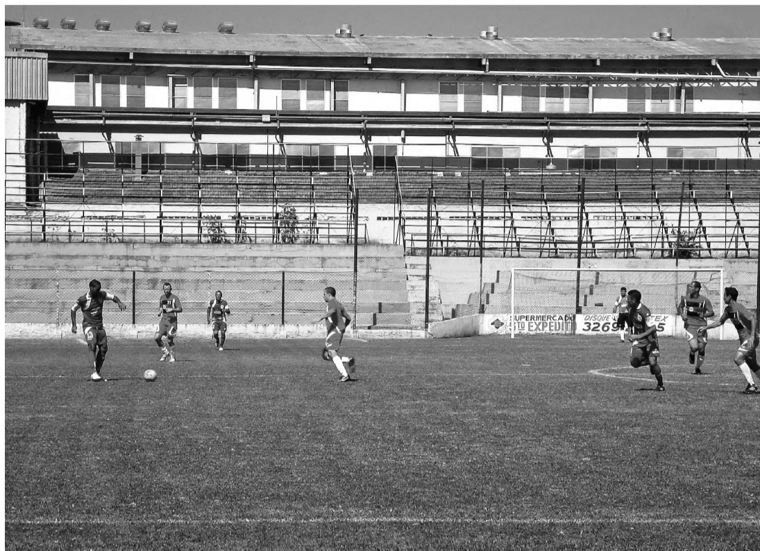
FINALISTA – Grêmio Cecap (azul) venceu nos pênaltis a equipe do Palestra e se classificou para a final da Copa O ECO