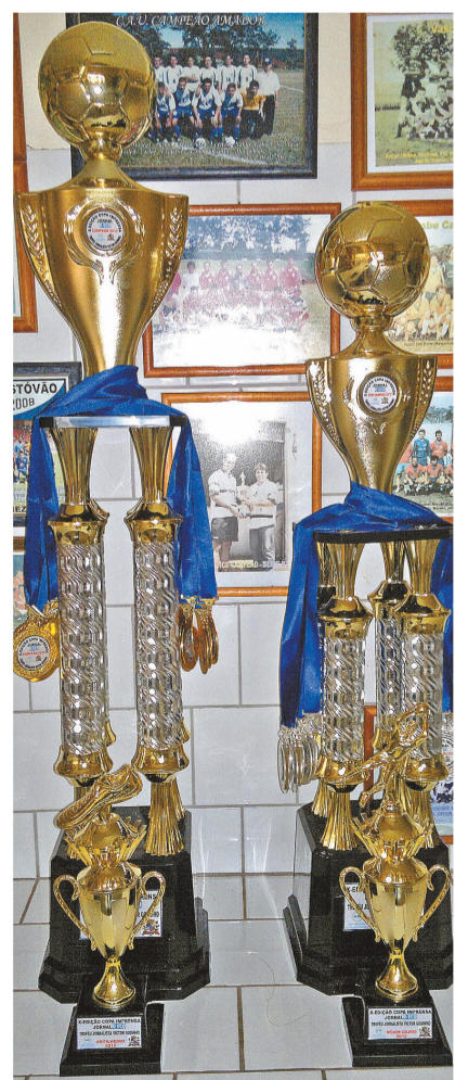
CAMPEÃO - Troféus que serão entregues para os finalistas da Copa O ECO