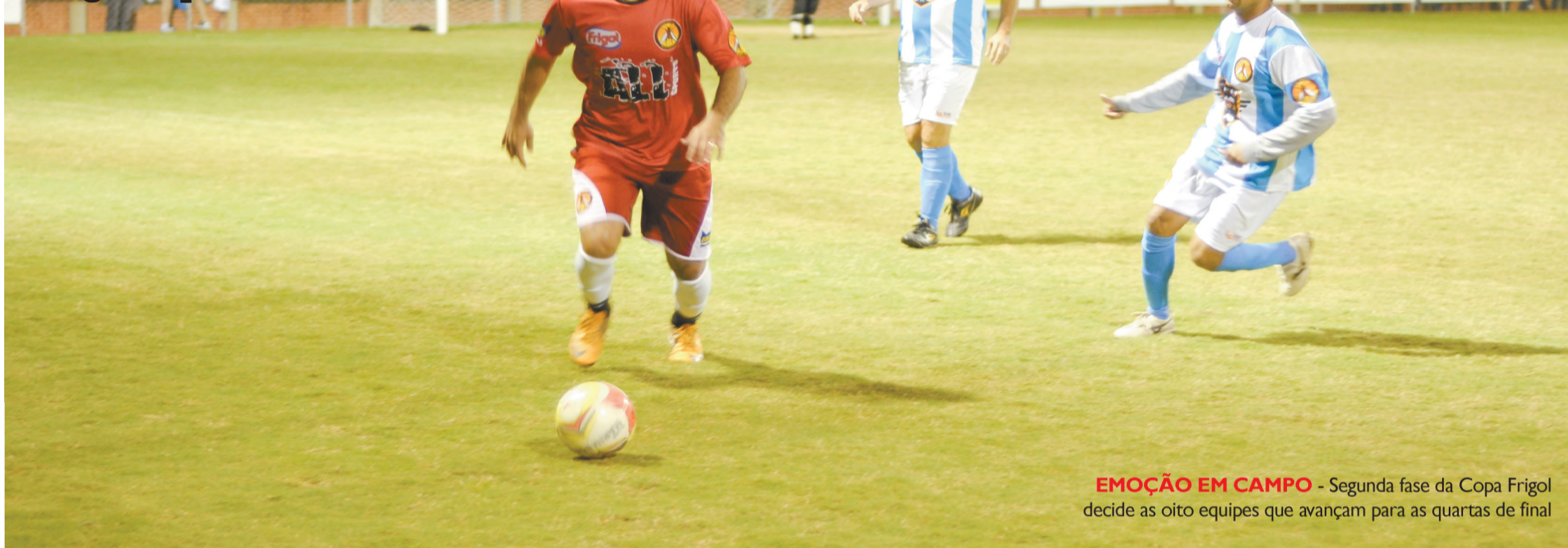
EMOÇÃO EM CAMPO - Segunda fase da Copa Frigor decide as oito equipes que avançam para as quartas de final

A emoção entra em campo na segunda fase da Copa Frigor; equipes se enfrentam em busca de vagas nas quartas de final