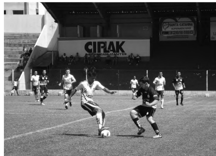
BREGÃO - Santa Luzia bateu o Paulistano por 1 a 0 na estreia