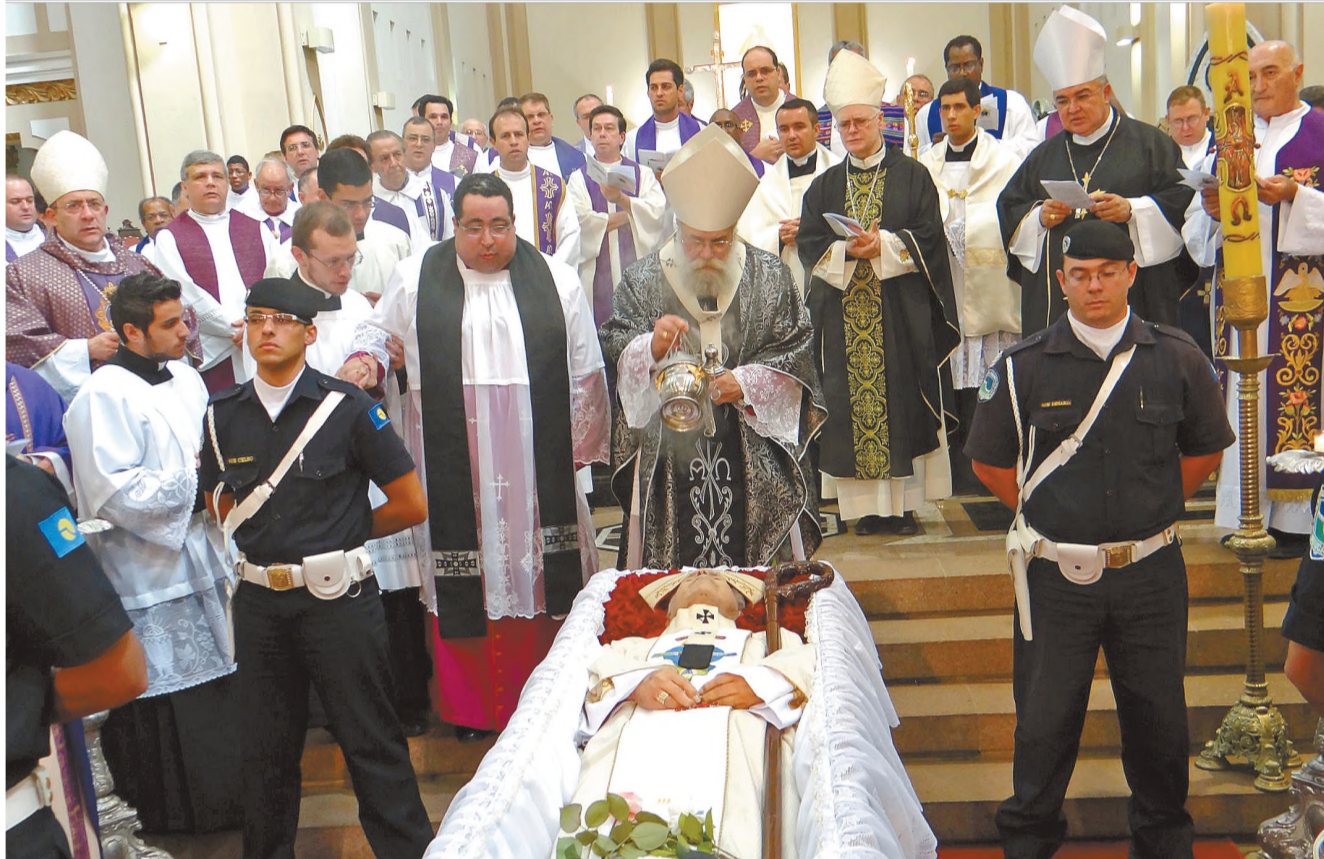
SOLENE - Missa na Catedral Santana de Botucatu marcou despedida de amigos e fiéis de arcebispo emérito