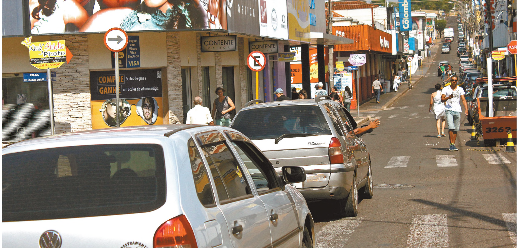
BOLADA - Maior parcela do dinheiro que esquenta a economia local neste final de ano deve ir para o consumo e outra parte será destinada para pôr as contas pessoais em ordem

O leite humano é fundamental na alimentação dos bebês, principalmente nos primeiros meses de vida. Doar leite é um gesto de amor e cidadania. Segundo o Ministério da Saúde, por ano, são recolhidos cerca de 150 mil litros de leite humano (foto) e são distribuídos a mais de 135 mil recém-nascidos, principalmente os que ficam hospitalizados. Em Lençóis Paulista, atualmente apenas 4 mães fazem a doação A2