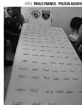
APREENSÃO - Polícias apreenderam 1037 pedras de crack no jardim Nilce, em Agudos, nesta terça-feira 30

Segundo informações da Polícia Civil, G.P.N. é irmão de L.P.N., 24 anos, preso há duas semanas também com grande quantidade de crack. Na ocasião, o Jornal o ECO noticiou a apreensão de 264 pedras de crack e mais 78 gramas da droga bruta, suficientes para fazer mais 300 pedras, no parque Pampulha. L.P.N., 24 anos, foi preso em flagrante e encaminhado a Cadeia Pública de Avaí.