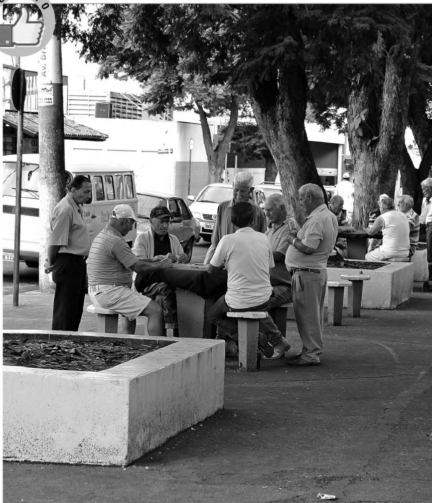
TRUCO! - Um grande número de pessoas aproveitou a tarde quente de ontem para se reunir na praça ao lado do ginásio de esportes Antônio Lorenzetti Filho, o Tonicão. No local, todas as mesas estavam tomadas e havia até fila de espera.