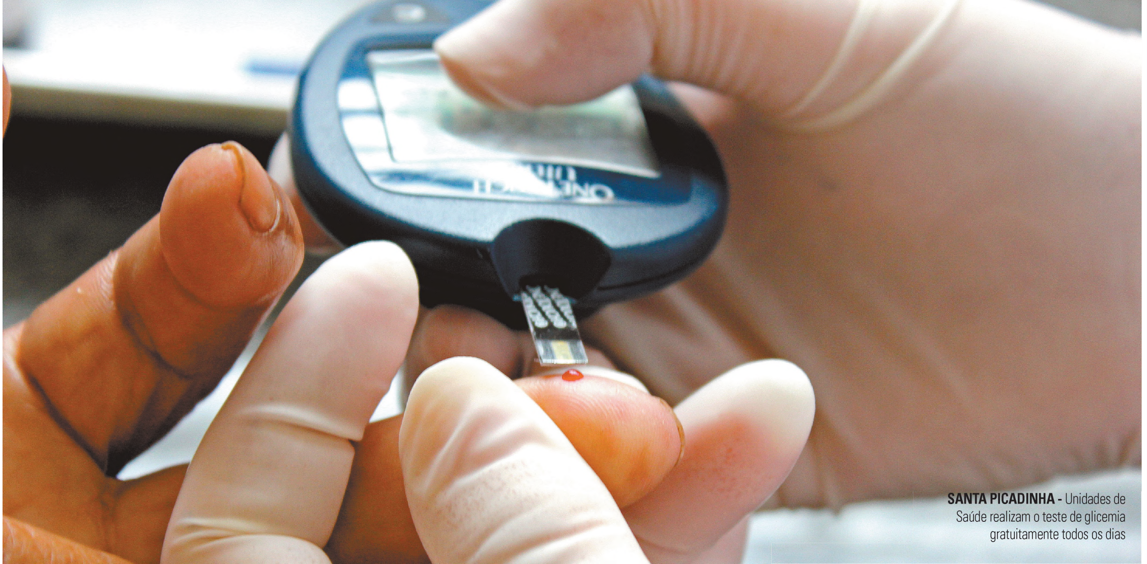
SANTA PICADINHA - Unidades de Saúde realizam o teste de glicemia gratuitamente todos os dias