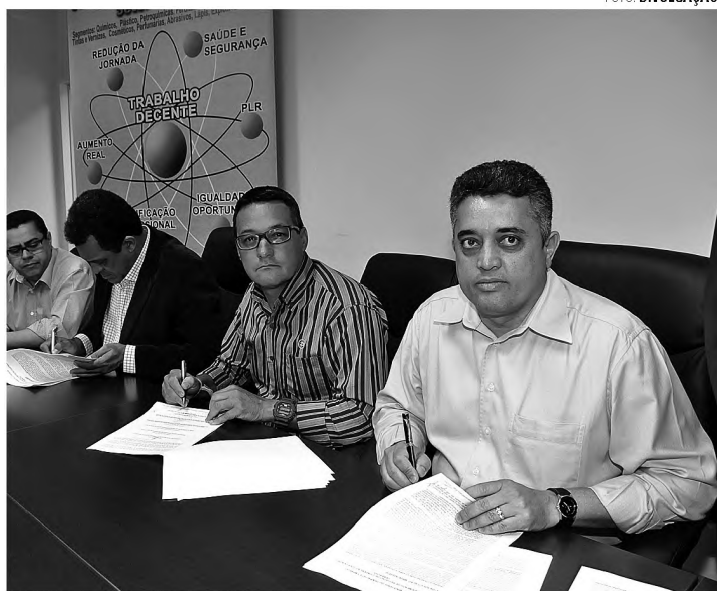
ACORDO – Assinatura de acordo coletivo de setor químico ocorreu ontem

Com o reajuste, o piso salarial para o trabalhador de empresa com até 50 funcionários passa de R$ 980 para R$ 1.056 e a PLR (Participação nos Lucros e Resultados) vai para R$