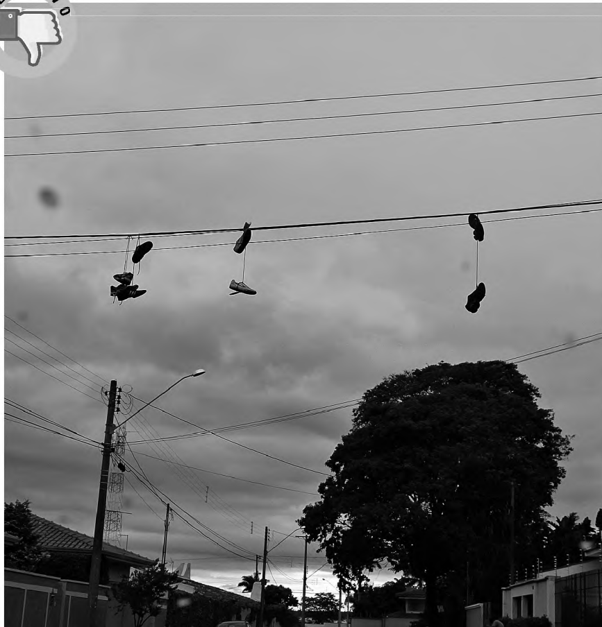
Poluição mental - Algumas brincadeiras de mau gosto podem causar transtornos e até acidentes graves quando o assunto é eletricidade. Ao longo da rua Castro Alves, no jardim Ubirama, vários tênis amarrados pelo cadarço ficam pendurados, o que pode causar algum curto circuito.