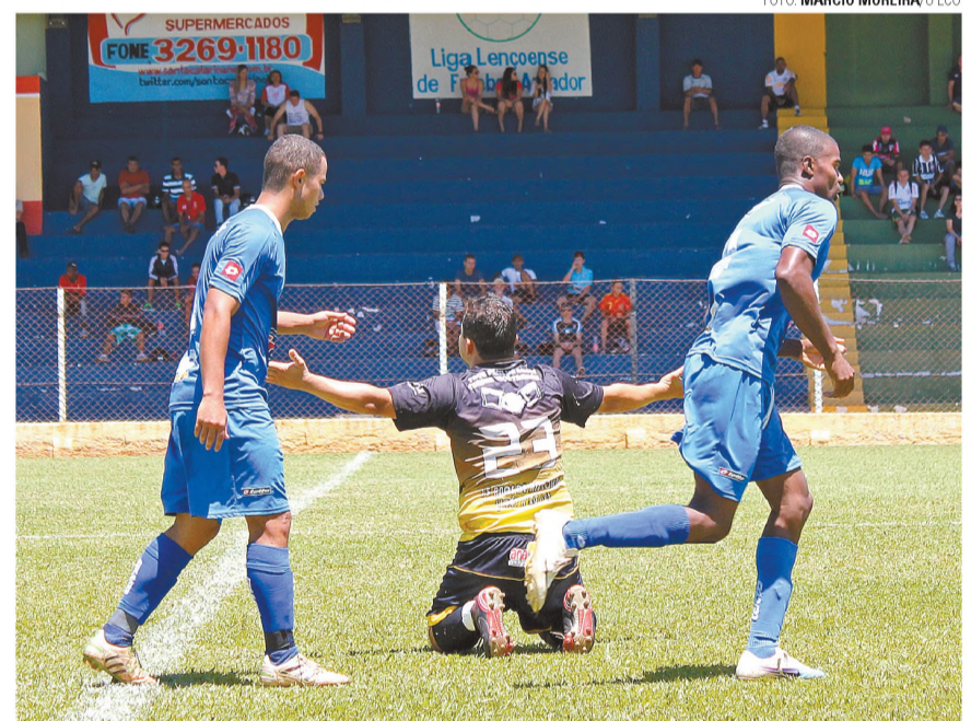
NO CHÃO - Jogador do Santa Luzia reclama de falta não marcada em jogo no domingo