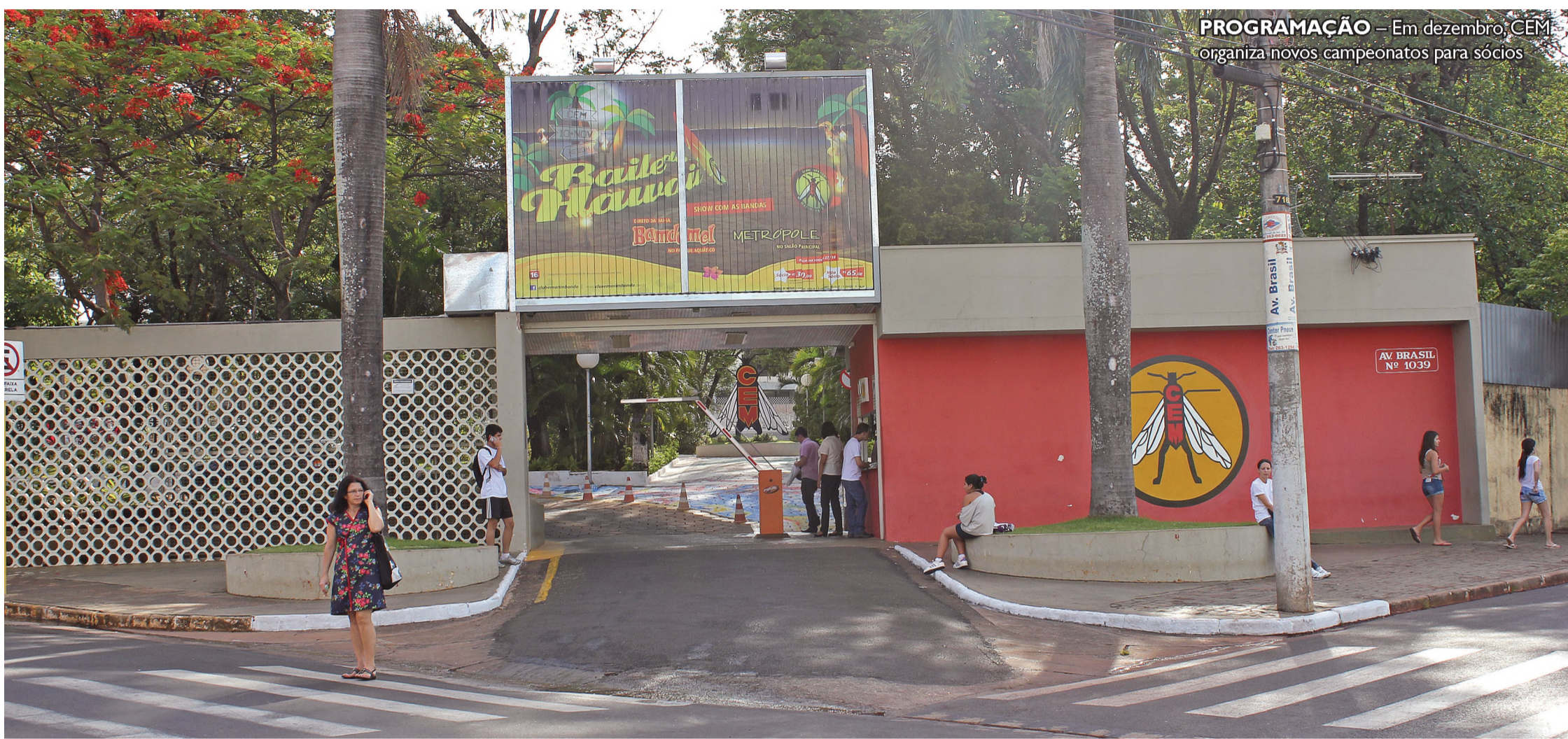
PROGRAMAÇÃO – Em dezembro, CEM organiza novos campeonatos para sócios

Inscrições vão até o dia 28 e são gratuitas; competições serão realizadas em dezembro