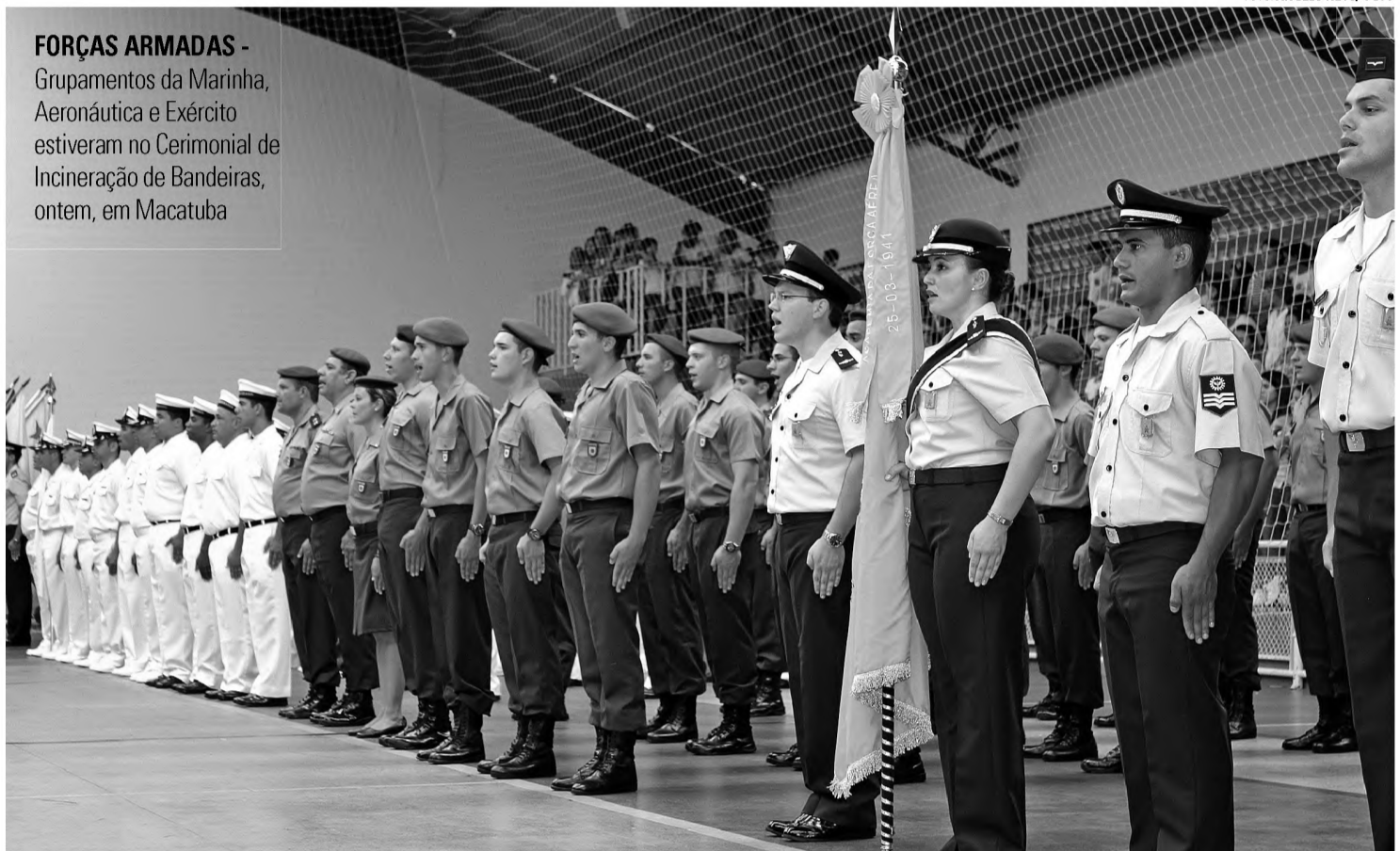
FORÇAS ARMADAS - Grupamentos da Marinha, Aeronáutica e Exército estiveram no Cerimonial de Incineração de Bandeiras, ontem, em Macatuba

Aeronáutica, Marinha e Exército participaram do 6º Cerimonial de Incineração de Bandeiras