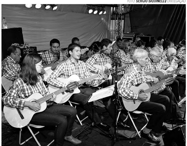
BOCA DO SERTÃO - Formada há quatro meses, orquestra de viola e violão se apresenta amanhã