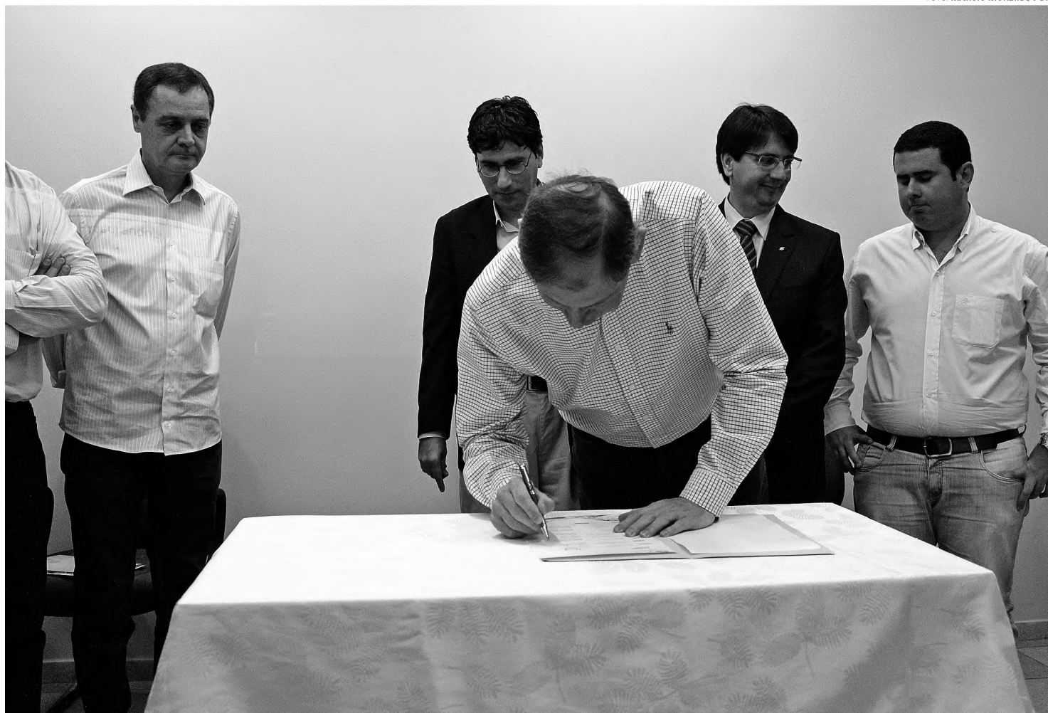
LEGENDA – ASSINADO – Zilor, Ascana e prefeituras assinaram acordo com programa Água Brasil

"Essa parceria surgiu quando a Zilor, participando