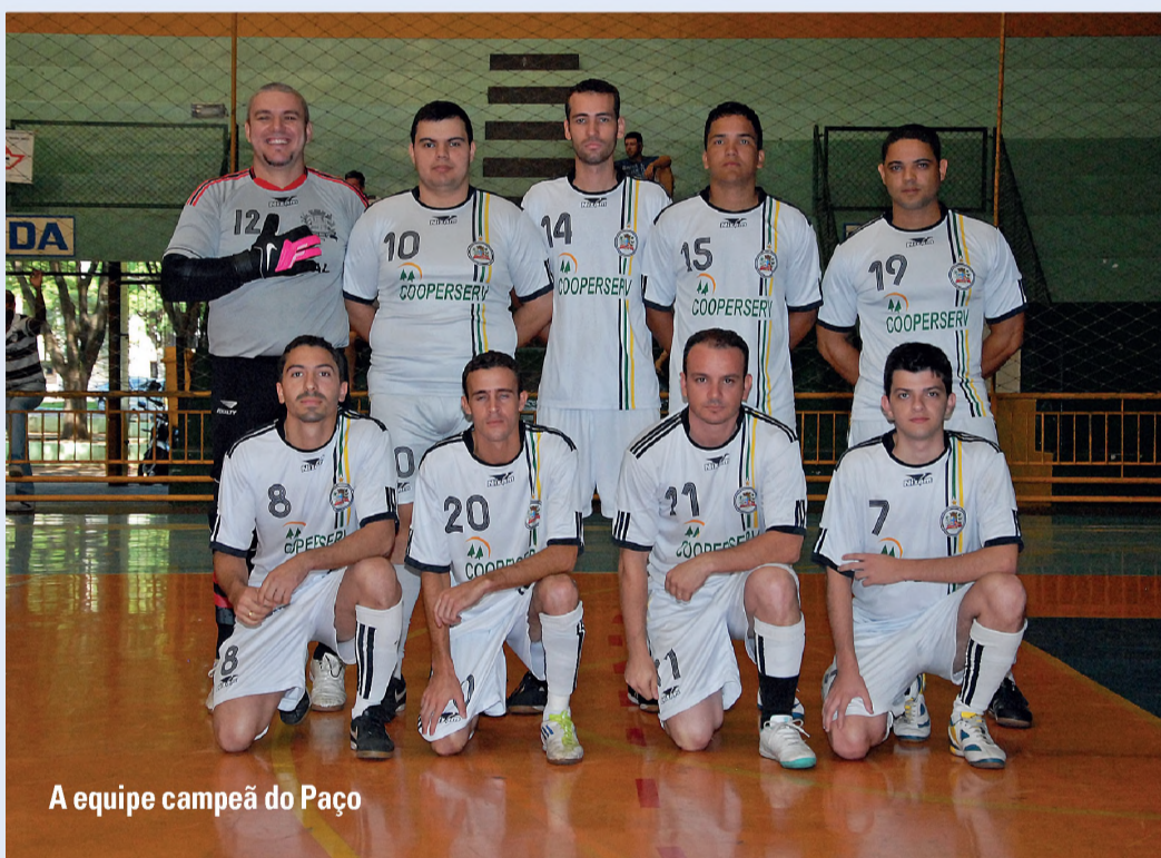
A equipe campeã do Paço

O campeonato teve início em novembro, com sete equipes disputando a primeira fase: Informática, Meio Ambiente, Paço Municipal, Saúde, Almoxarifado, SAAE e Legionários.