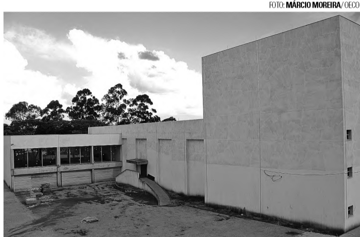
Com novas doações, Teatro pode ser entregue em 2015

"Foi uma surpresa muito boa", disse a prefeita. Ela lembra que as obras nunca foram interrompidas, mas por conta das doações, devem ritmo acelerado em 2014. A prefeita explicou que com os novos recursos, serão realizadas obras de revestimento acústico,