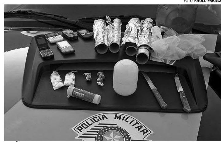
TRÁFICO - Força Tática detém jovem de 23 anos em Agudos

F.G. já tinha envolvimento no tráfico de drogas e também cumpriu pena por roubo. Ele foi encaminhado ao Plantão Policial, onde foi elaborado flagrante de tráfico de entorpecentes. O acusado foi conduzido à Cadeia Pública de Avaí