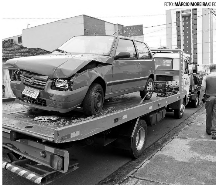
FURTO - Fiat Uno vermelho usado pelo assaltante durante a fuga

Pouco tempo depois, por volta de 12h, outra ocorrência com as mesmas características