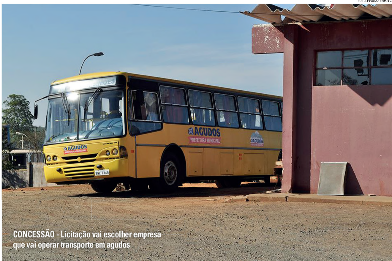
CONCESSÃO - Licitação vai escolher empresa que vai operar transporte em agudos