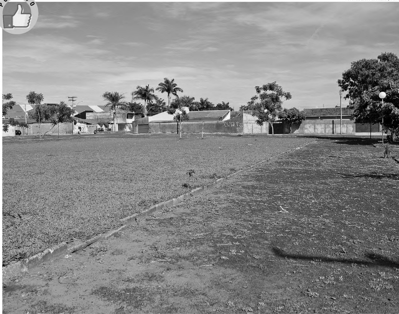
INICIATIVA - Moradores dos jardins Nova Lençóis e Nações vão entregar esta semana, na Prefeitura, um abaixo-assinado solicitando a construção de uma academia ao ar livre e uma pista de caminhada na praça do jardim Nações.