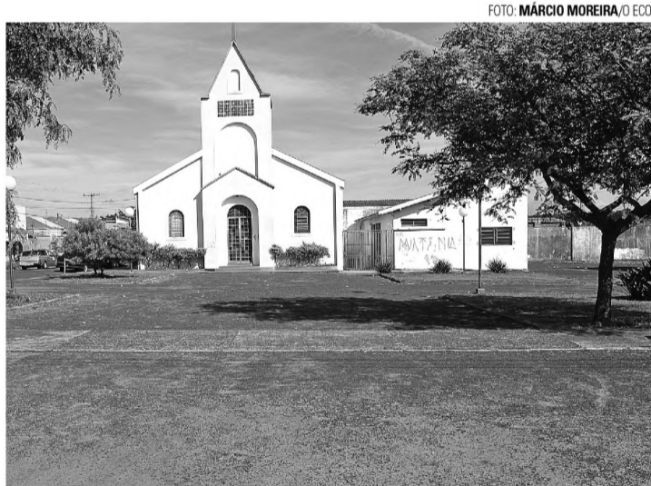
COMEÇA HOJE - Praça da capela Mãe Rainha, no jardim das Nações, será totalmente reformada; projeto inclui paisagismo, revitalização e calçamento