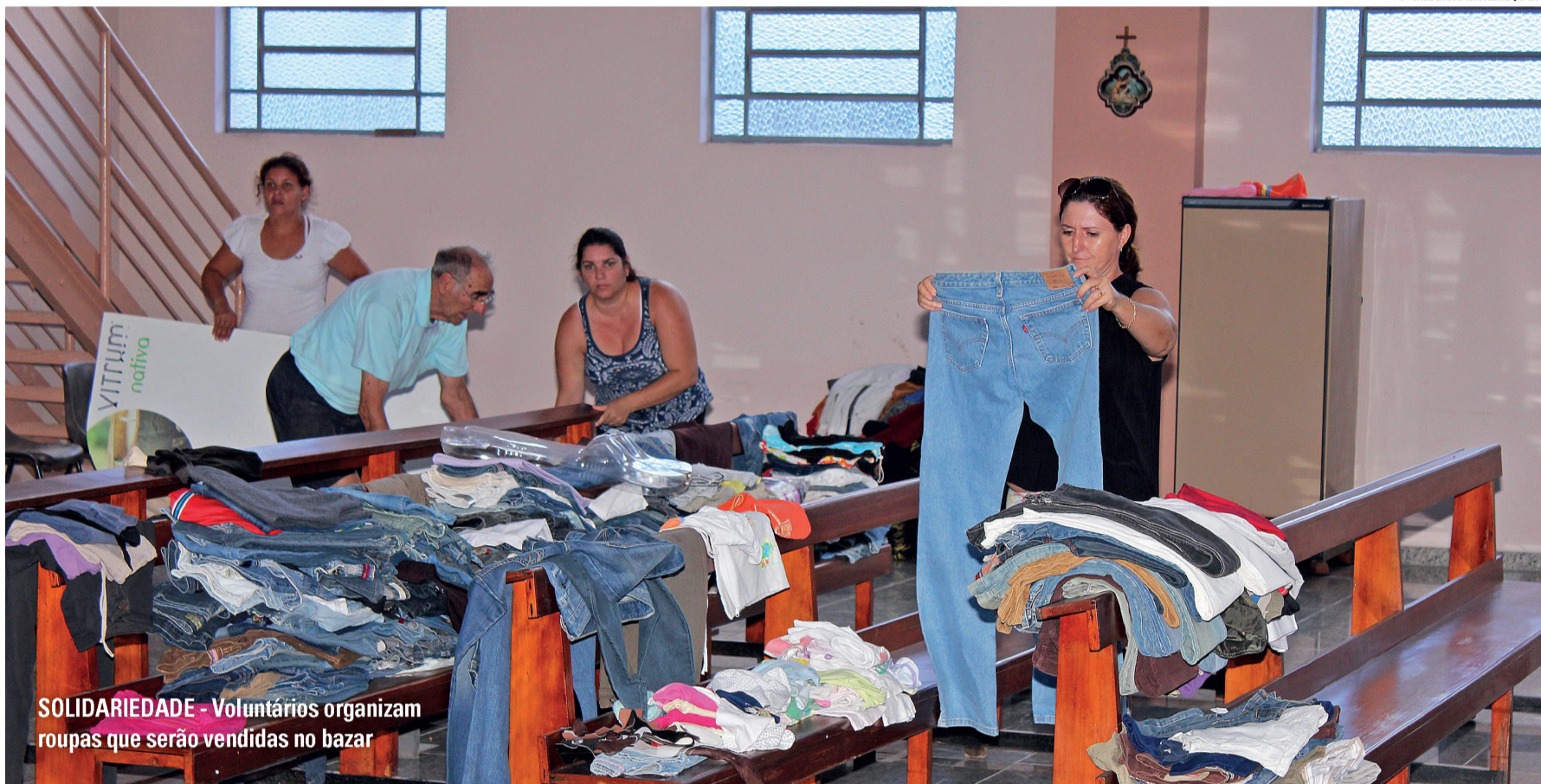
SOLIDARIEDADE - Voluntários organizam roupas que serão vendidas no bazar