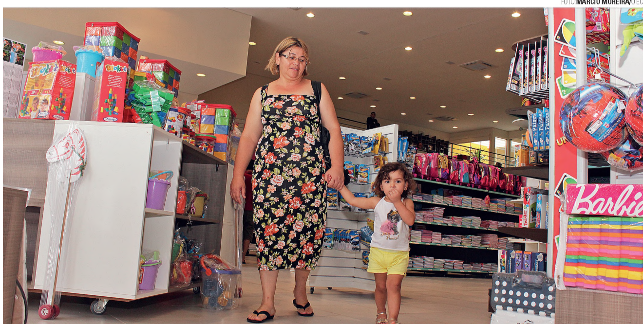
DESAFIO - Justiça proíbe venda de andadores; médica comemora medida e afirma que equipamento prejudica desenvolvimento infantil