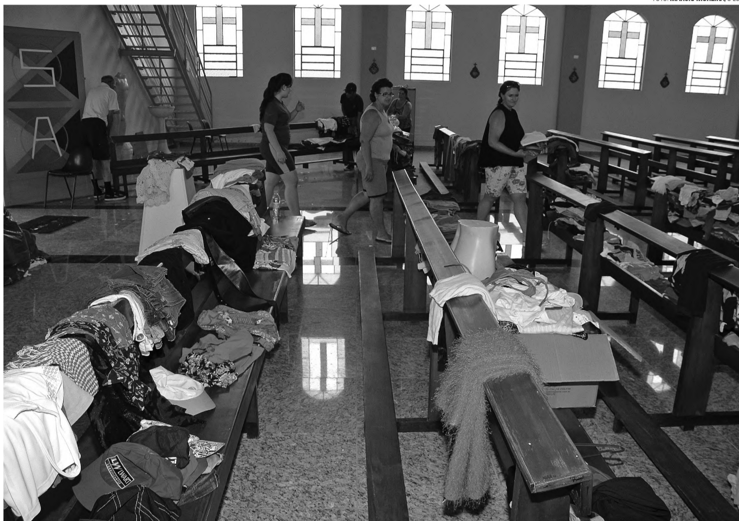
PREPARATIVOS - Voluntários organizam peças de roupas para Megabazar; com verba arrecadada será paga a mão de obra da colocação do piso da Capela

A voluntária lembra também que o bazar tem uma dimensão social, importante função da igreja. "No Bazar, cada peça custa R$ 2. É um preço acessível tanto para ajudar na construção da Igreja quanto para auxiliar pessoas que não tem dinheiro para comprar novas peças".