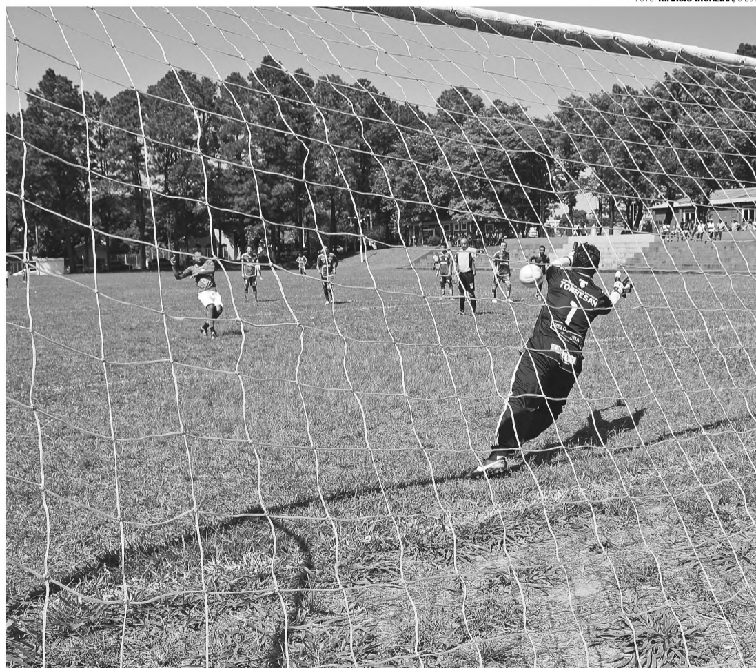
TRADIÇÃO - O Grêmio Cecap levou a melhor contra o rival Palestra vencendo por 1 a 0 em cobrança de pênalti

O Grêmio Cecap garantiu a vitória contra o Palestra por 1 a 0. "O jogo foi difícil, dá para perceber pelo placar. Esse é um campeonato em que todo mundo tem grande ambição e nesse jogo não foi diferente. Início de campeonato, busca por pontuação para ter uma classificação mais tranquila, tudo isso deixa