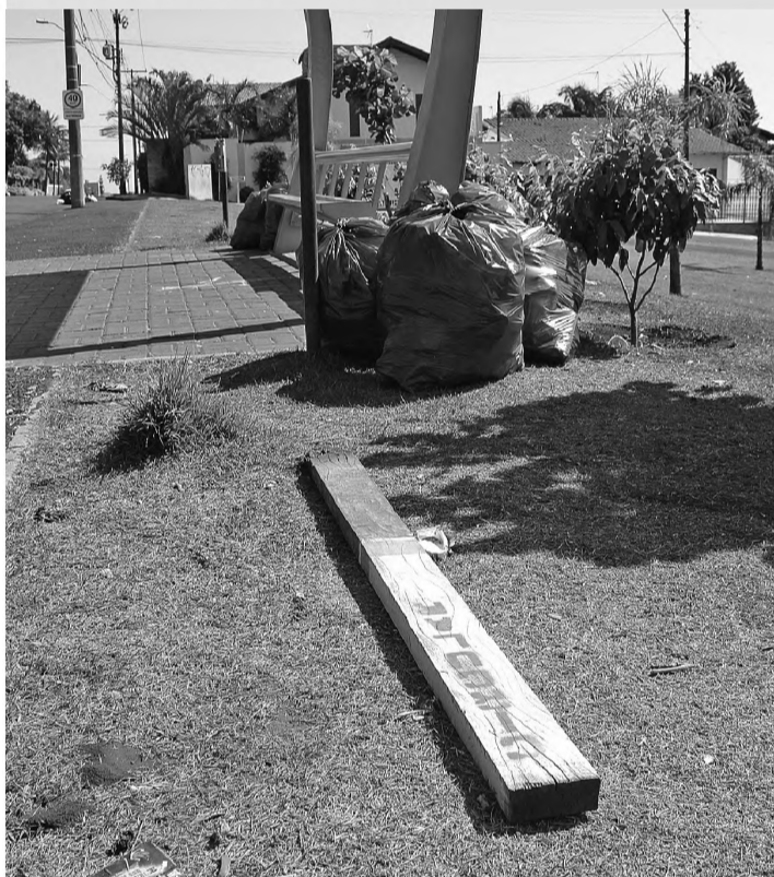
CAOS - Jovens abusam e incomodam moradores do Parque Antártica e Jardim Bela Vista