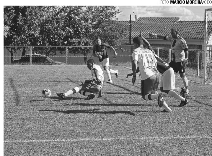
APERTADO - Nova Lençóis consegue vencer Ressaca por 2 a 1 em jogo difícil

Em jogo difícil, equipe lençoense garantiu a vitória por 2 a 1 contra a equipe de Macatuba