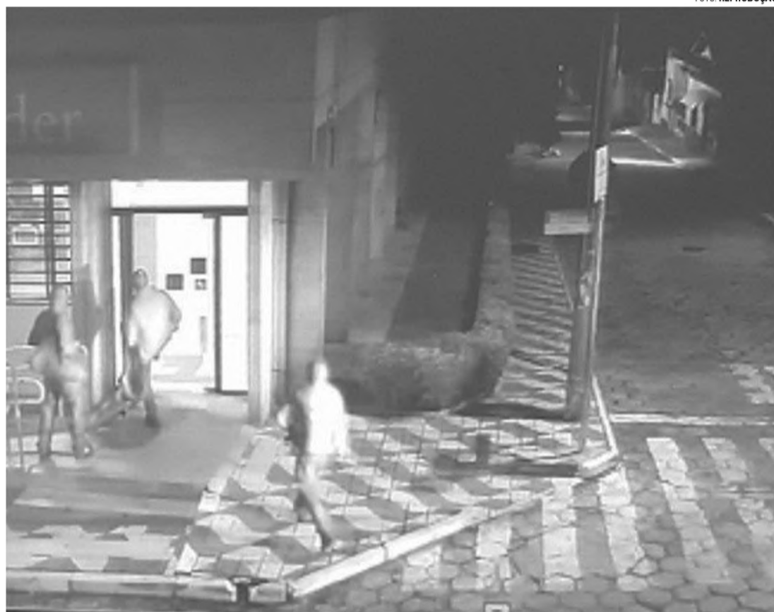
AÇÃO - Câmera de segurança registra momento em que três ladrões invadiram o caixa eletrônico, antes da explosão

O veículo de trabalhadores ficou parado na rua Manoel Ribeiro, perto dos dois caixas eletrônicos que foram explodidos. Uma das ações foi registrada por câmeras de segurança e mostra três homens arrombando a porta, carregando explo-