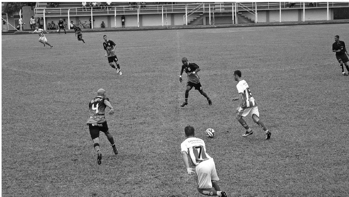
É CAMPEÃO - O Expressinho fez uma boa campanha e pela primeira vez leva o título da Copa Regional O ECO

O primeiro tempo foi equilibrado. O Monte Mor respondia à altura as investidas do Expressinho. Era ataque de um lado, contra-ataque de outro. Mas a pontaria das equipes deixou um pouco a desejar. Apesar de muitas oportunidades criadas, os goleiros tiveram pouco trabalho. Os gols até saíram, um para cada lado, mas ambos foram anulados por impedimento. E assim terminou a primeira etapa, empatada em