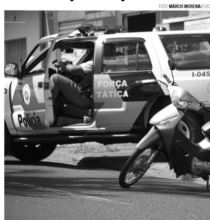
PM NA RUA – Atividade delegada vai garantir mais duas viaturas na rua

O programa atividade delegada conta com o trabalho de policiais em horário de folga contratados pela Prefeitura Municipal. Os policiais tra-