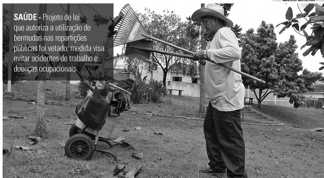
SAÚDE - Projeto de lei que autoriza a utilização de bermudas nas repartições públicas foi vetado; medida visa evitar acidentes de trabalho e doenças ocupacionais

“Em muitos casos, a calça comprida é um EPI (Equipamento de Proteção individual). A vestimenta tanto protege do sol quanto do contato com agentes nocivos a saúde de funcionários que atuam em serviços externos. O trabalhador que lida com materiais quentes, por exemplo, precisa de vários EPIs para que não se queimem. Quando autorizamos um uso indiscriminado de bermudas, geramos uma confusão no serviço