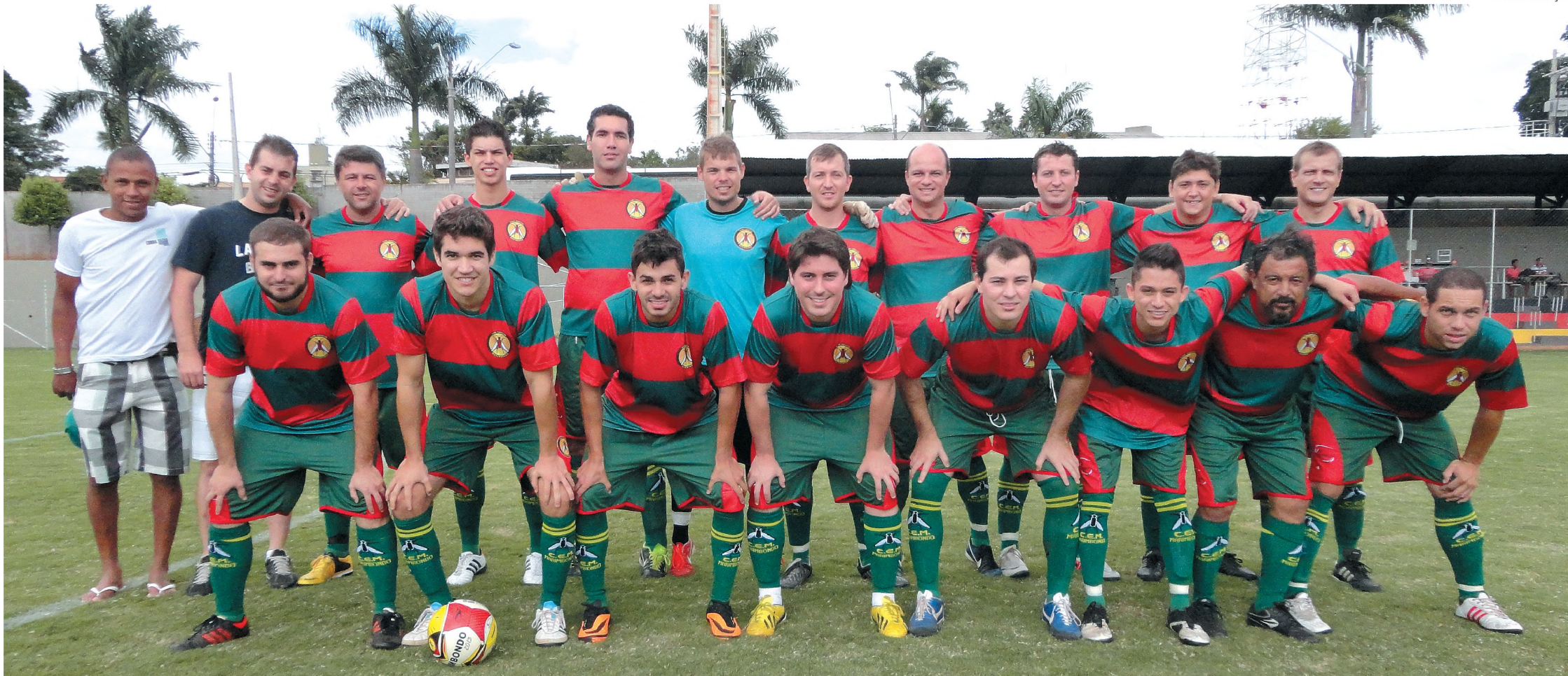
100% – Alemanha, do capitão Gabi, está na liderança do campeonato com duas vitórias em dois jogos