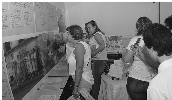
LEMBRANÇAS - Salas de aula ganham exposições de fotos, mobiliários, uniformes e documentos históricos na comemoração do centenário do Esperança.