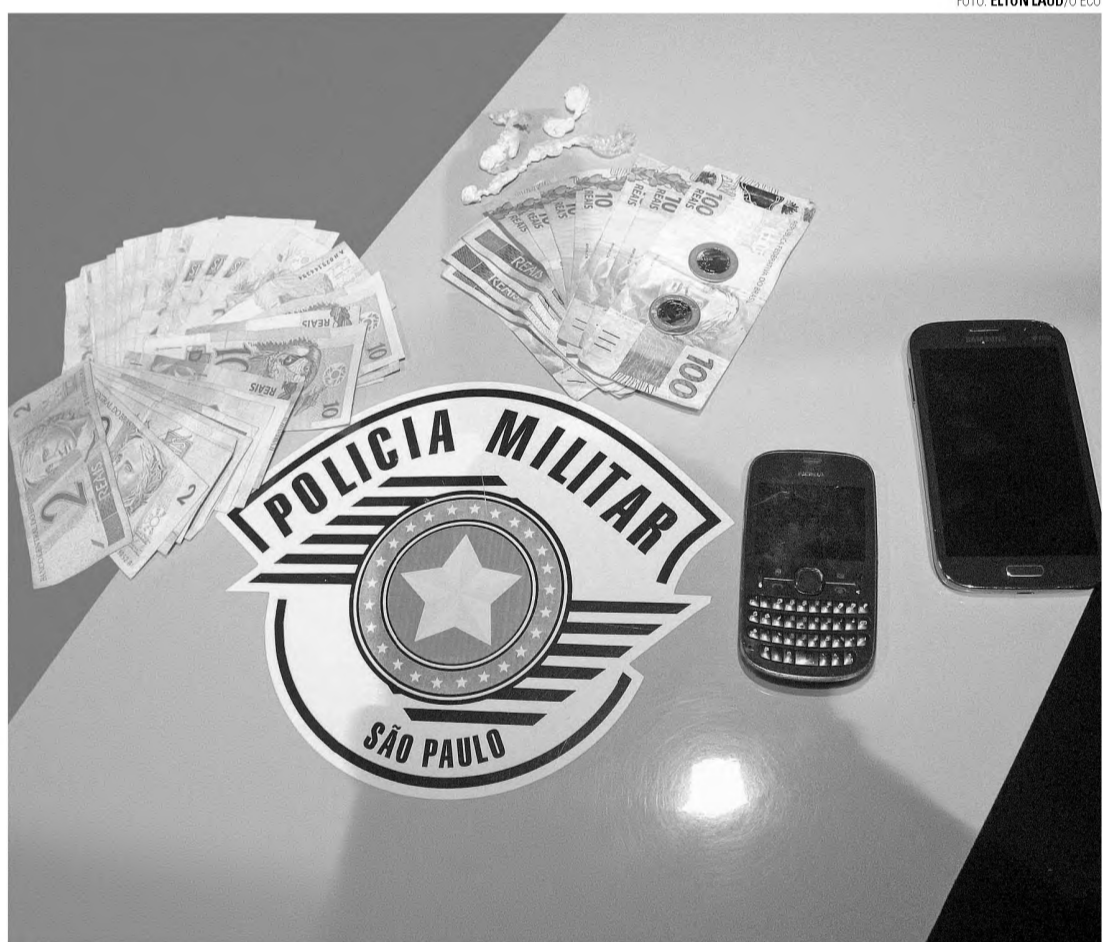
OPERAÇÃO – Polícia Militar apreendeu droga, dinheiro e celulares com jovens na noite de sábado

A Polícia Militar realizou no sábado à noite a Operação Saturação, na Avenida Padre Salústio