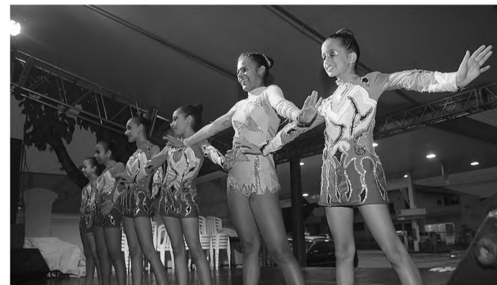
INTEGRAÇÃO - Grupos de dança da cidade se apresentaram durante a tarde, em frente a escola Esperança de Oliveira. Durante todo o dia houve apresentação de fanfarras também.

A Empresa F.A. MARTINS & E.A. GODOI LTD.-EPP com CNPJ Nº 05.061.576/0001-82. Localizada na Rua Paraná nº111, Jardim Cruzeiro, Lençóis Paulista-SP. Declara para os devidos fins que foi extraviado seu TALÃO DE NOTAS FISCAIS DE PRESTAÇÃO DE SERVIÇOS com as seguintes notas de Nº 051 a 100, portanto não se responsabiliza pelo uso indevido do mesmo. Lençóis Paulista 08 de Abril de 2014.