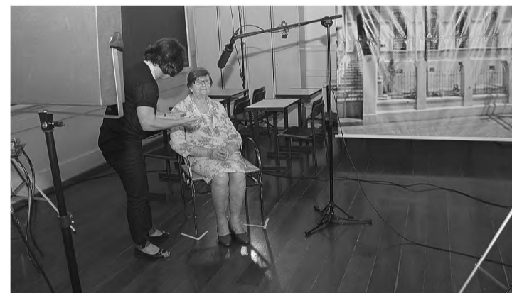
COLABORAÇÃO - Em um ambiente reservado, ex-alunos e ex-funcionários puderam dar depoimentos sobre momentos que viveram no Esperança; material de gravação e escrito deve ser lançado ainda neste ano.