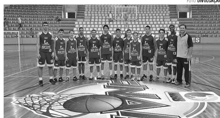
SUB 17 - Equipe lençoense vence mais uma e seguem vivos na competição

guns problemas e viajaram desfalcados para a partida, mas embalados pela vitória da semana passada, diante da forte equipe de Santo André, conseguiram na