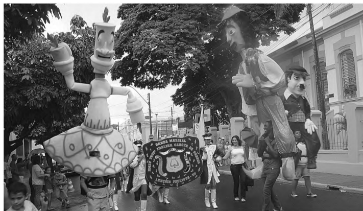
PELAS RUAS - Embalados pela Banda Marcial da escola Idalina Canova de Barros, nem a chuva espantou o público no desfile de bonecos gigantes, evento que integrou o Festival Internacional de Bonecos