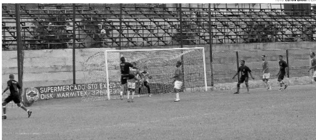
JOGO AÉREO - Em desvantagem no placar, o Sport abusou das jogadas aéreas, mas não conseguiu reverter os 4 a 0

Na segunda etapa, não tinha outra solução para o Sport a não ser ir para o tudo ou nada, mas o nervosismo da