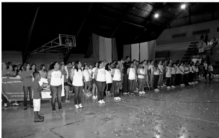
SOLENIIDADE - Abertura reúne atletas e autoridades locais no Tonicão