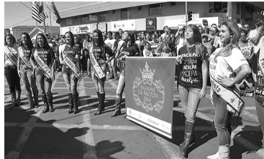
RAINHAS - As 12 finalistas do concurso Rainha da Facilpa 2014 presentes durante o desfile cívico. A escolha da campeã estava marcada para a noite de ontem.

o principal objetivo do evento de ontem. Com o tema ‘Ler é colorir a vida’, cerca de dois mil alunos da Legião Mirim feminina e masculina, seguidos de escolas municipais, estaduais, particulares, fanfarras e bandas deram um colorido especial ao desfile. Cada escola do município representou uma cor e trouxe uma frase sobre leitura. Durante as 2h30 de evolução dos participantes, alunos acenavam