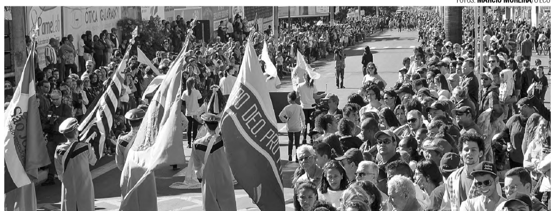
PÚBLICO - Mais de cinco mil pessoas compareceram à Avenida Padre Salústio para acompanhar o desfile cívico em comemoração aos 156 anos de Lençóis Paulista

Revelar e promover o trabalho realizado dentro das salas de aula e das bibliotecas municipais. Este foi