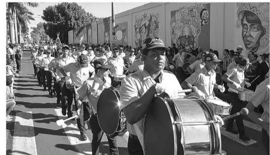
MARCHA - Os integrantes da Legião Mirim, masculino e feminino, abriram o desfile cívico em comemoração aos 156 anos de Lençóis Paulista.