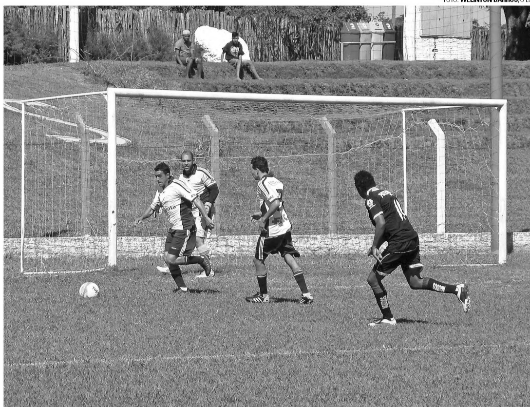
TROPEÇOU - Prefeitura de Agudos perdeu para Tecnocana por 3 a 0 no estádio Achilles Sormani

O final de semana terminou com uma goleada da equipe da Angicos sobre a Duraflora por 6 a 1. Já a Duratex levou a melhor sobre a equipe da Gera Arte por 3 a 1 e segue firme na busca pelo título. A equipe da Mid West venceu a Promarket por W.O. Promarket que já está eliminada da competição em 6º lugar no grupo A.