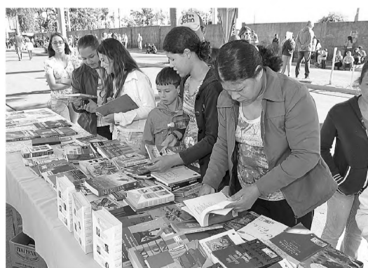
BOM EXEMPLO - Rotaract fez doação de 250 livros durante desfile cívico; Lions realizou mil testes de diabetes

Quem compareceu a avenida Padre Salústio Rodrigues Machado pode escolher um dos 250 títulos de livros distribuídos gratuitamente pelos jovens do Rotaract. O projeto batizado de “Parabéns Cidade do Livro” surgiu da união do tema do desfile - Ler é colorir a vida -, com o objetivo do grupo, que é au-