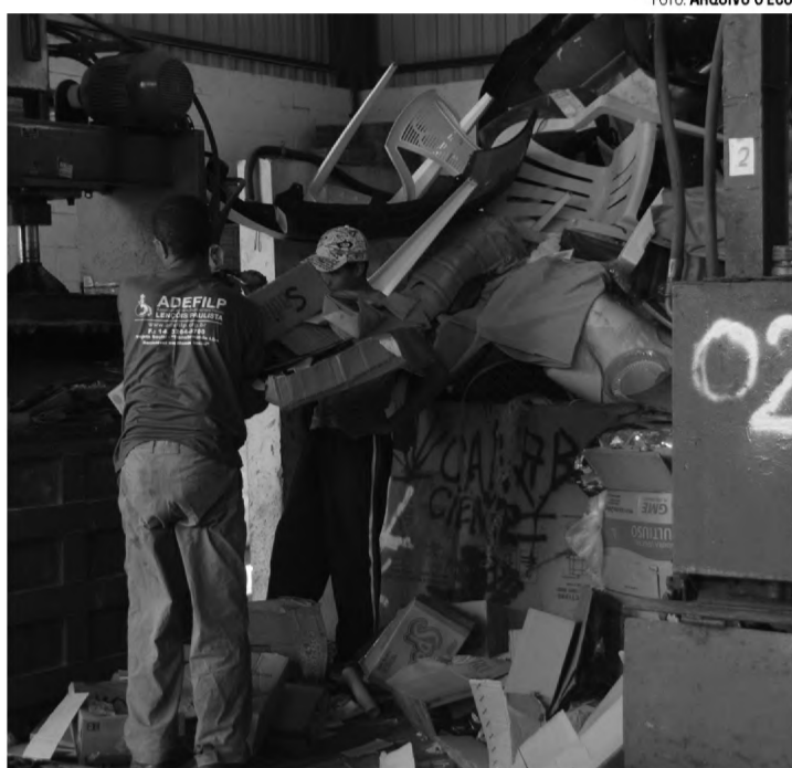
RENDA - Adefilp está prestes a completar a 'maioridade'; no sábado, entidade completa 17 anos