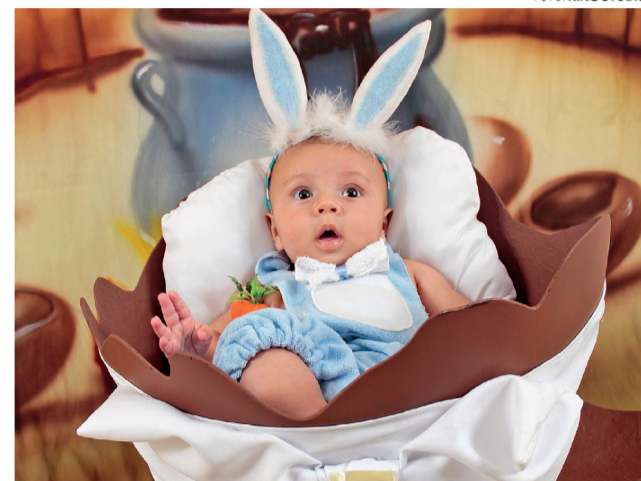
• Marcos se fantasiou de coelhinho, 3 meses