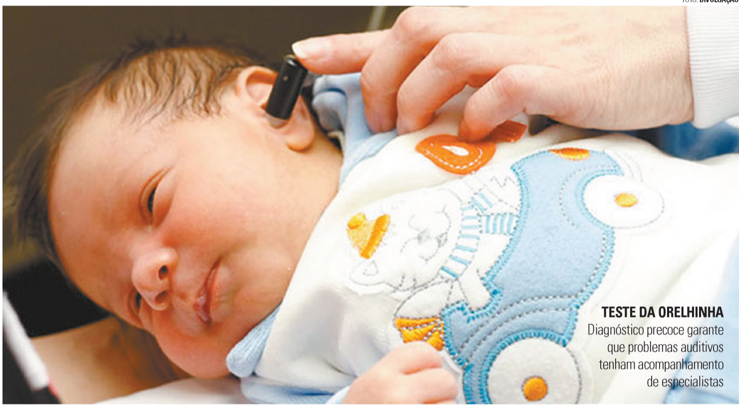
TESTE DA ORELHINHA Diagnóstico precoce garante que problemas auditivos tenham acompanhamento de especialistas

O teste e acompanhamento são gratuitos e estão disponíveis na rede municipal de saúde